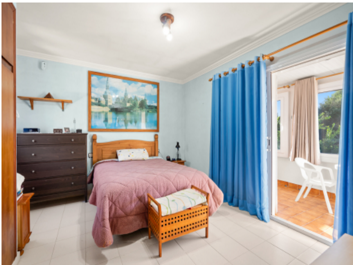
Schlafzimmer im Obergeschoss