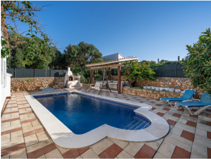
Pool mit Grillbereich