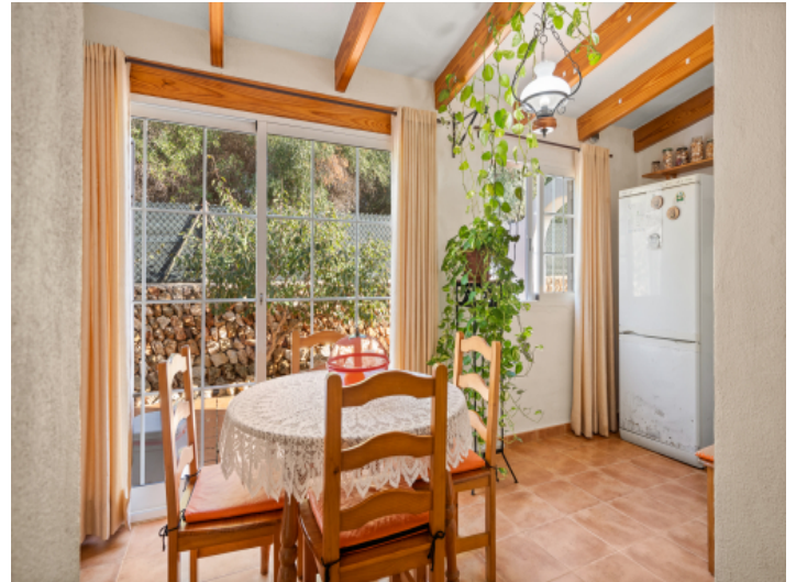
Heller Essbereich mit Terrassenzugang