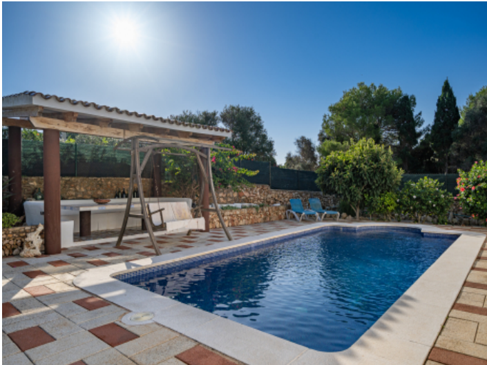
Schöner Poolbereich mit Sitzbereich