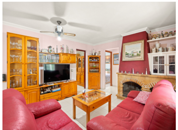
Komfortabler Wohnbereich mit Kamin