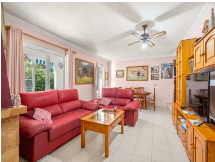
Wohn-und Essbereich mit Terrassenzugang