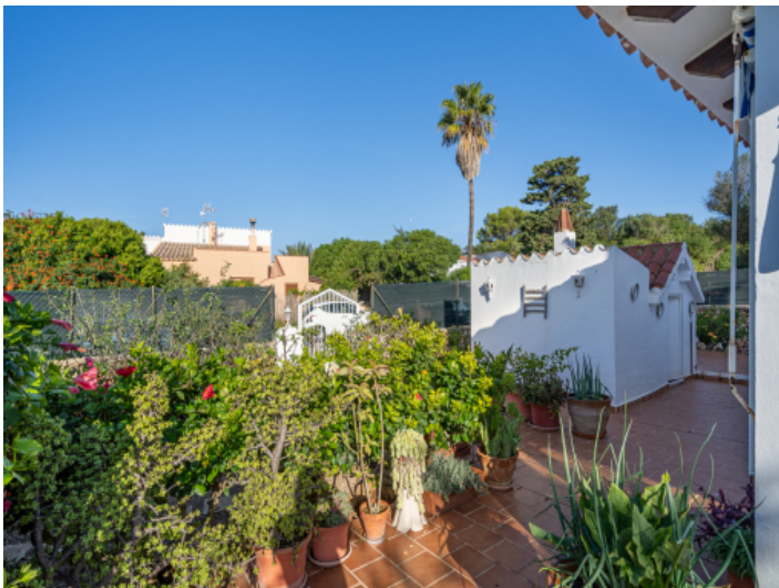
Idyllischer Zugang zum Haus