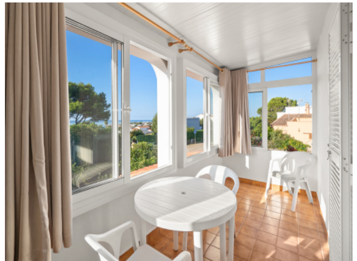
Angrenzende, geschlossene Terrasse mit Meerblick