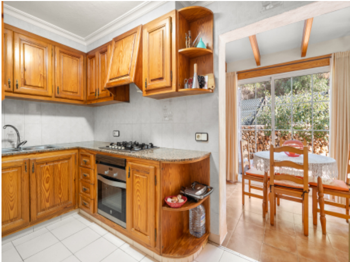
Holzküche mit separatem Essbereich