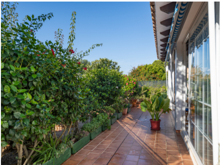
Schön bepflanzte Terrasse