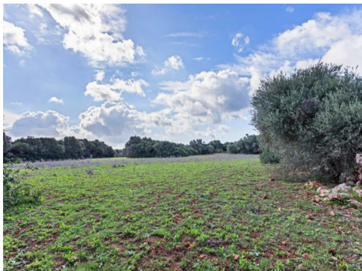
Ansicht des Grundstücks