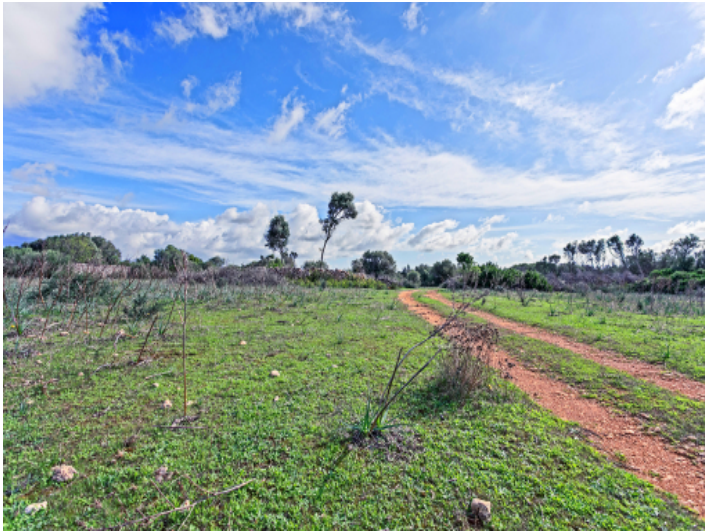
Großes Grundstück von 22 ha