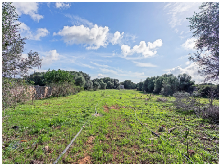
Ansicht des Grundstücks