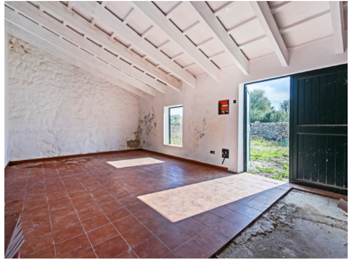
Eingang zum Haus