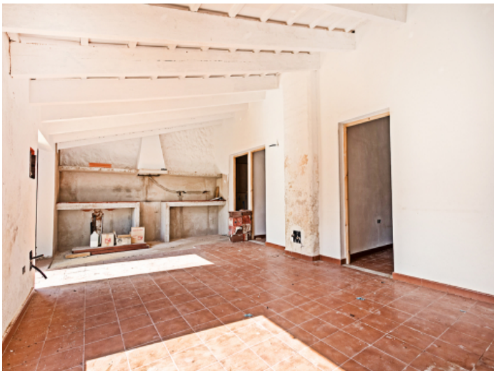
Großer Raum mit Küche