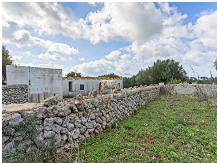
Ansicht des Grundstücks