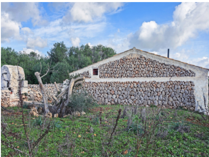
Ansicht der Fassade