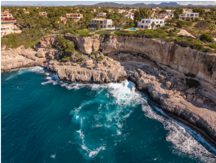
Küste von Cala Santanyi