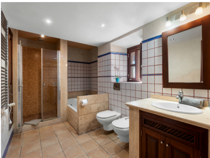
Badezimmer des Masterbedrooms