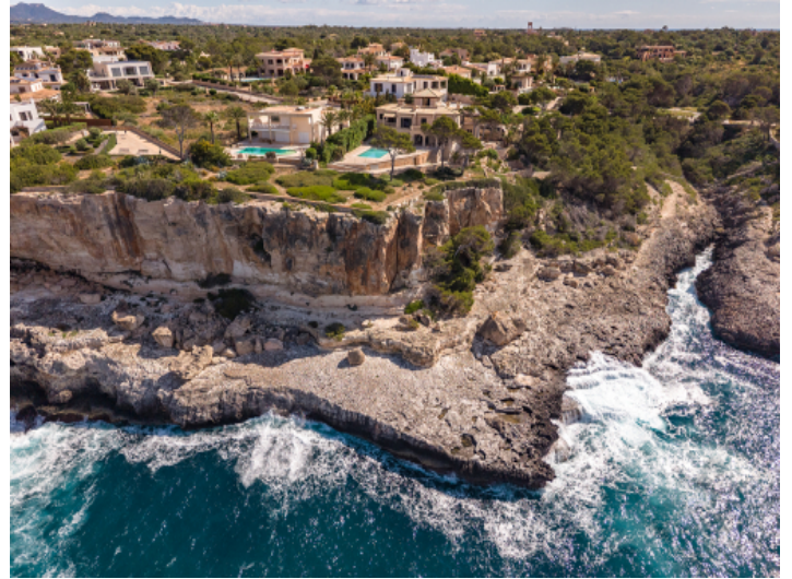
Küste von Cala Santanyi