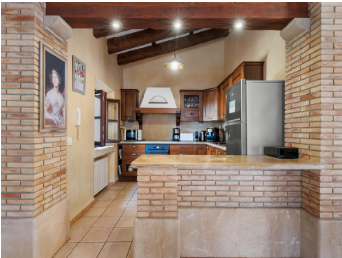
Küche angrenzend an den Wohnbereich