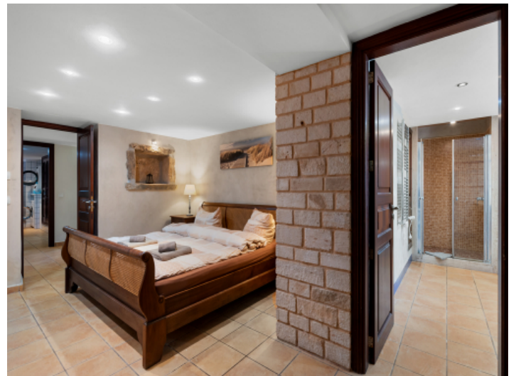
Masterbedroom mit Bad en Suite