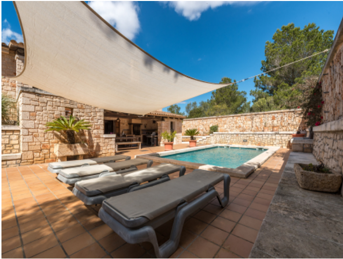
Sonnenterrasse am Pool