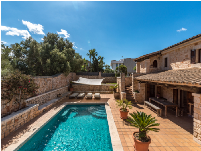
Terrasse und Pool befinden sich auf einer leicht tiefer