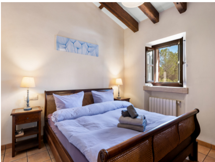
Erstes Gästeschlafzimmer im Obergeschoss