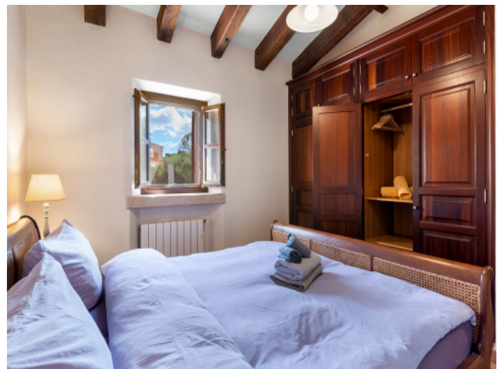
Erstes Gästeschlafzimmer im Obergeschoss