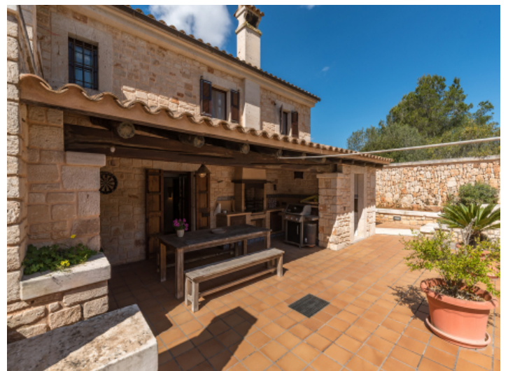
Überdachte Terrasse direkt am Haus mit Zugang zum Erdgeschoss

PORTA MALLORQUINA • C./ COLOM 20 2º, 07001 PALMA, SPANIEN