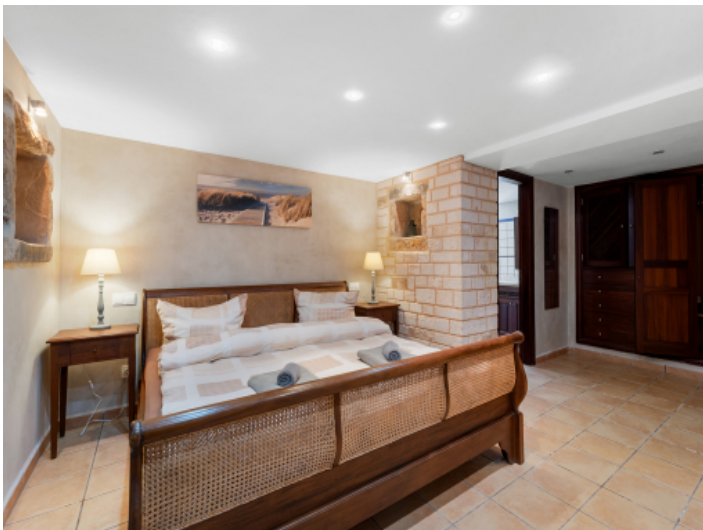
Masterbedroom im Erdgeschoss mit ebenerdigen Zugang zur