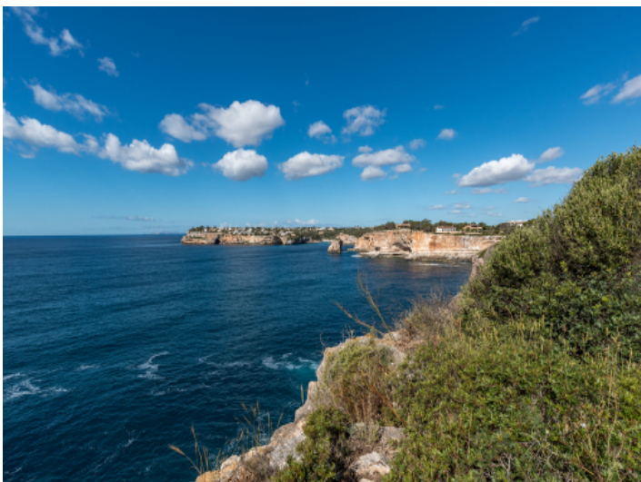
Blick Richtung Es Pontàs