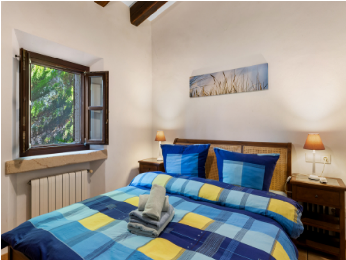
Zweites Gästeschlafzimmer im Obergeschoss