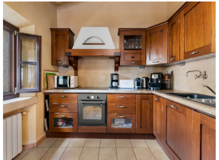
Voll ausgestattete Einbauküche