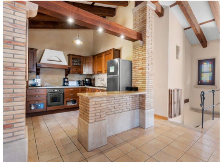
Küche angrenzend an den Wohnbereich