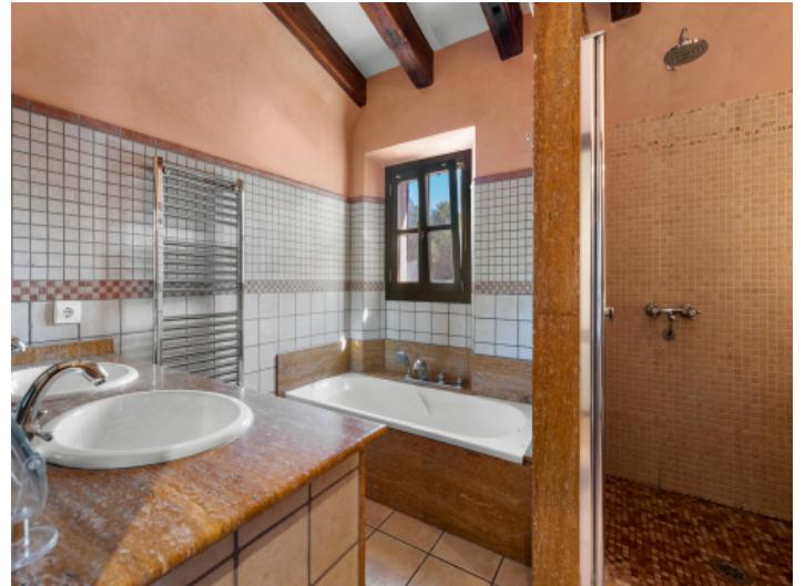
Badezimmer im Obergeschoss