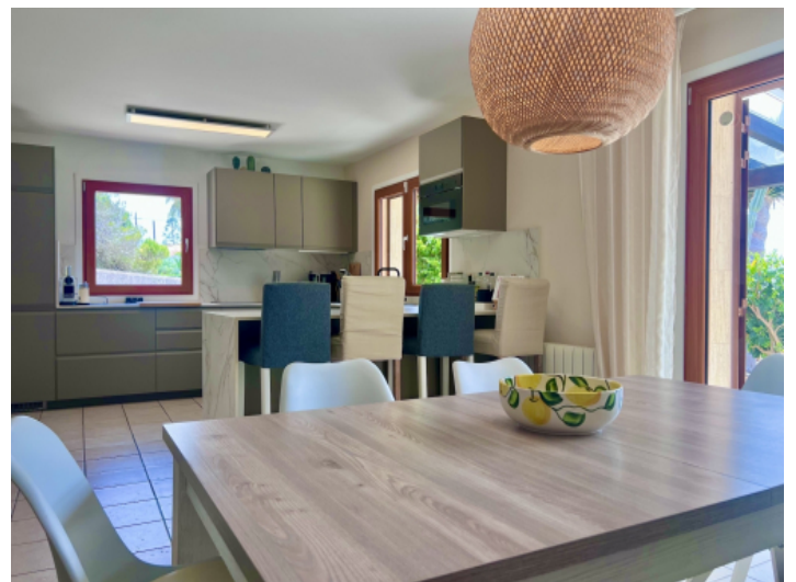
Küche / Essbereich