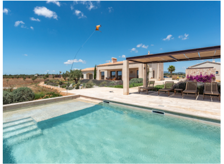
Pergola mit Anschlüsse für Aussenküche