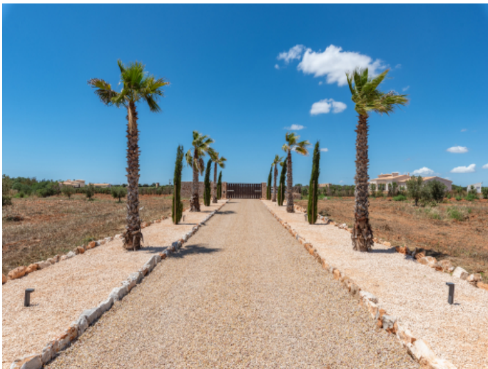
Repräsentative Zufahrt zum Anwesen