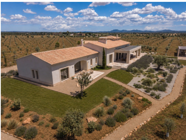
Anwesen mit mediterranem Garten aus der Vogelperspektive