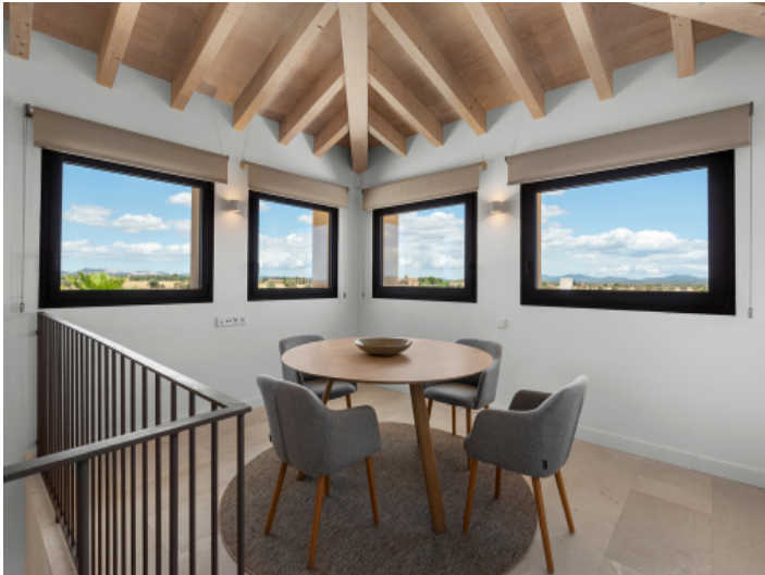
Turmzimmer mit unverbaubarem Weitblick