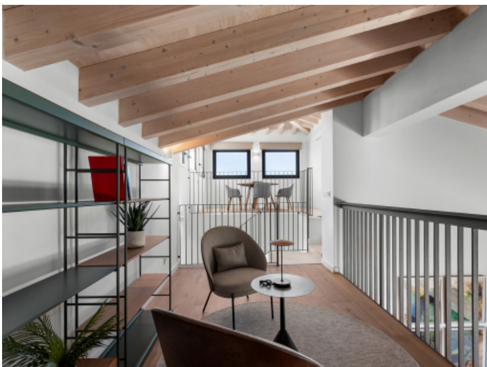
Galeriebene mit elegantem Geländer