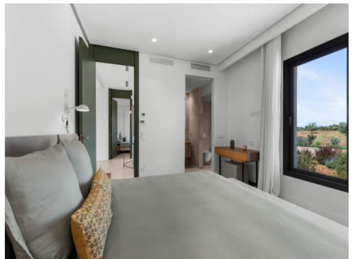
Elegantes Gästezimmer mit Bad en Suite und Einbauschränk