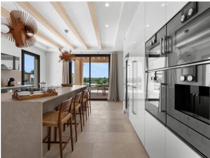
Hochwertige Designerküche mit Gaggenau-Geräten