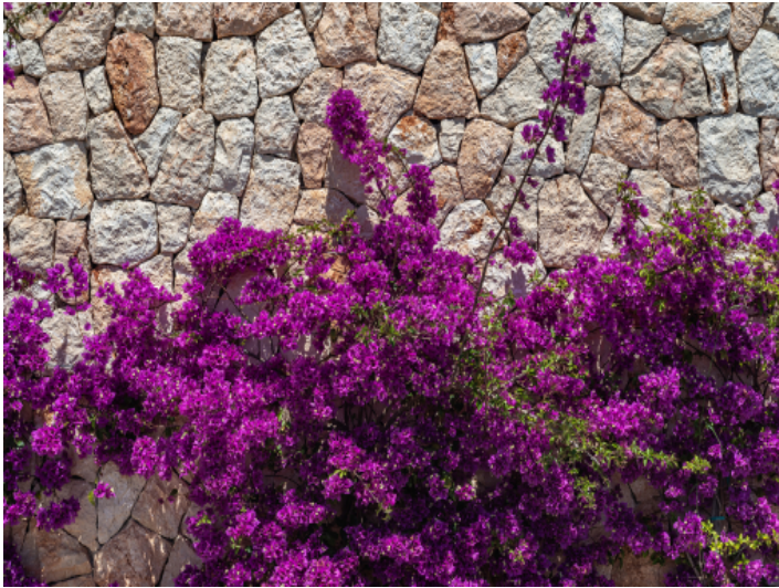
Natursteinelementen und mediterraner Bepflanzung