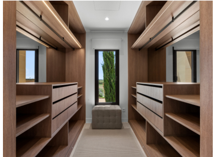
Ankleide mit großzügigem Raumkonzept