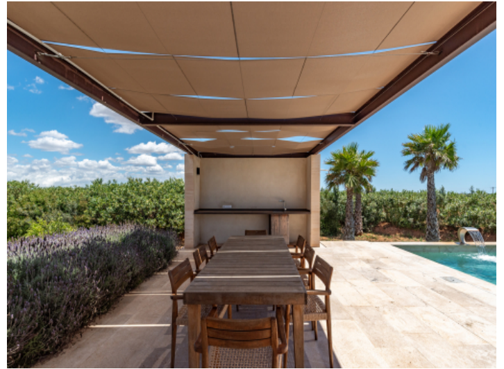
Poolterrasse mit Pergola und vorbereitetem Bereich für eine Außenküche