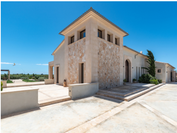
Außenansicht mit markantem Turmelement und