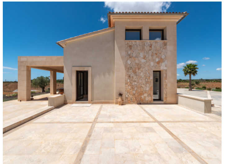
Seiteneingang zur Küche und zum Versorgungsraum