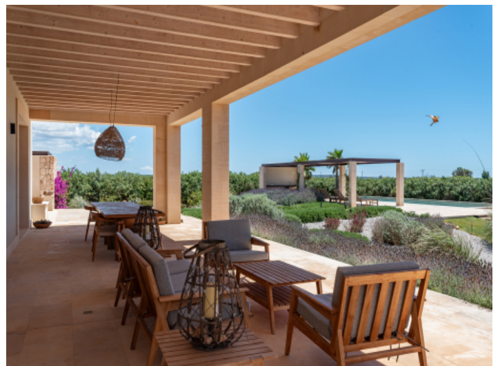
Terrasse mit Blick über den mediterranen Garten und Pool