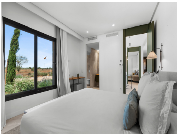
Stilvoller Gästebereich mit privatem Badezimmer