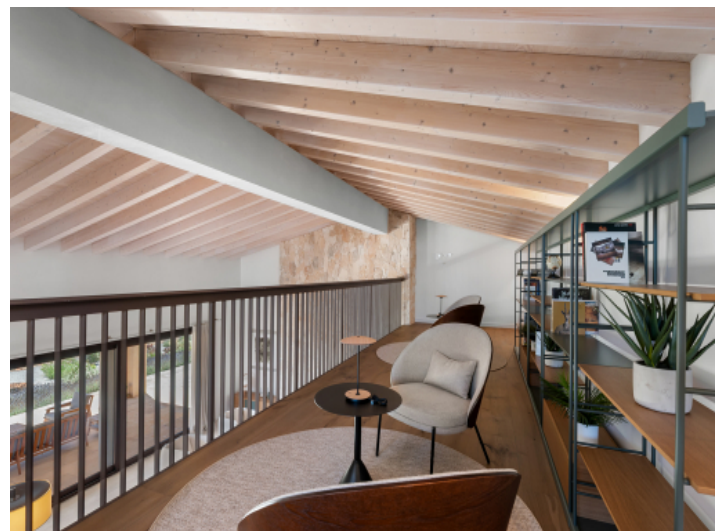
Charmante Galerie mit Bibliotheksflair