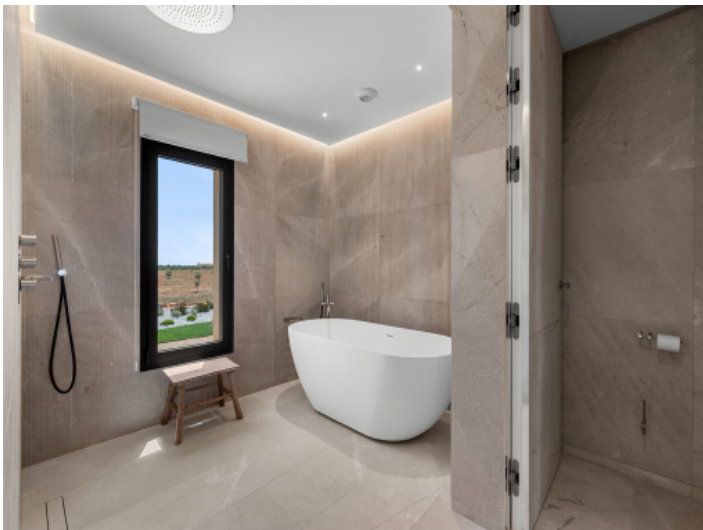
Luxuriöses Masterbad mit Naturstein und stilvoller