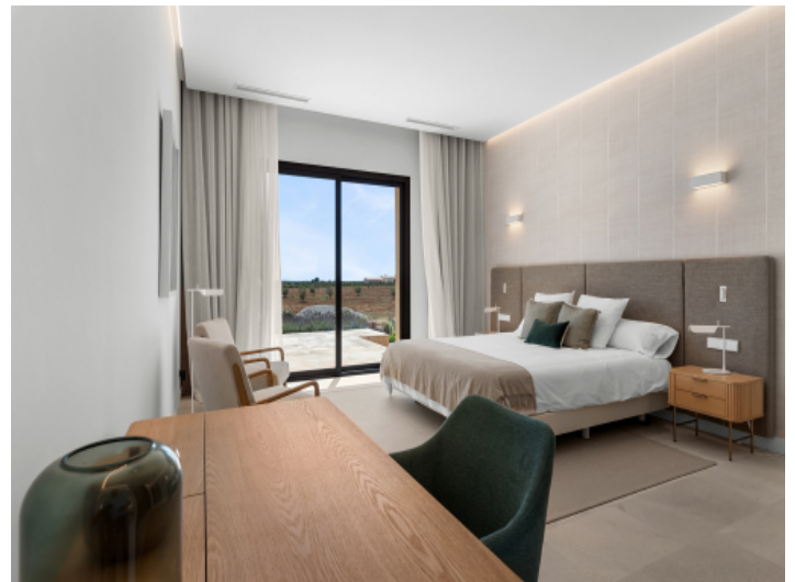
Elegante Master-Suite mit Zugang zur Terrasse