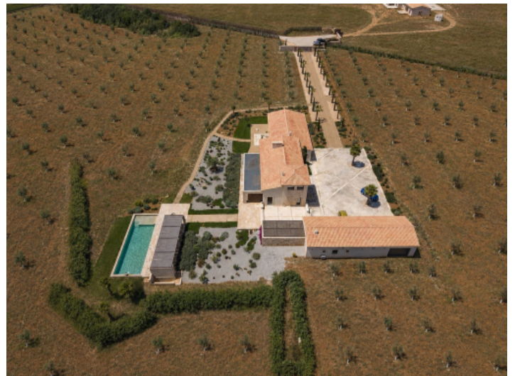
Panorama-Luftaufnahme der Finca mit Olivenhain und