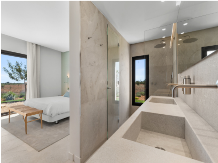
Elegantes Bad en suite mit Dusche