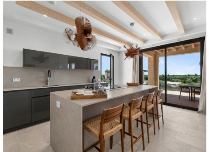
Exklusive Wohnküche mit zeitloser Eleganz