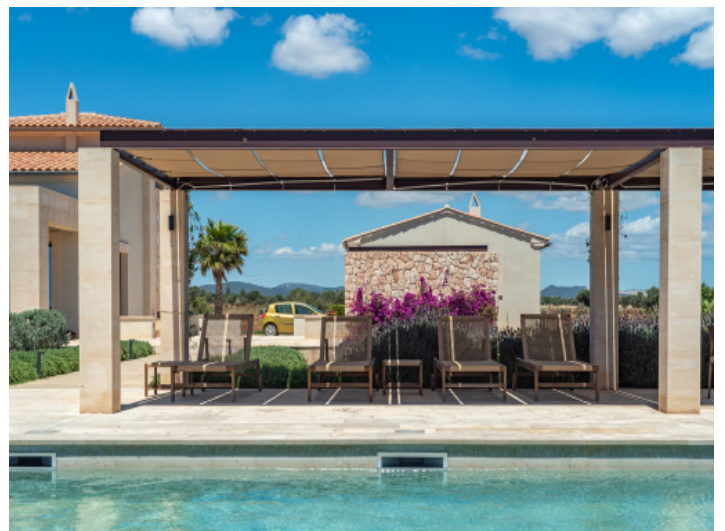
Mediterraner Poolbereich mit Pergola