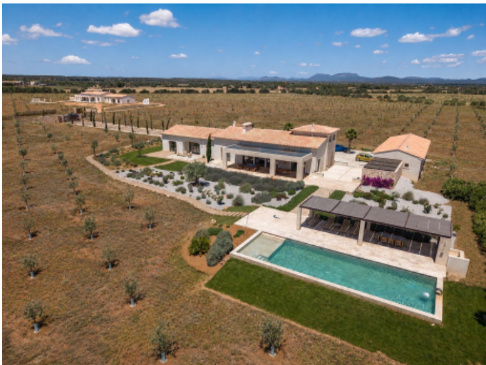
Luftaufnahme mit Blick auf Haupthaus, Pool und weitläufige