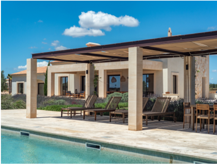
Exklusiver Salzwasserpool in stilvollem Ambiente