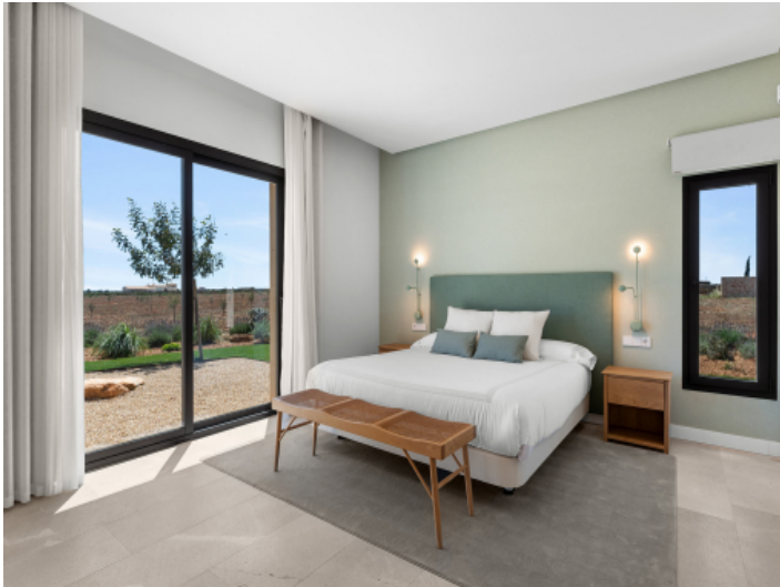
Modernes Gästezimmer mit fein abgestimmten