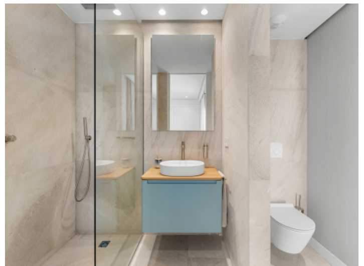
Bad en suite mit