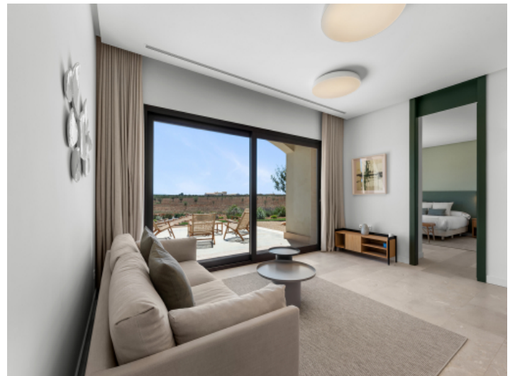
Gemütliche Lounge im Gästebereich mit Terrassenzugang