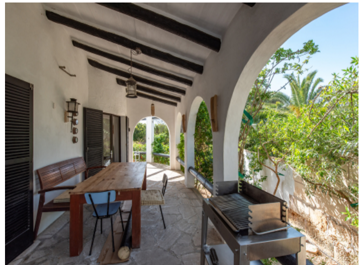
Überdachte Terrasse mit Zugang zum Wohnbereich