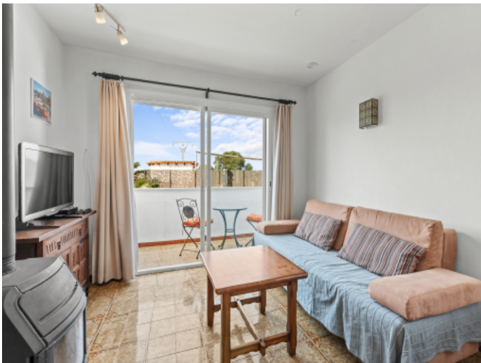
Wohnbereich mit eigenem Balkon