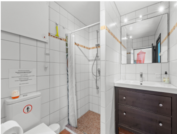
Badezimmer im Turm