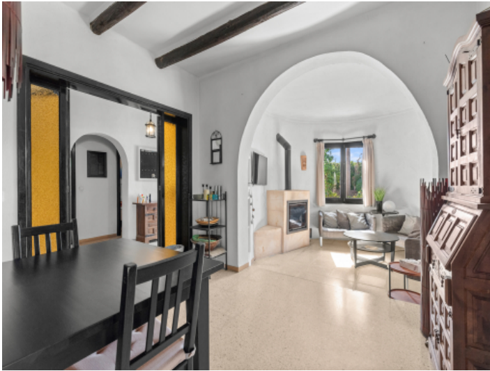
Ess- und Wohnbereich