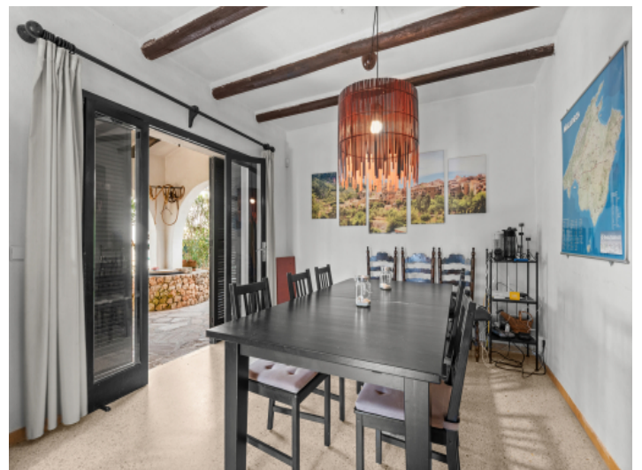
Essbereich mit Zugang zur Terrasse