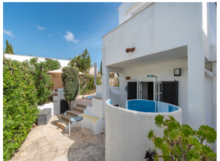
Outdoorschule dahinter eine separate Wohneinheit