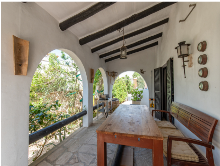
Überdachte Terrasse mit Eingang zum Wohnbereich