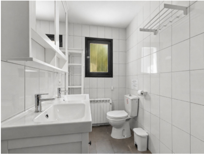
Badezimmer im Erdgeschoss