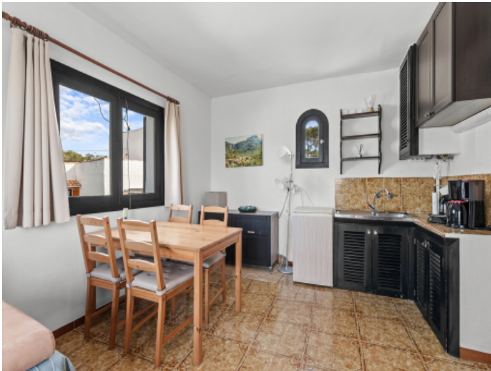
Wohnbereich im Obergeschoss