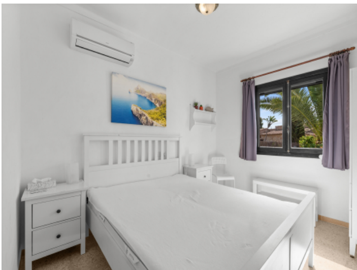
Erstes Schlafzimmer im Erdgeschoss