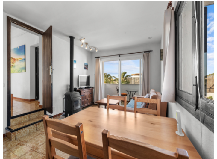
Wohnbereich im Obergeschoss