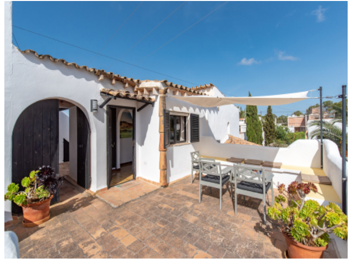
Terrasse im Obergeschoss mit Eingängen zu separaten