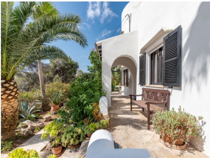
Garten und Eingangsbereich