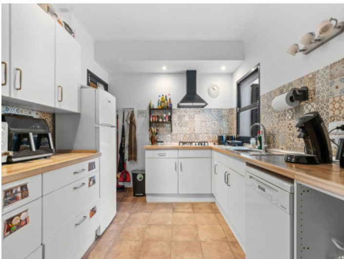
Küche in der Hauptwohnung