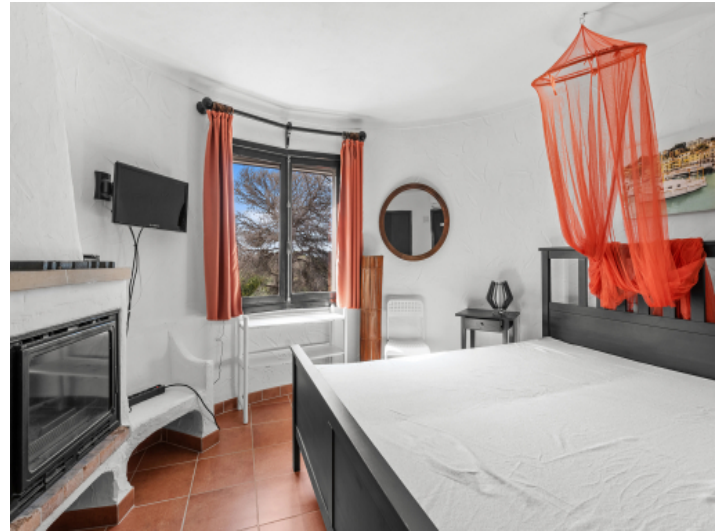
Schlafzimmer im Turm