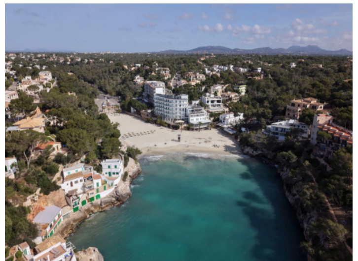
Strand Cala Santanyi wenige Meter entfernt