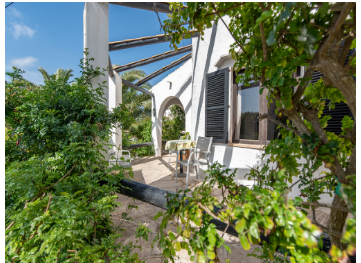
Terrassen führen rund ums Haus