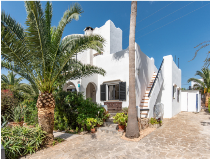
Eingang von der Straße aus