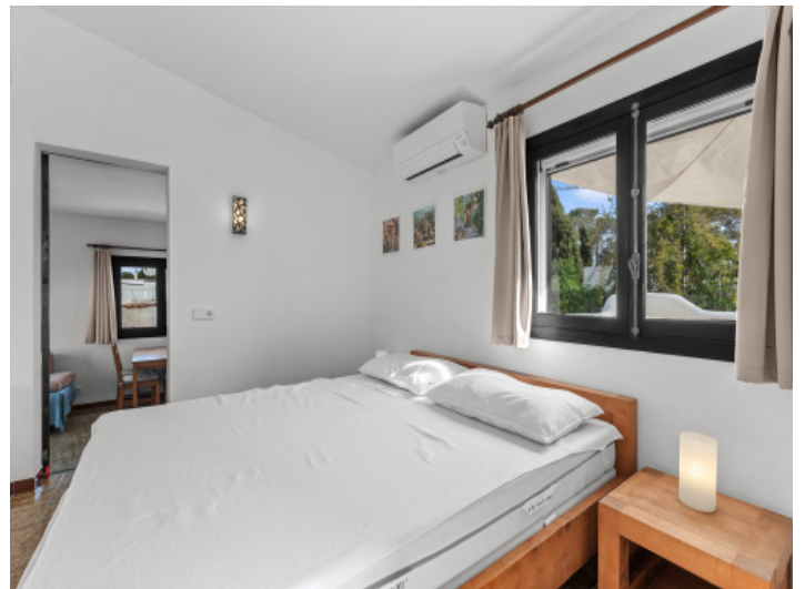
Schlafzimmer im Obergeschoss