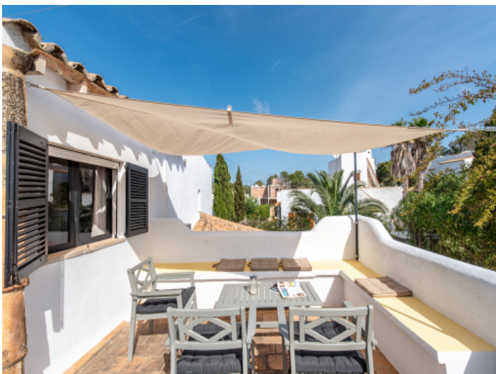
Terrasse im Obergeschoss