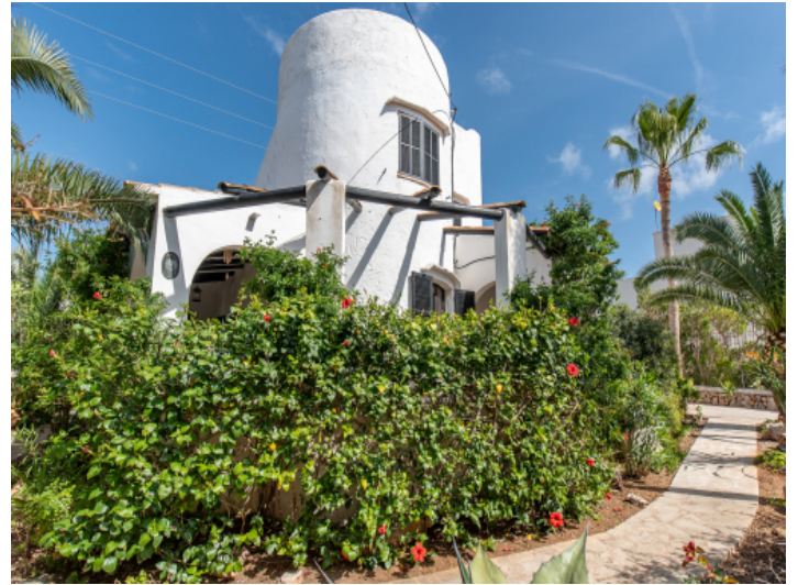
Garten und Terrassen führen rund ums Haus