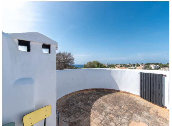
Dachterasse mit Meerblick