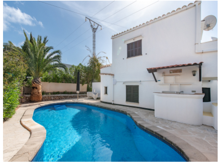
Poolbereich mit Outdoorbar