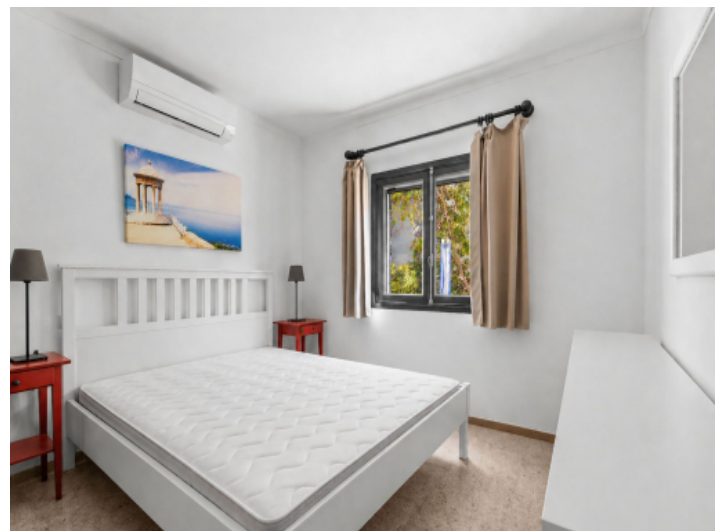
Zweites Schlafzimmer im Erdgeschoss