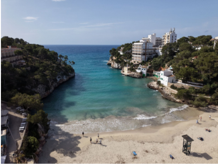
Strand Cala Santanyi wenige Meter entfernt