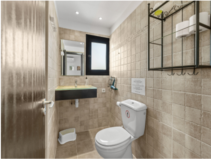
Badezimmer im Obergeschoss