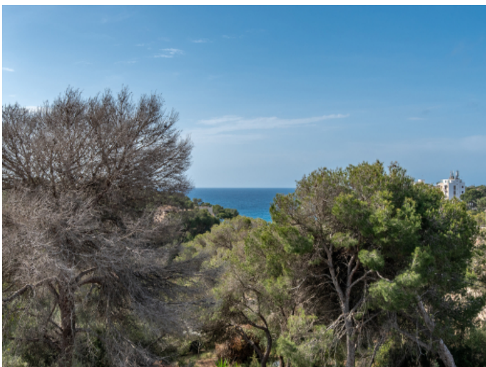
Dachterasse mit Meerblick