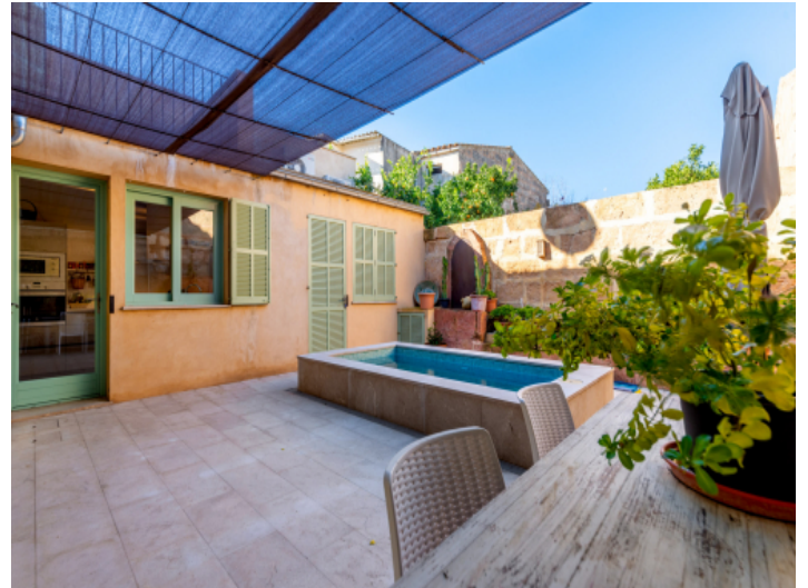
Liebevoller Patio mit Grillbereich