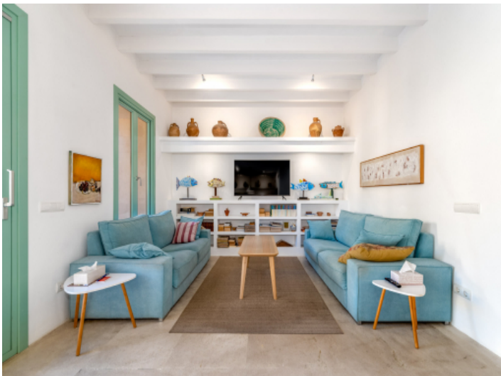
Geschmackvoll renovierter Wohnbereich