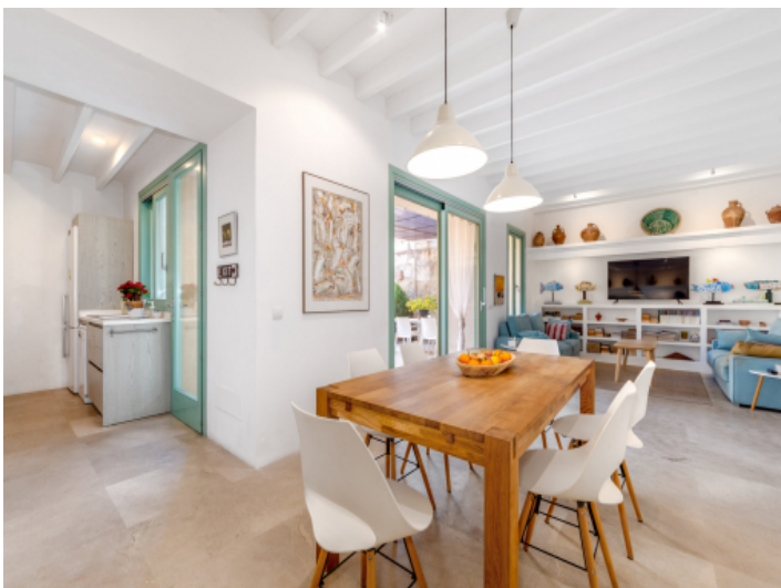
Lightflooded, open room