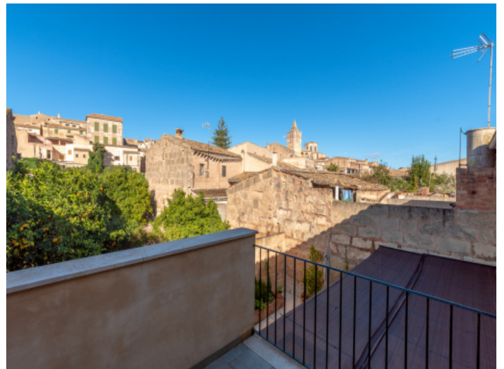
Ausblick von der oberen Terrasse