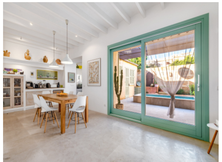
Direkter Zugang zum Patio