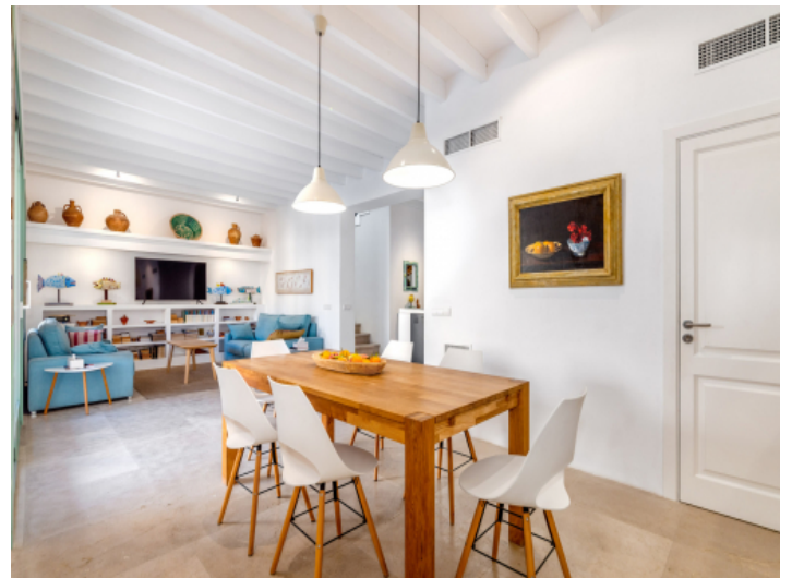
Angrenzender, offener Essbereich