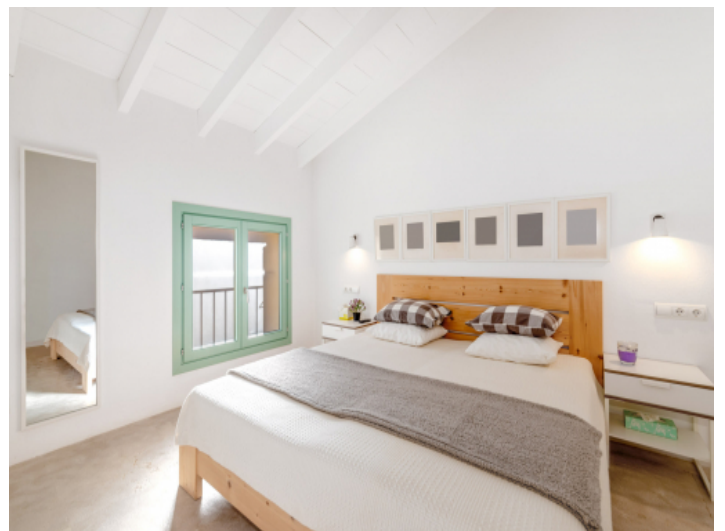
Drittes, gemütliches Schlafzimmer