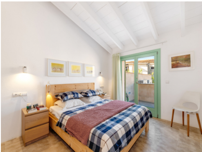
Schönes Doppelzimmer mit Terrasse