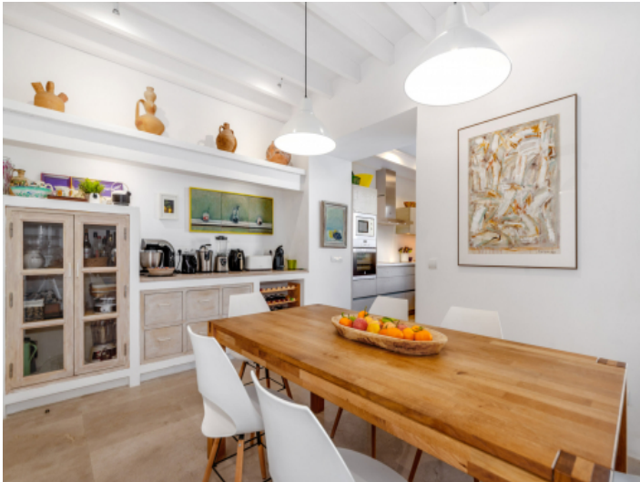
Blick in die halboffene Küche