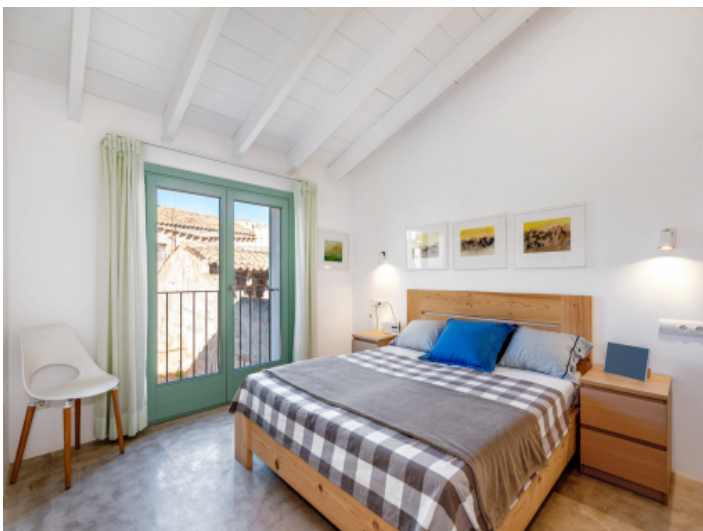
Das zweite Doppelschlafzimmer