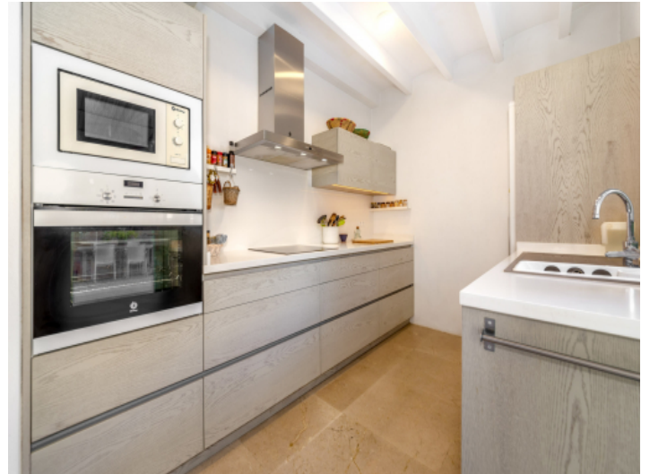
Elegant, modern kitchen