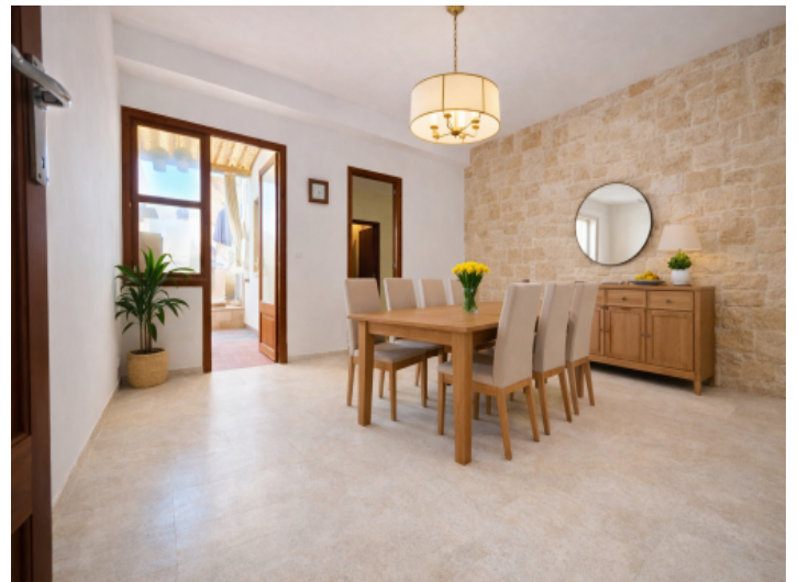
Esszimmer mit KI