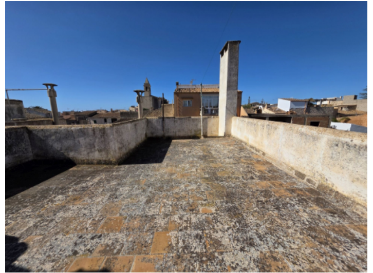
Dachterasse mit Blick zur Kirche