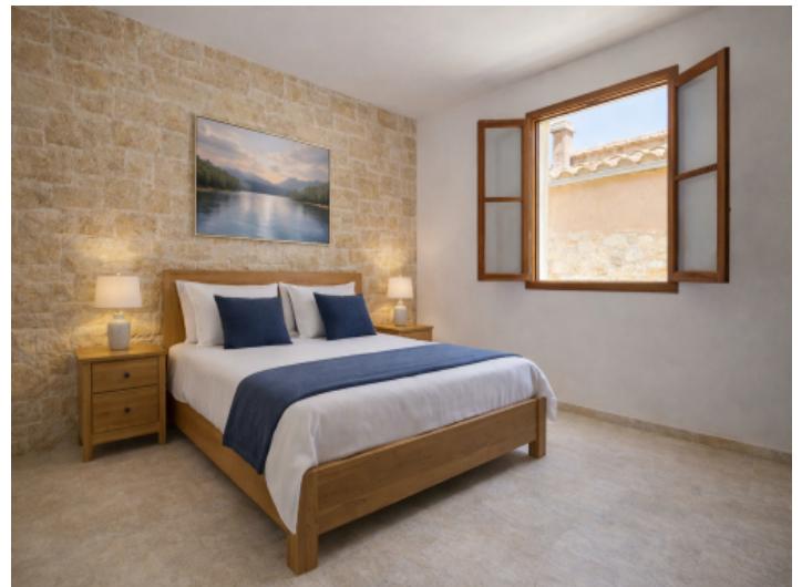
Schlafzimmer mit KI