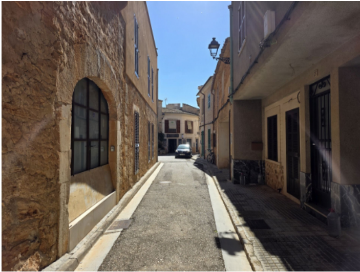
Authentisch mallorquinische Gasse