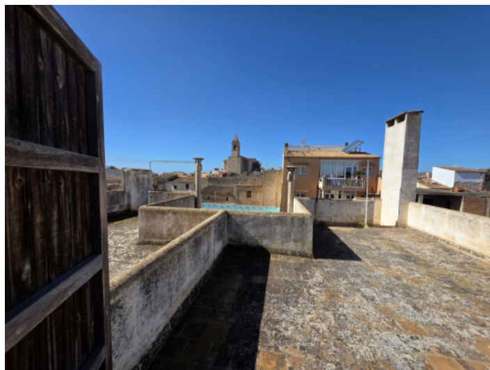
Eine von zwei Terrassen