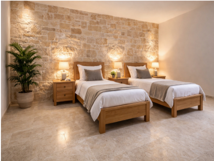
Schlafzimmer mit KI