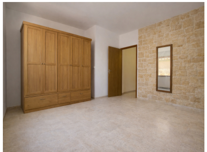
Schlafzimmer mit KI