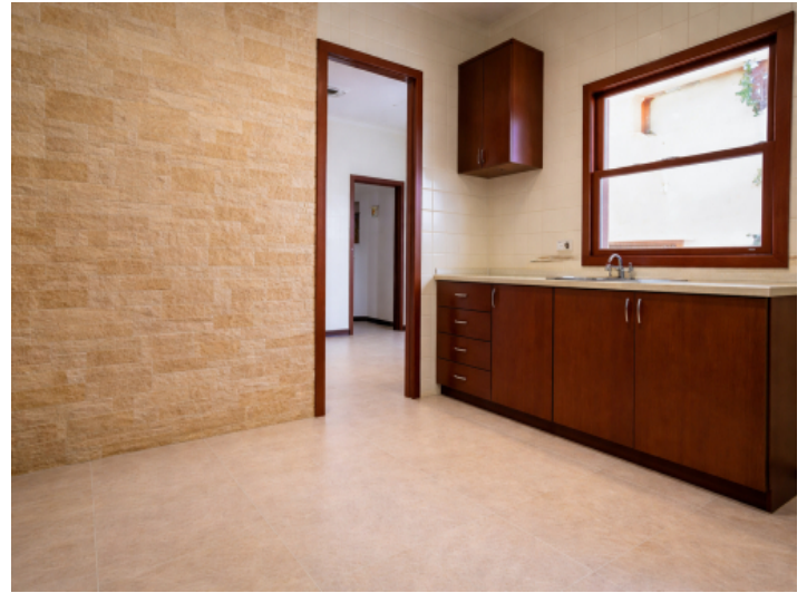
Küche mit KI