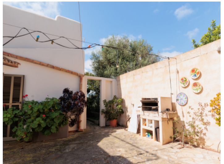
Terrasse mit Grillbereich