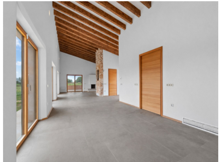
Küche mit Vorinstallation für eine Kochinsel