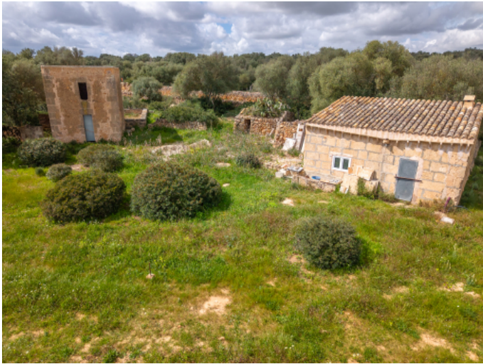
Altbestand einer authentischen Wassermühle