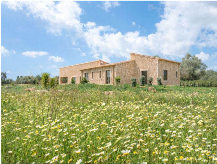
Haus mit viel Privatsphäre