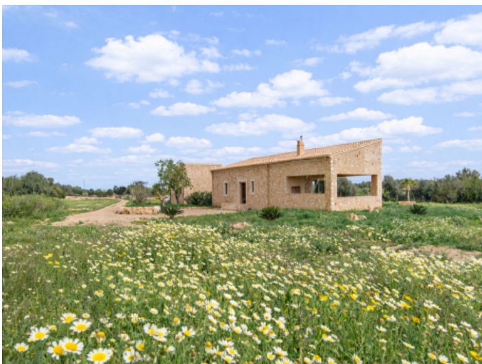
Typisch mallorquinische Finca