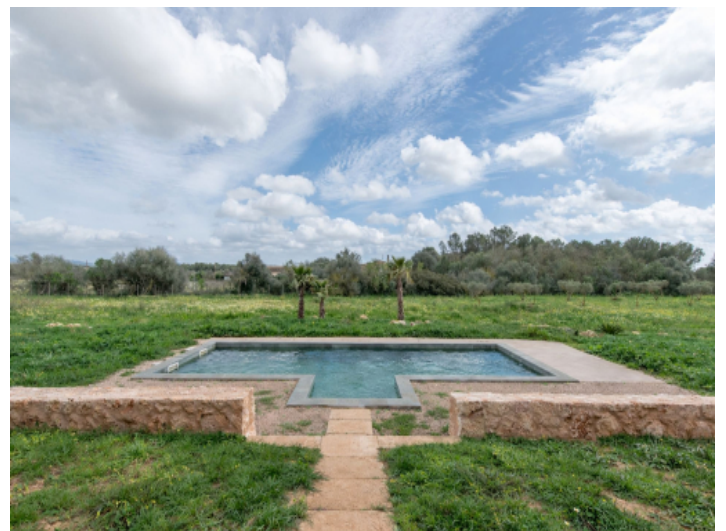
Pool mit Weitblick