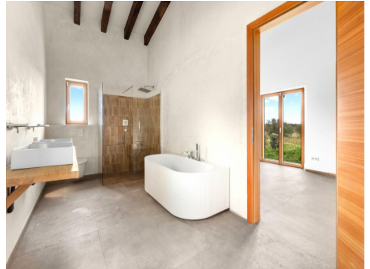
Badezimmer en suite mit Badewanne und Dusche