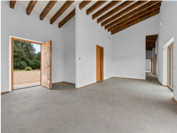
Küche und Eingangsbereich