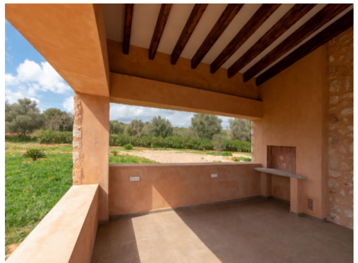
Terrasse mit Barbecuebereich