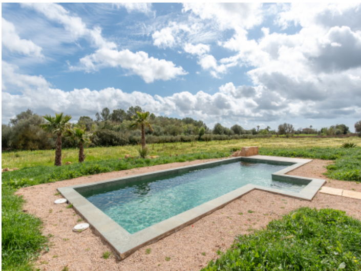
Pool und Garten