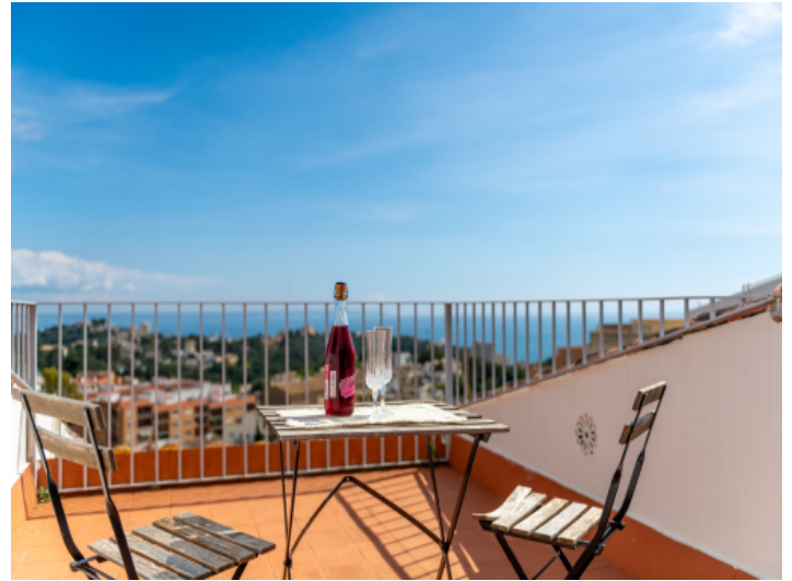
Terrasse mit herrlichem Ausblick