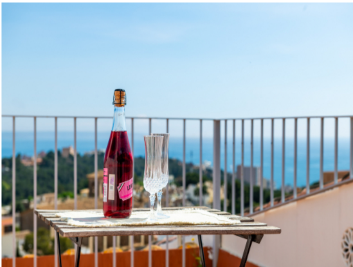
Dachterrasse mit Meerblick