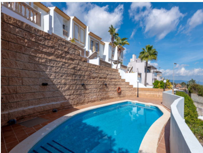
Pool in sonniger Lage