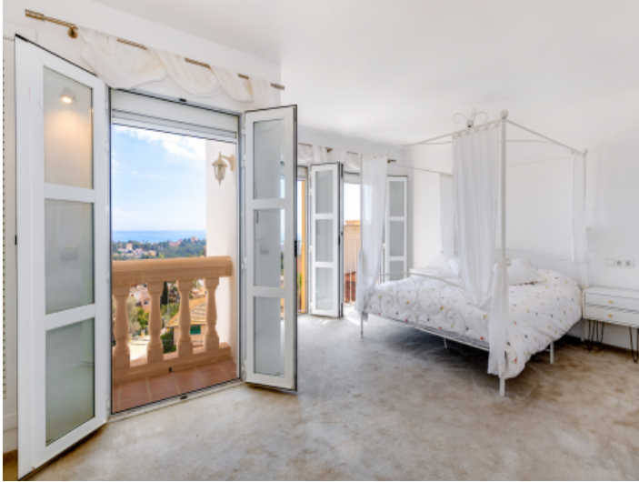
Schlafzimmer mit Meerblick