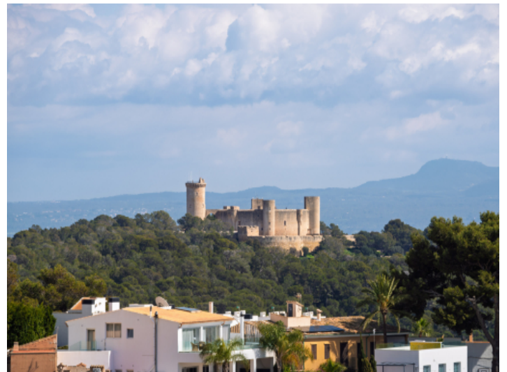
Blick auf das Castello Bellver