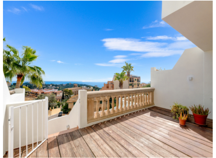
Terrasse in der ersten Etage