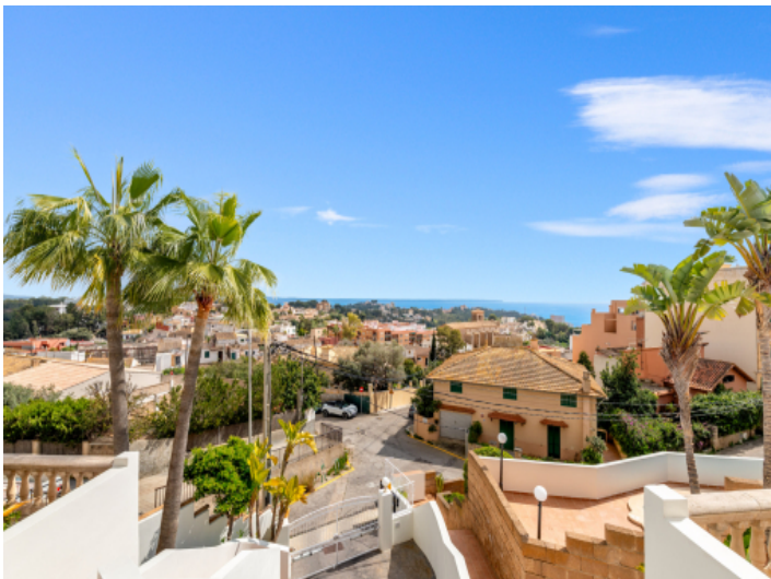
Blick auf das Dorf