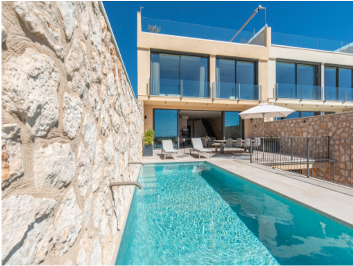
Reihenendhaus Ses Salines