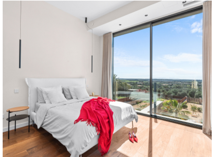
Schlafzimmer mit Blick