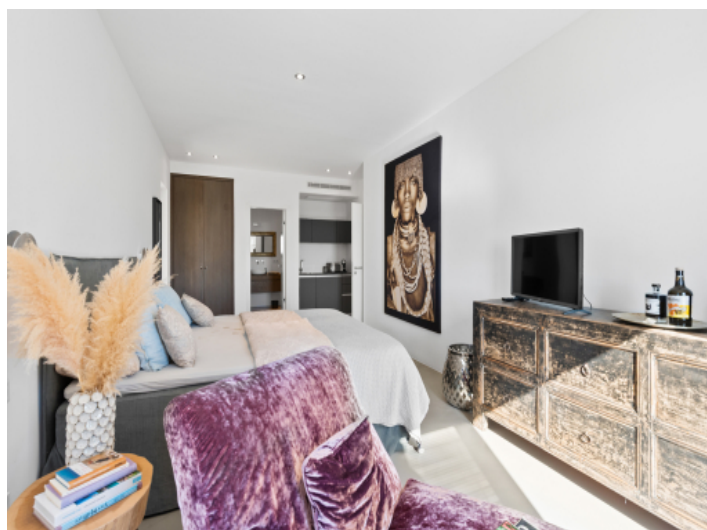
Separates Apatmnet mit Badezimmer und Küchenzeile