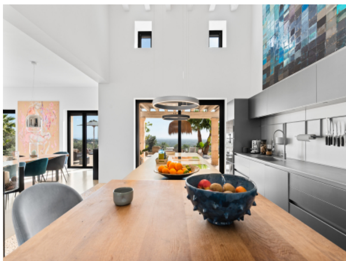
Küche von Bulhaupt