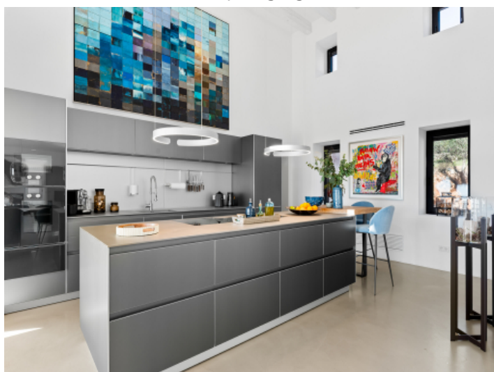
Exklusive Küche von Bulhaupt