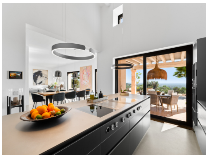
Kochinsel von Bulhaupt