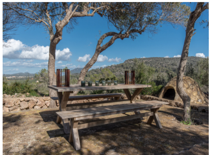
Aussichtspunkt mit Holzbank