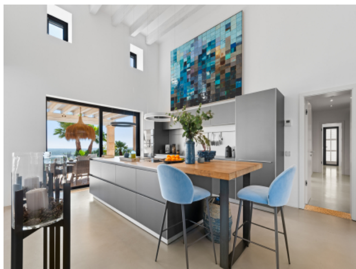
Küche von Bulhaupt