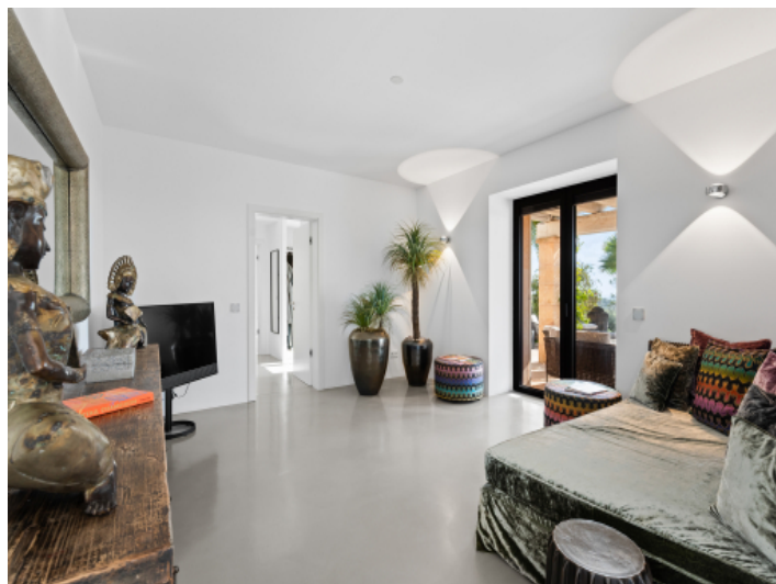
Extra Fernsehraum Hauptschlafzimmer