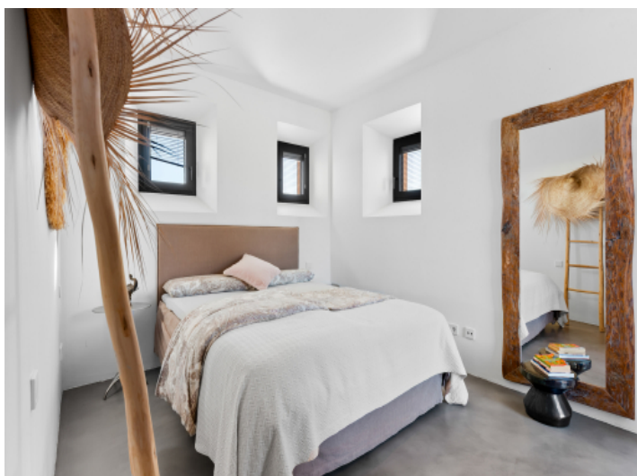
Eins von fünf Schlafzimmern