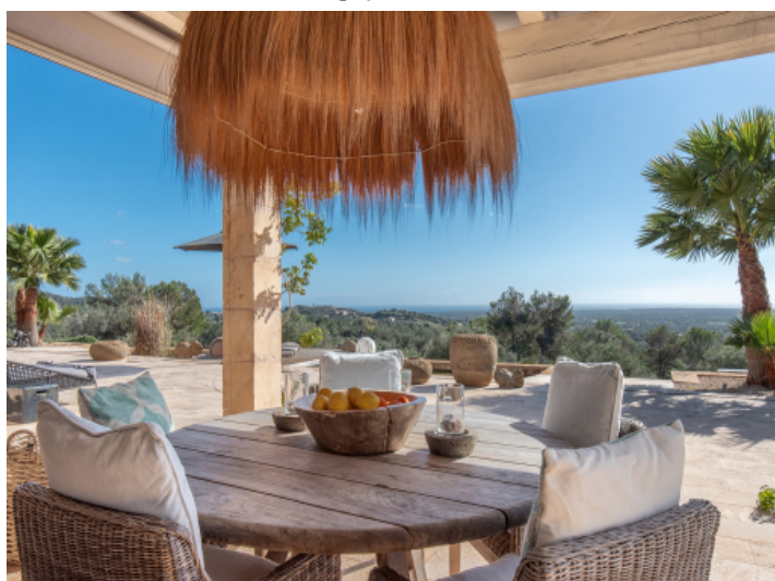
Terrasse mit Südausrichtung