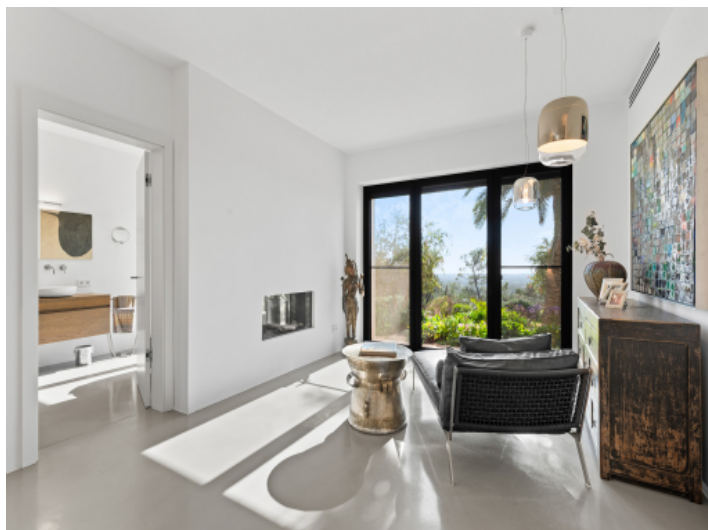
Lounge im Hauptschlafzimmer