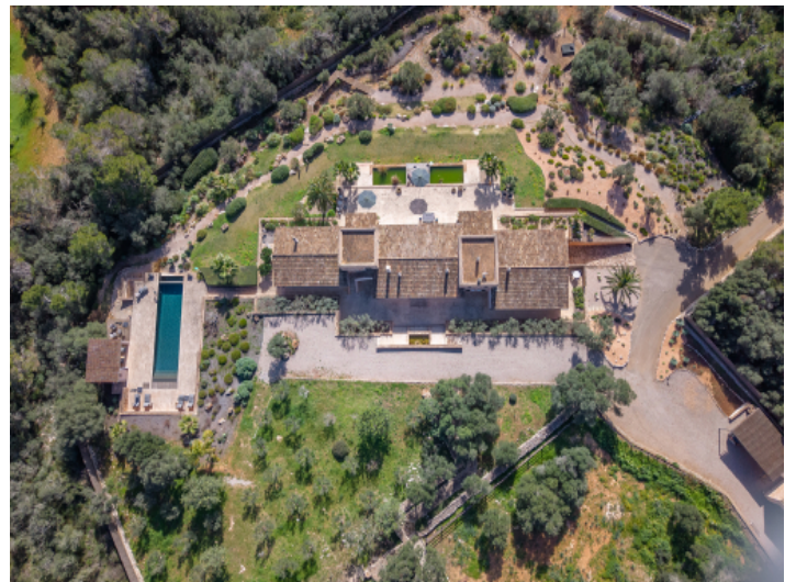
Majestätische Finca bei Santanyi