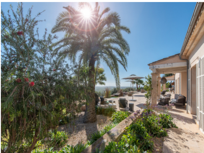
Aussenbereich mit Blick über die Terrasse