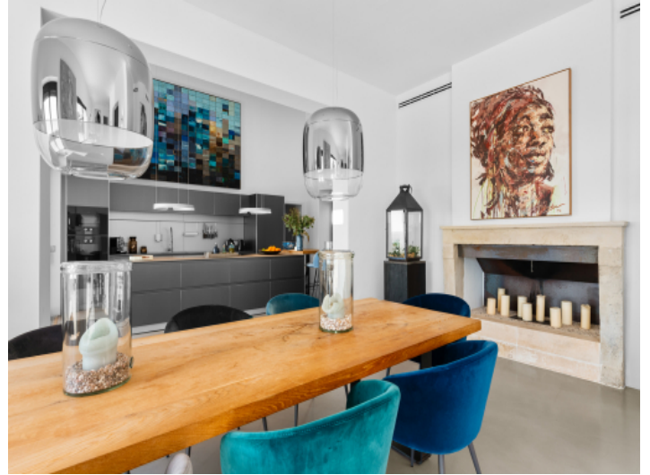
Essbereich mit Kamin