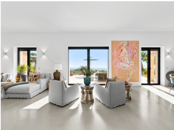
Großer Wohnbereich mit Panoramablick