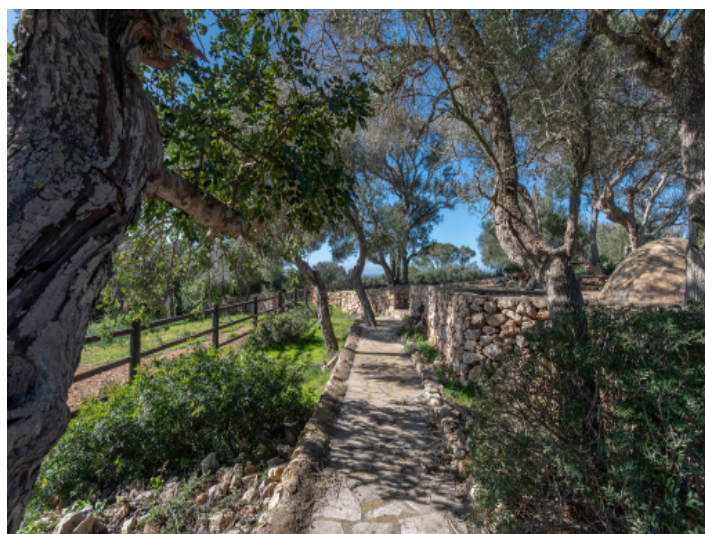
Gartenanlage mit schönem Baumwuchs