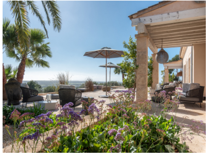
Spektakuläre Terrasse mit Blick nach Cabrera