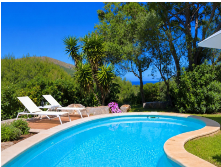
Pool des Gästehauses mit Fernmeerblick