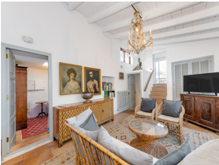
Wohnbereich im Indischen Flügel mit warmem Raumgefühl