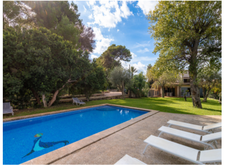
Großer Pool mit viel Platz zum Schwimmen und