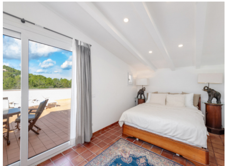
Romantisches Schlafzimmer im oberen Bereich mit heller