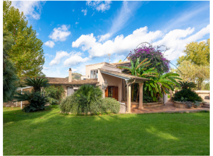
Haupthaus: Willkommen in Ihrer privaten Finca Oase im