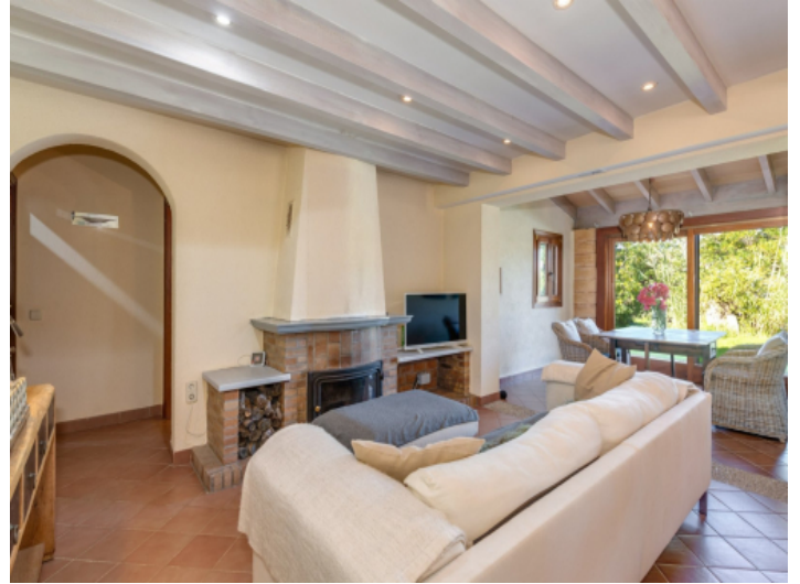
Gemütliches Wohnzimmer mit Kamin