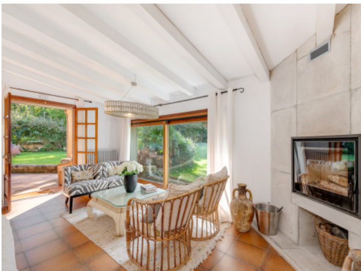
Wohnzimmer im Südflügel mit viel Licht und Blick ins Grüne