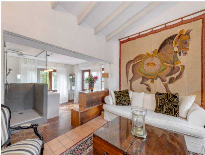
Master Suite mit Wohnbereich und Blick auf die Terrassen