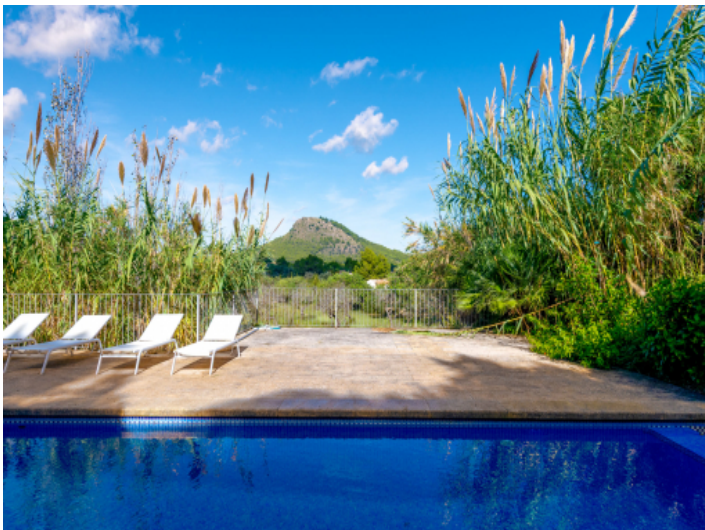
Sonnenmomente am Pool mit weitem Blick in die Natur