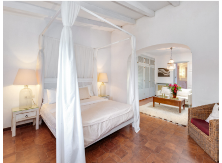
Schlafzimmer mit Ankleide und Badezimmer en Suite