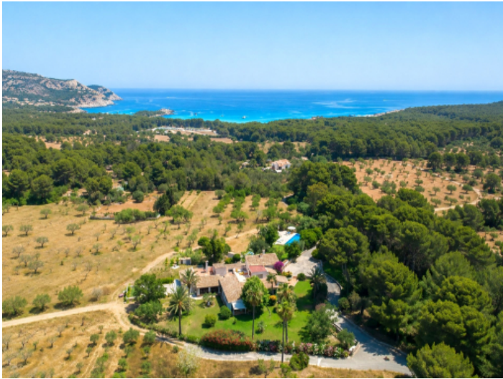
Fincaanwesen in privilegierter Lage nur 10 Minuten zur Cala