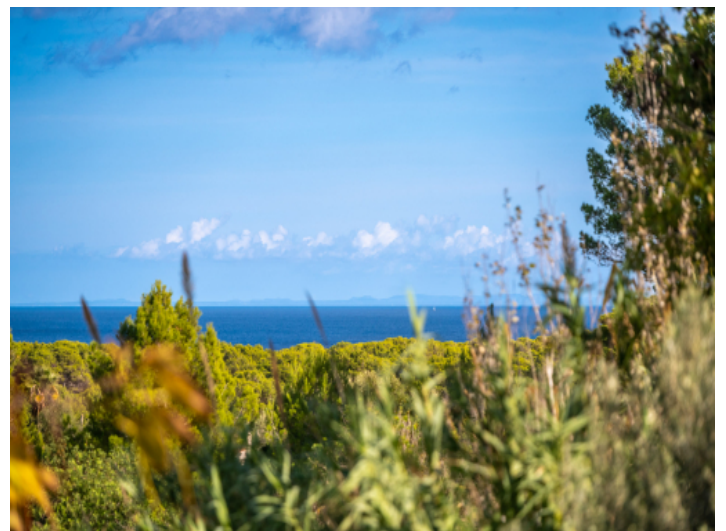
Terrasse mit direktem Meerblick