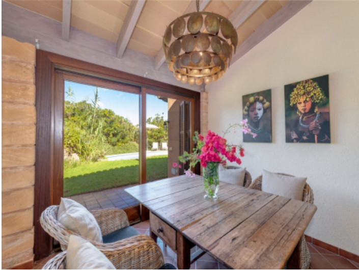
Essbereich mit Gartenzugang