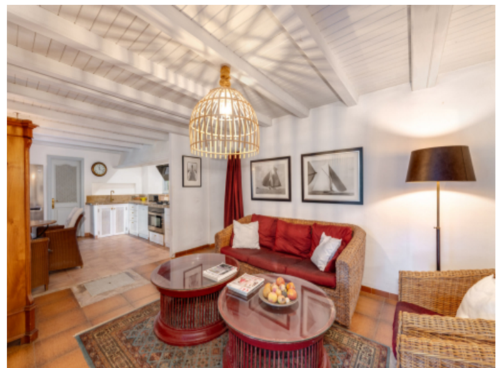
Gemütlicher Wohnbereich mit warmem Ambiente, Verbindung zwischen Küche und Esszimmer