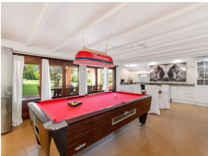
Offene Küche im unteren Bereich mit Billardtisch