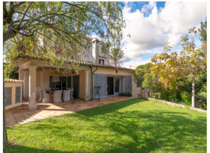
Großer Garten mit natürlichem Schatten und Ruhe