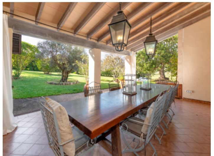
Überdachte Veranda mit Blick in den Garten