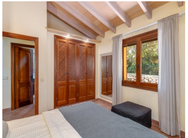
Schlafzimmer mit Einbauschränk