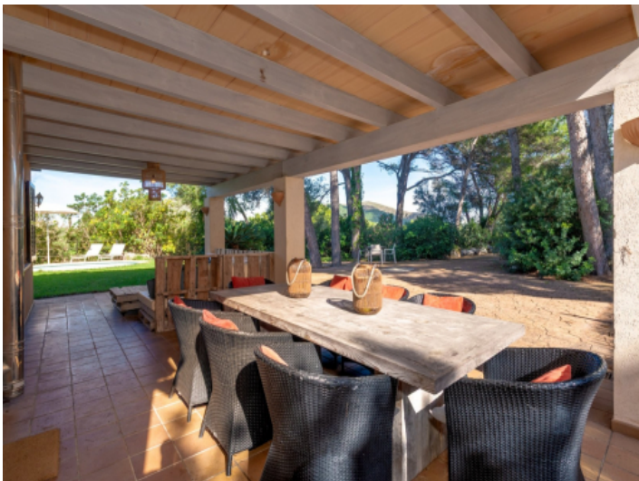
Essbereich auf überdachter Terrasse