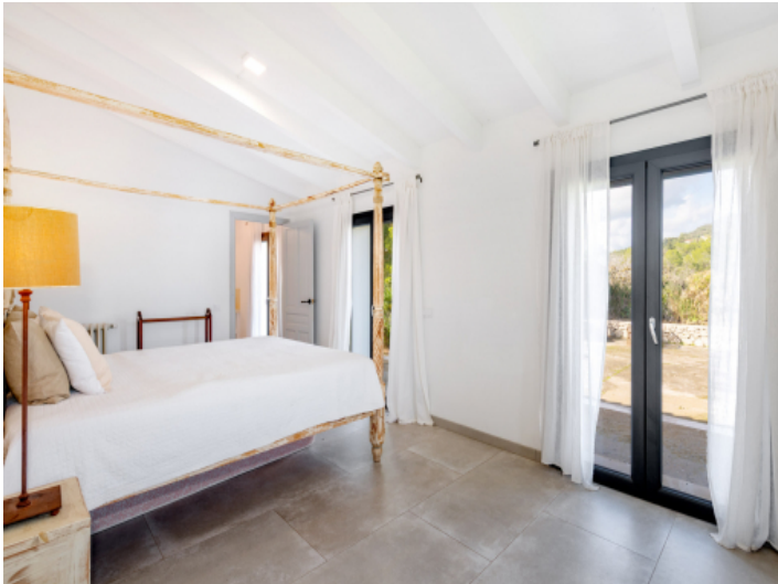
Schlafsuite im unteren Bereich mit direktem Zugang zum