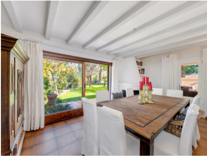
Heller Essbereich mit Verbindung zum Garten