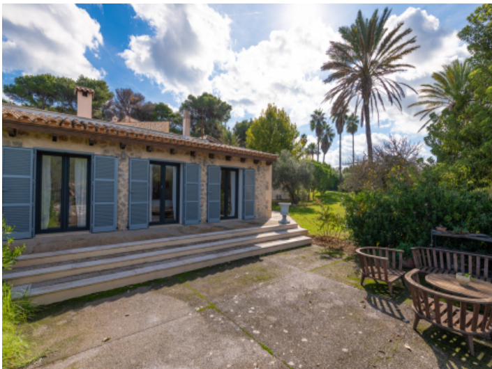
Indischer Flügel von außen auf der Gartenseite