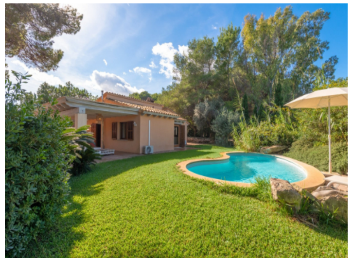
Zweiter Bungalow mit Poolbereich und ETV für 4 Personen