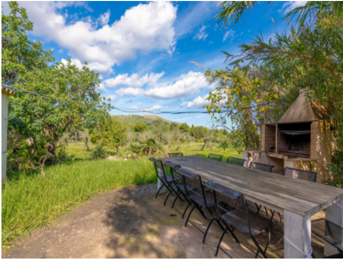
Barbecuearea im Garten