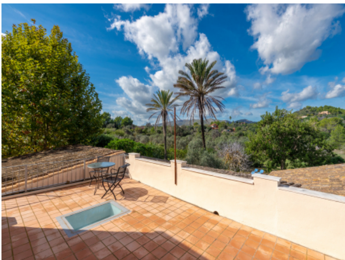
Master Suite mit Ausblick auf Natur und Meer