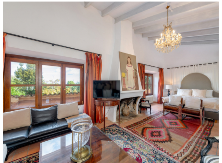
Master Suite mit warmem Ambiente und Meerblick