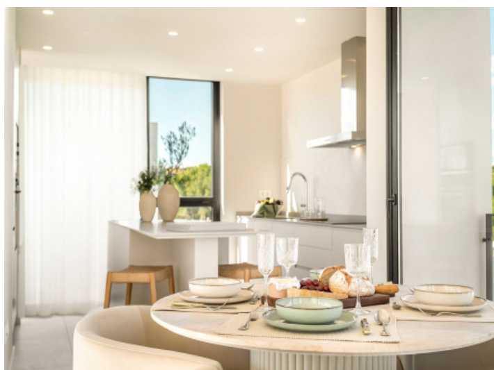
Offene moderne Küche