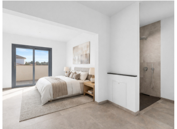
Masterbedroom - animiert