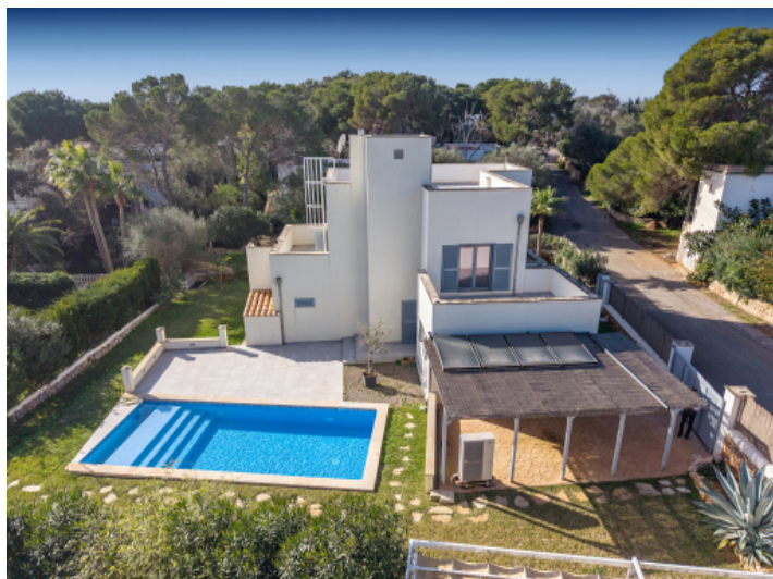
Pool und Carport