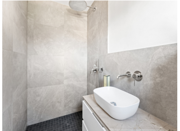
Erstes Schlafzimmer Bad