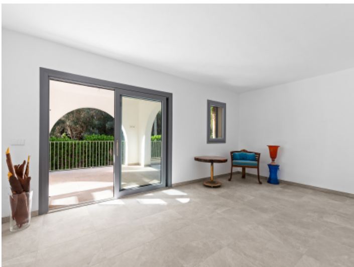
Wohnzimmer - original