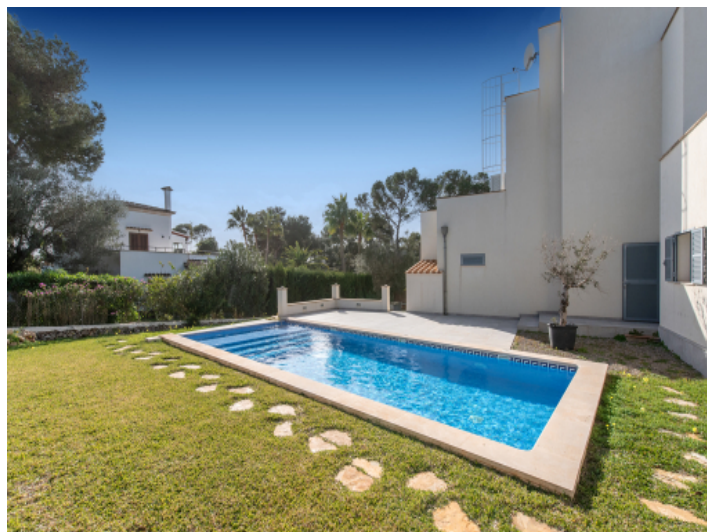
Pool von Garten aus gesehen