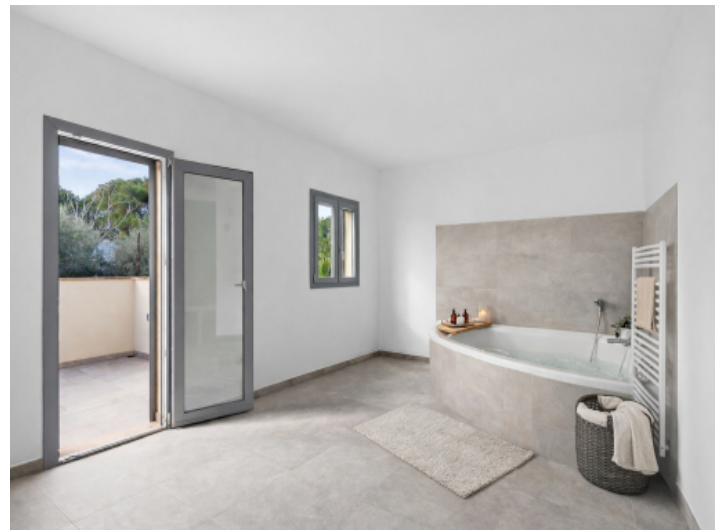
Masterbedroom Bad - animiert