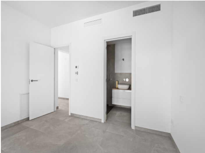
Erstes Schlafzimmer mit Bad