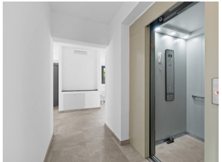
Flur mit Aufzug