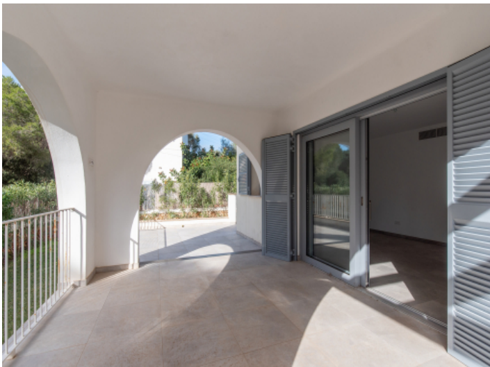
Terrasse mit Zugang zum Wohnzimmer