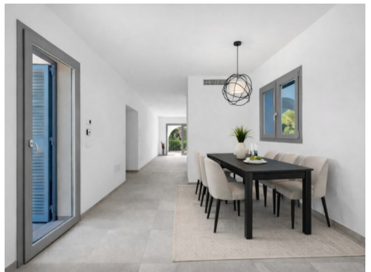
Essbereich mit Ausgang zum Pool - animiert