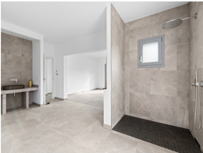
Masterbedroom mit integriertem Bad