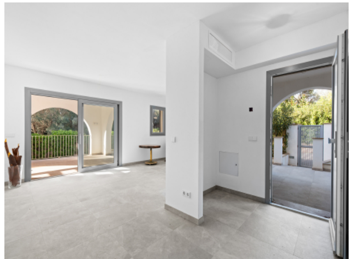
Eingang und Wohnzimmer