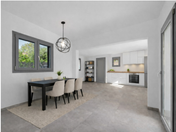
Essbereich und Küche - animiert