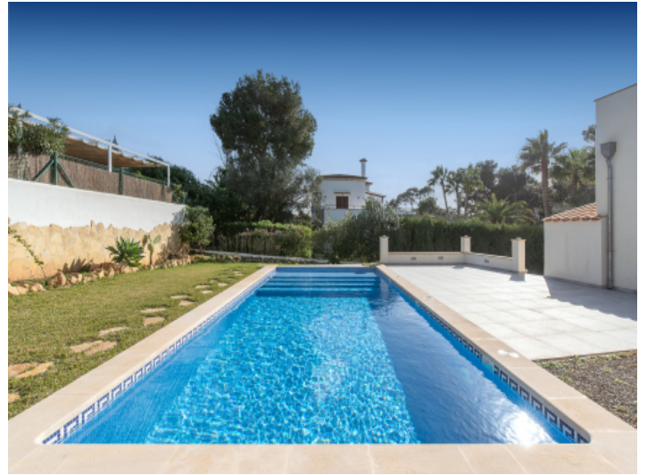
Pool vom Carport aus gesehen