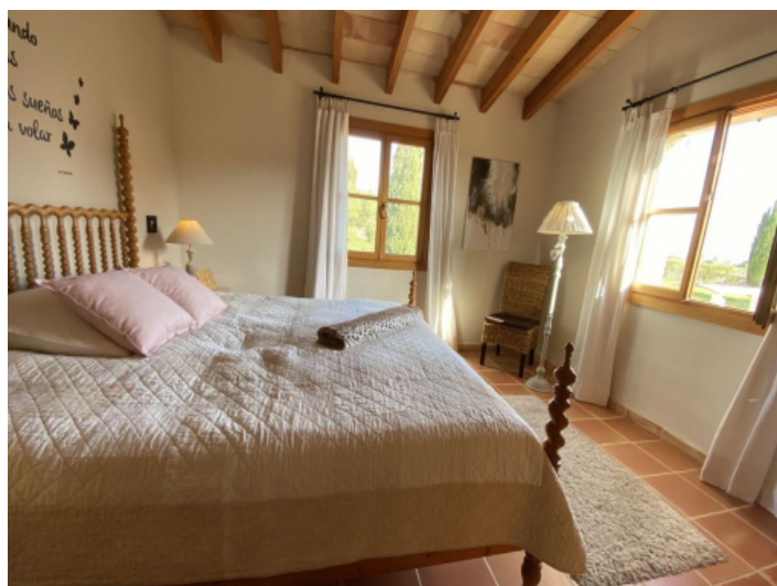
Eines von 11 Schlafzimmer