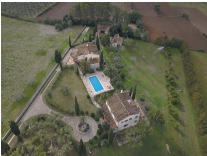
Blick auf das Grundstück