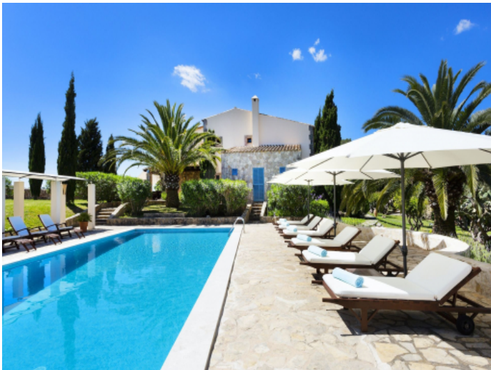
Einladender Poolbereich mit Sonnenliegen