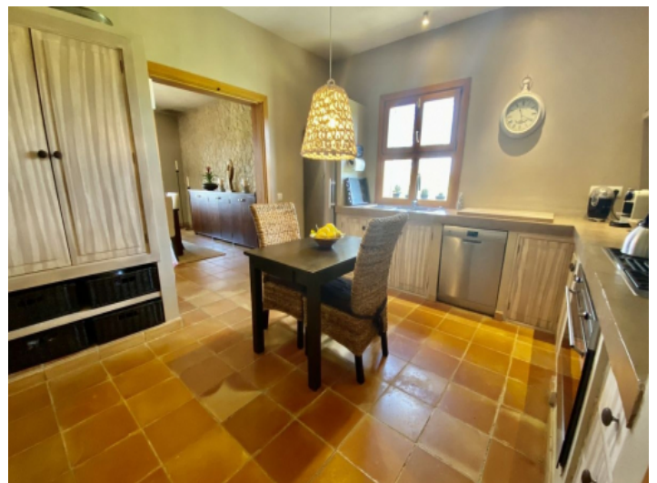
Küche und Essbereich