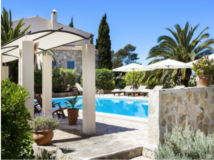
Alternative Ansicht des Poolbereichs