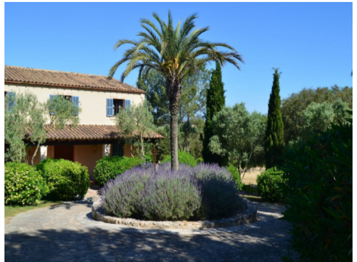
Außenansicht der Finca