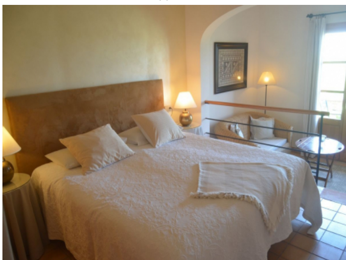
Eines von 11 Schlafzimmer