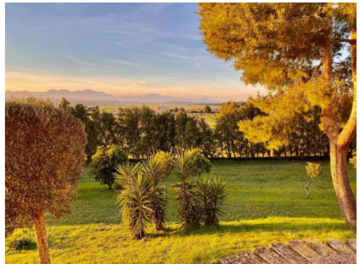
Garten mit Ausblick