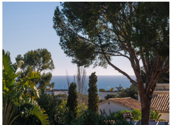
Traumblick von der Sonnenterrasse