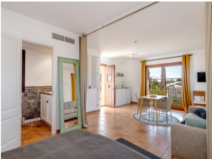
Gästeparment mit separatem Zugang