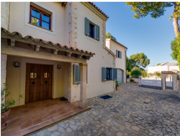
Mediterran angelegte Einfahrt