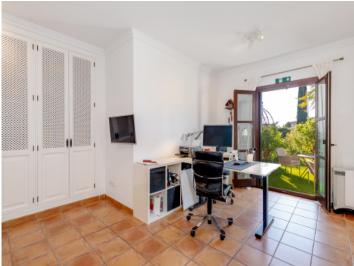
Büro/Schlafzimmer mit direktem Gartenzugang