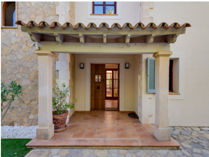
Mediterraner Wohnraum – Familienvilla mit großzügigem