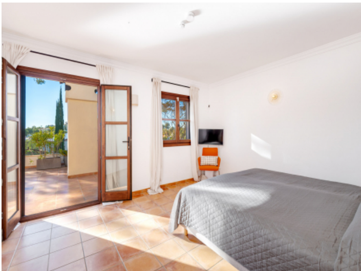
Masterschlafzimmer mit Zugang auf die Sonnenterrasse