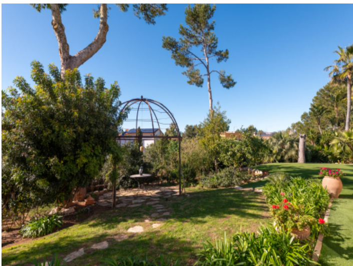
Mediterran angelegter Tarumgarten