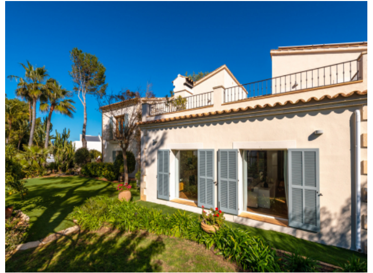
Blick aus dem Garten ins Wohnzimmer