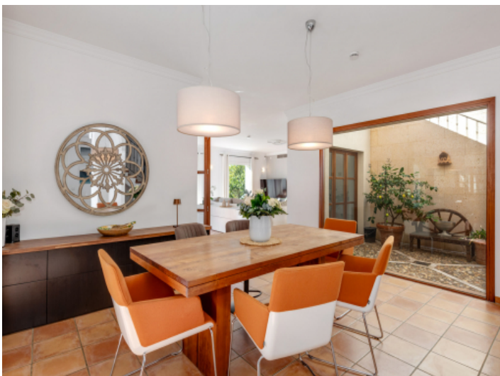
Heller Essbereich mit Blick in den Garten