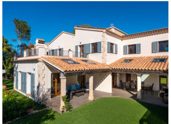
Überdachte Terrassen ideal für gesellige Stunden