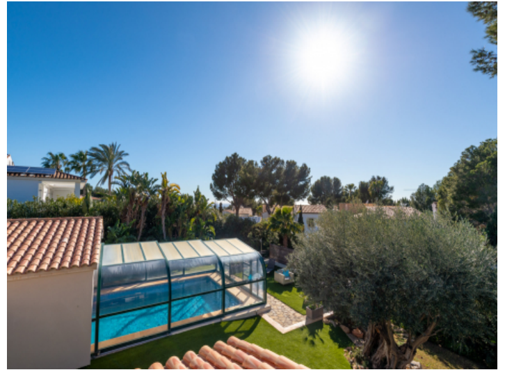
Blick von der Sonnenterrasse