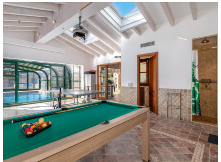
Fitness- / Freizeitraum