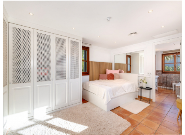
Eines der 6 Schlafzimmer