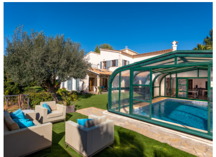
Traumhafter Garten mit wandelbarem Pool – flexibel als Aupool nutzbar