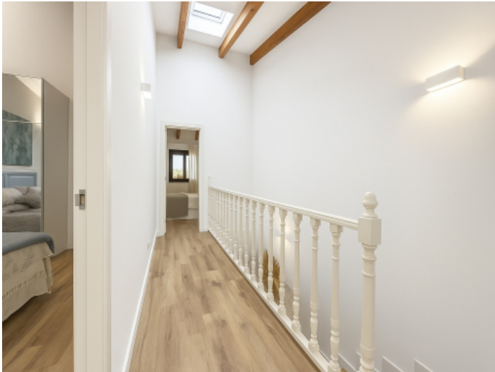
Treppenaufgang mit Lichteinlass und Galerieflur zu den