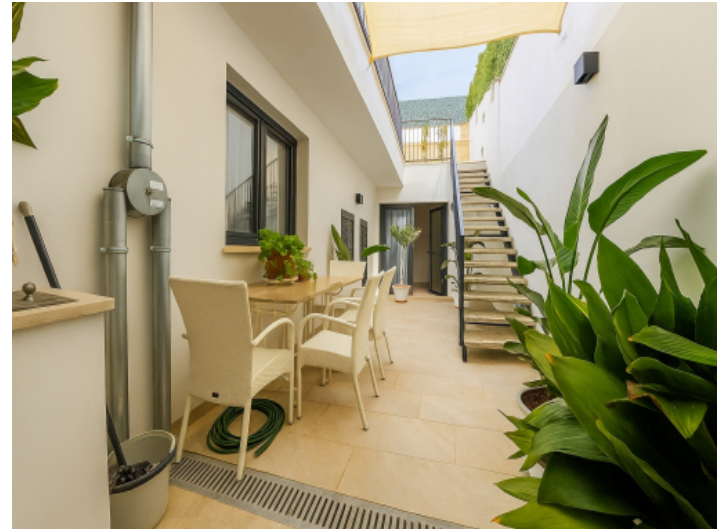
Patio im Erdgeschoss mit Essbereich und Treppe zum Pool