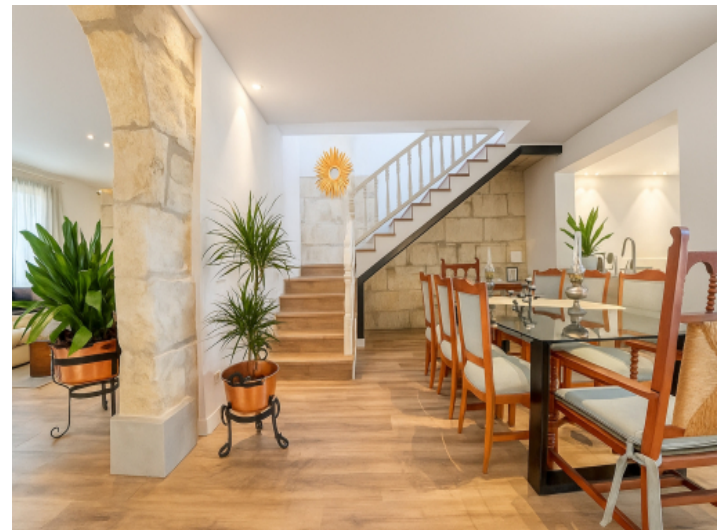
Essbereich mit Treppe ins Obergeschoss und offenem