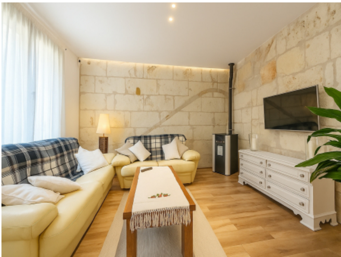
Wohnbereich mit Natursteinwand und Pelletofen