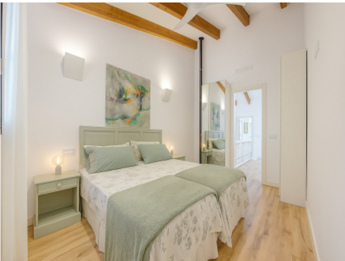
Zweites Doppelschlafzimmer im Obergeschoss mit