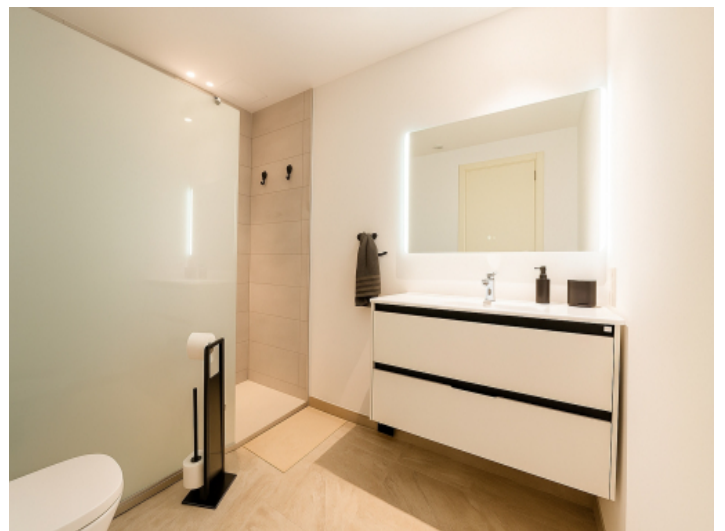
Zweites en-suite Duschbad mit Milchglaswand und modernen Armaturen