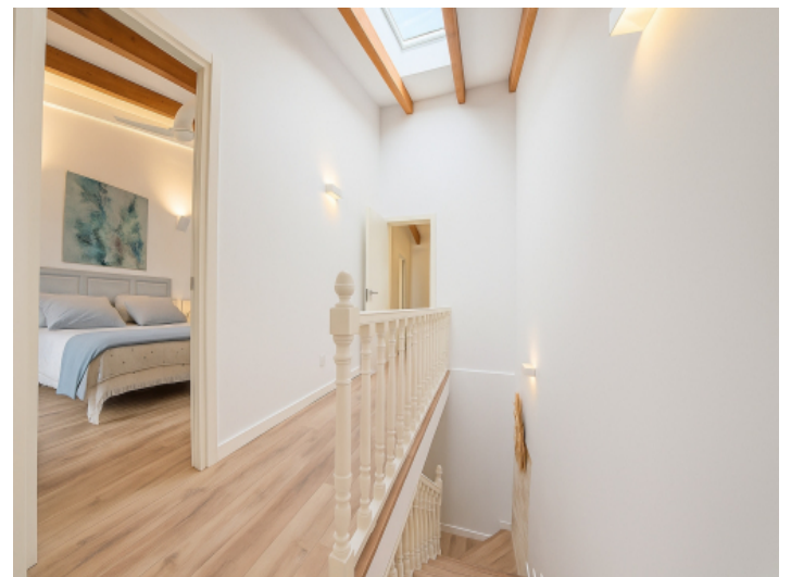
Flur im Obergeschoss mit Oberlicht und Sichtbalken