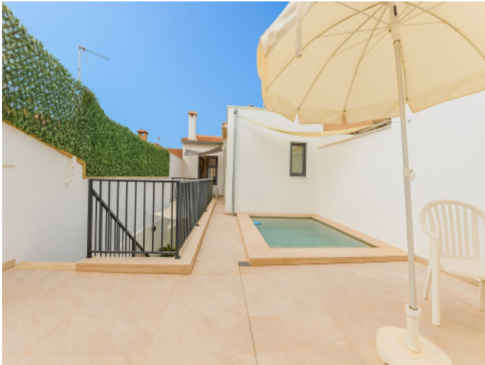
Obergeschoss mit Pool und Sonnenterrasse