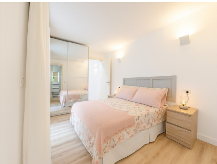
Drittes Doppelschlafzimmer mit Einbauschränk und hellen Akzenten