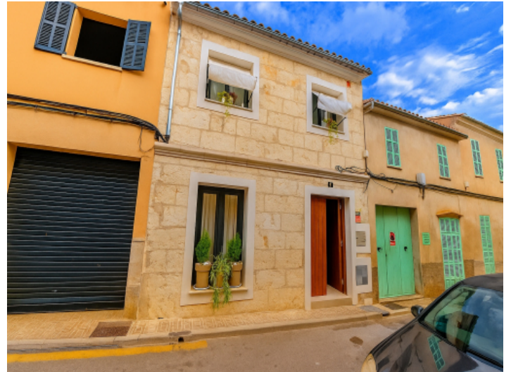
Straßenansicht der renovierten Sandsteinfassade in Santa