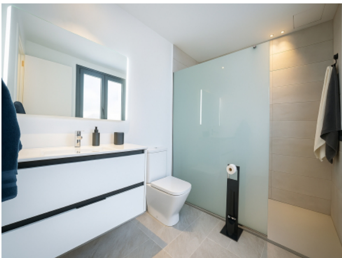
Modernes Duschbad en suite mit Milchglasabtrennung