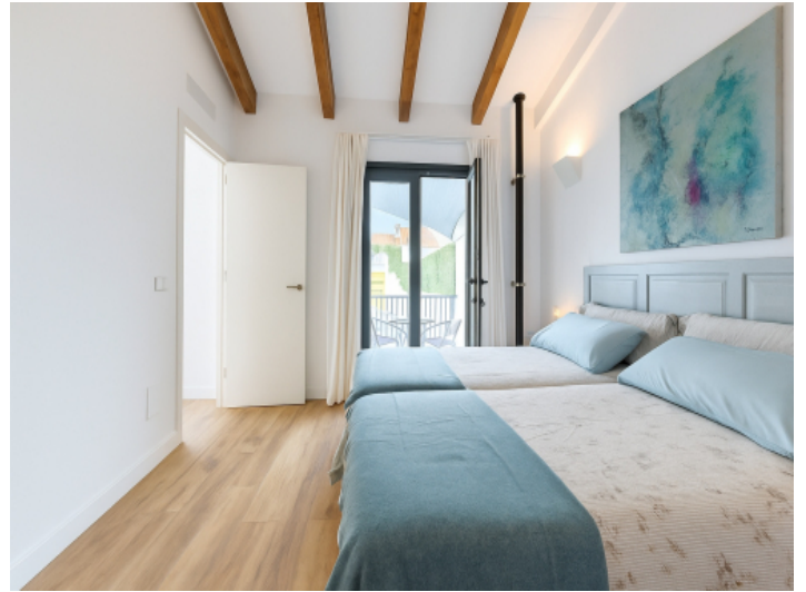
Hauptschlafzimmer mit Blick auf die Terrasse im