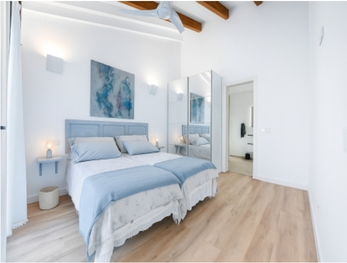
Hauptschlafzimmer mit Doppelbett und Zugang zur Terrasse