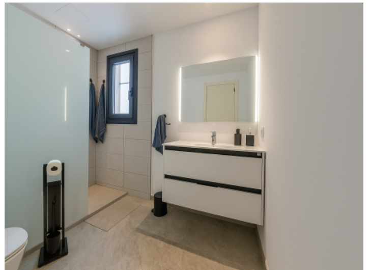
En-suite Badezimmer mit bodengleicher Dusche und