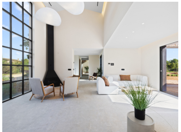
Lichtdurchfluteter Wohnraum mit Kamin