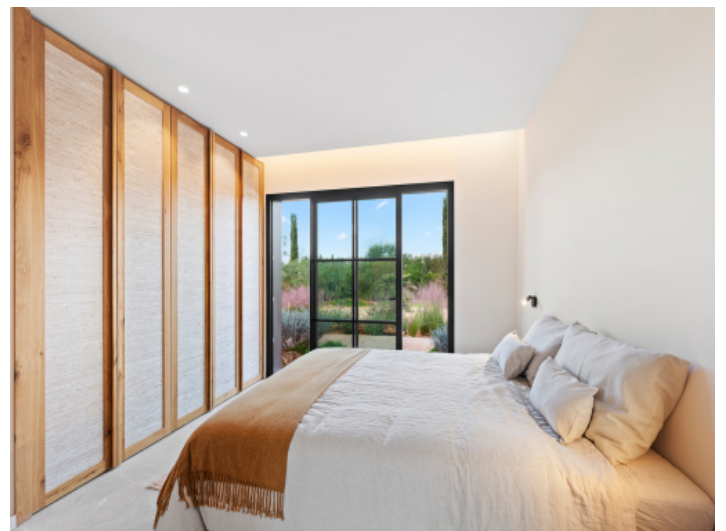
Schlafzimmer im Untergeschoss mit Zugang zum Garten