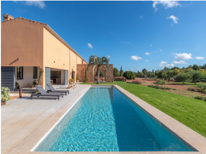
Designer-Neubaufinca in Santa Maria mit Blick auf Pool, Terrasse und umliegende Landschaft