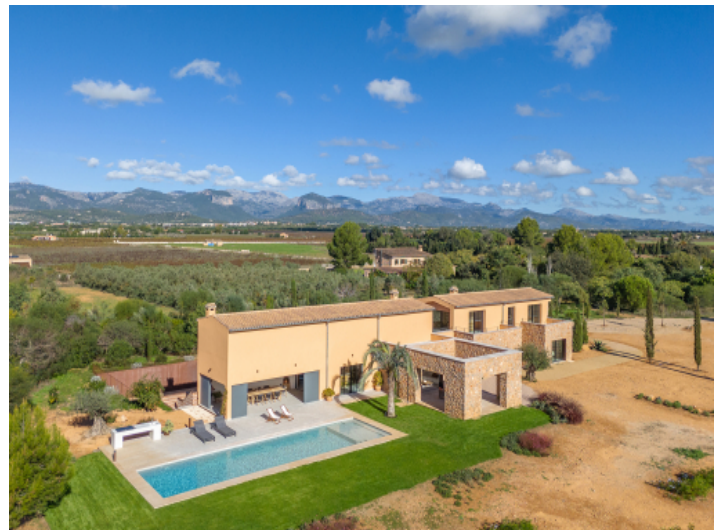
Finca mit großzügige Raumgestaltung auf zwei Ebenen