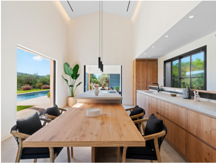
Hochwertige Küche im Landhausstil