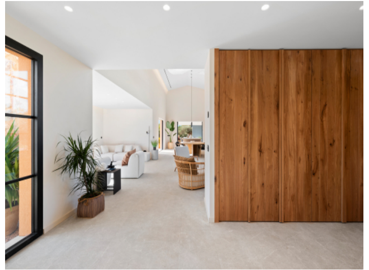
Untergeschoss mit architektonischem Anspruch