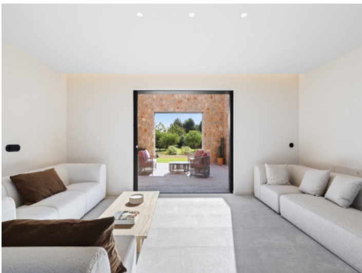
Offenes Wohnkonzept mit Blick ins Grüne