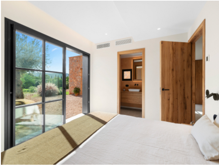
Schlafzimmer im Untergeschoss mit Zugang zum Garten