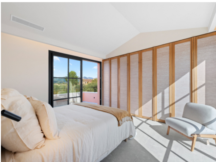
Schlafzimmer im Obergeschoss mit eigener privater Terrasse