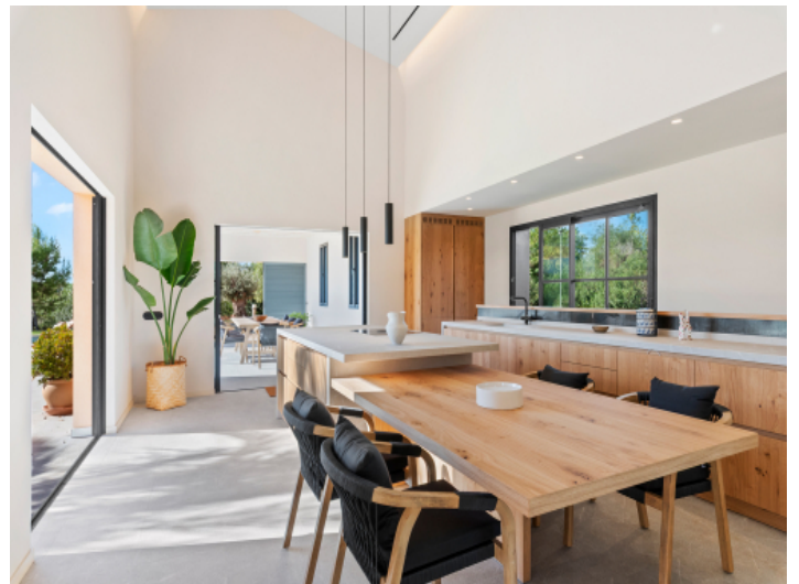
Offener Essbereich mit direktem Zugang nach draußen