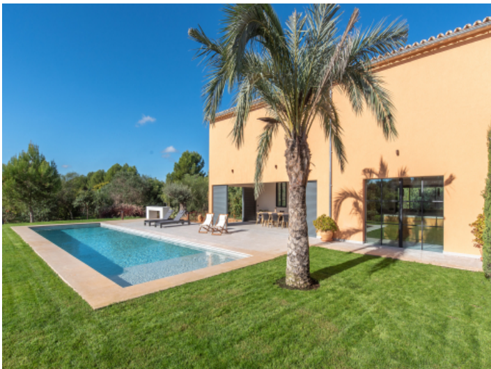
Weitläufiger Poolbereich für pure Entspannung