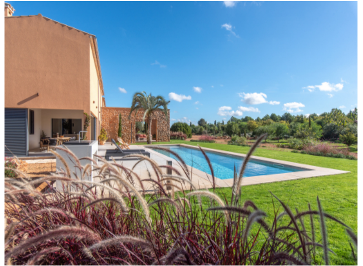
Naturnahe Gartenlandschaft im Inselstil