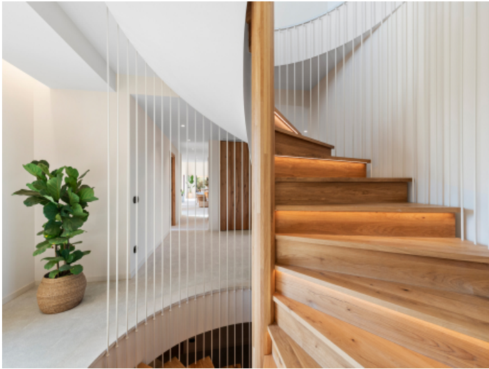
Designertreppe als architektonisches Highlight