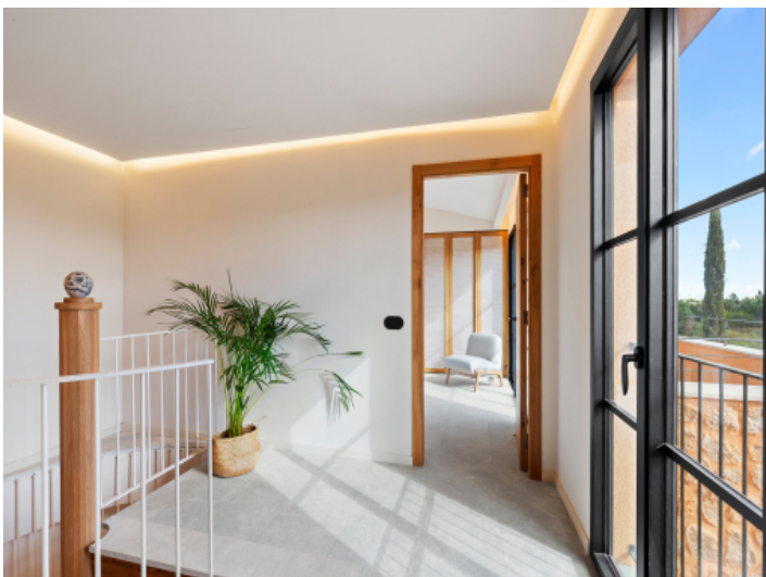
Flur im Obergeschoss