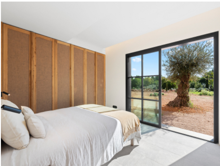
Schlafzimmer im Untergeschoss mit Zugang zum Garten