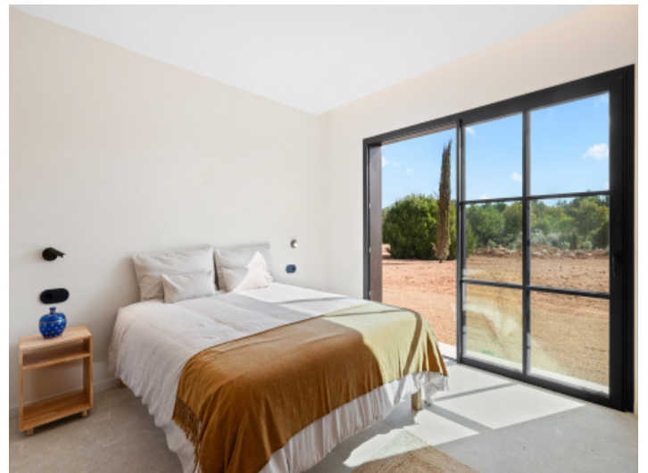
Schlafzimmer im Untergeschoss mit Zugang zum Garten