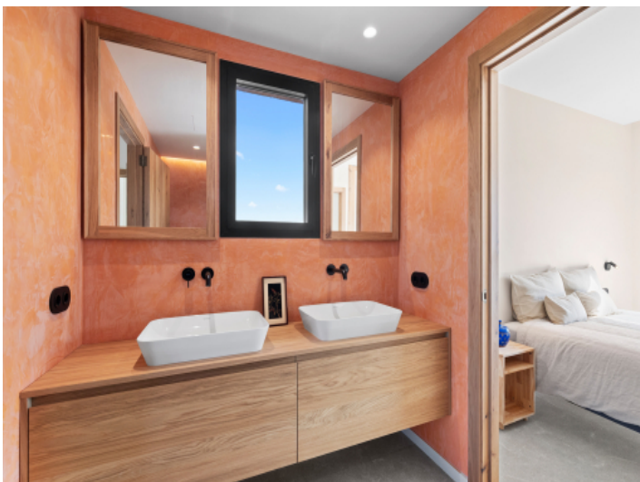
Modernes und zeitloses Badezimmer