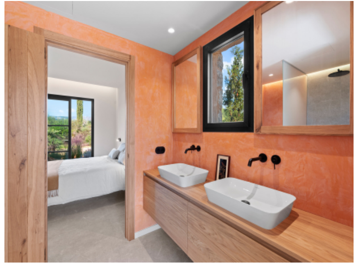
Badezimmer im Untergeschoss