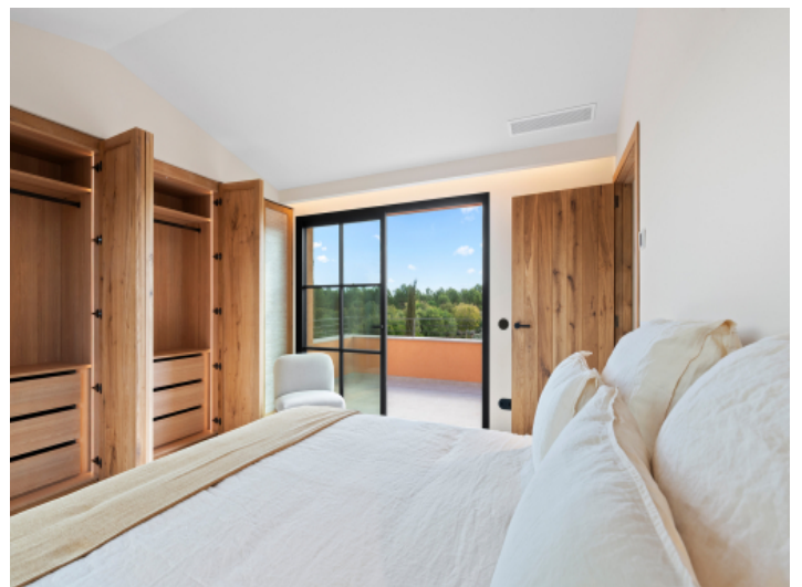
Schlafzimmer im Obergeschoss mit eigener privater Terrasse