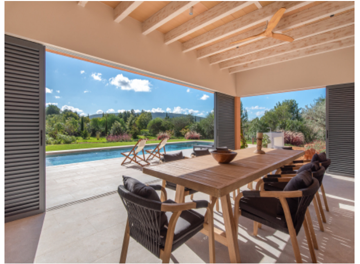
Terrassenbereich mit variabler Beschattung und Windschutz