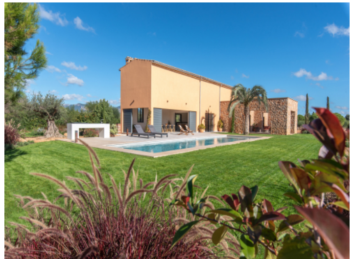
Grüne Ruheoase rund ums Haus