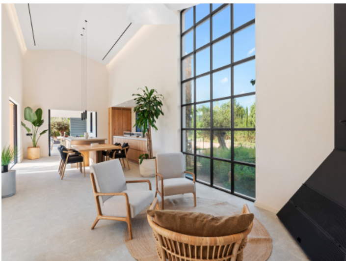
Lichtdurchfluteter Wohnraum mit modernem Design