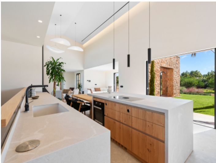
Küche mit Blick zur Terrasse