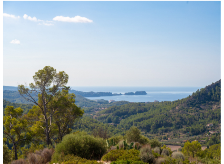
Weitblick auf das Meer