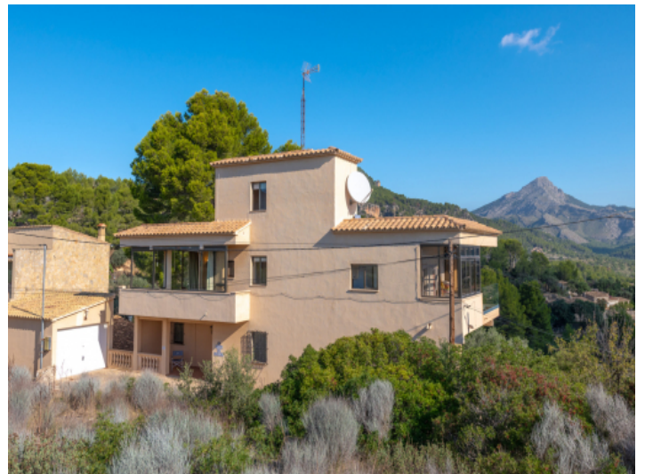
Aussenansicht des Hauses