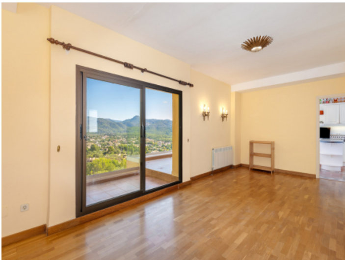
Austritt zu einer weiteren Terrasse