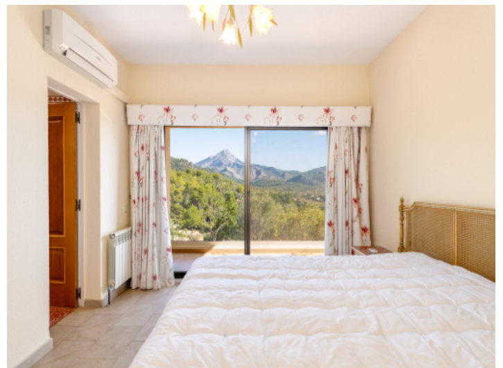
Schlafzimmer mit Terrasse und Weitblick