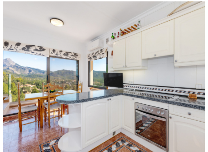
Offene Küche mit angrenzendem Essbereich