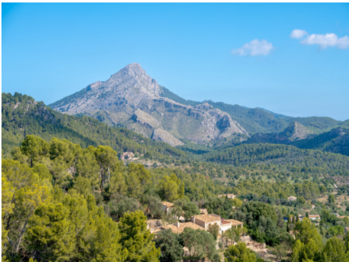
Wunderschöner Blick auf das Gebirge