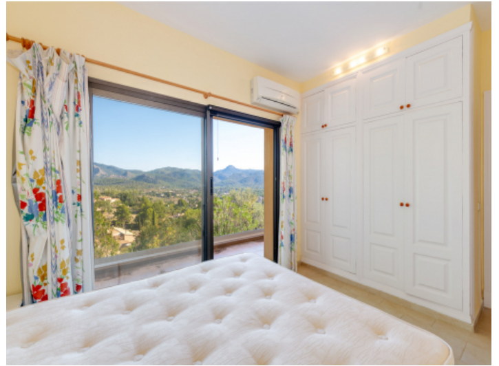
Weiteres Schlafzimmer mit toller Aussicht