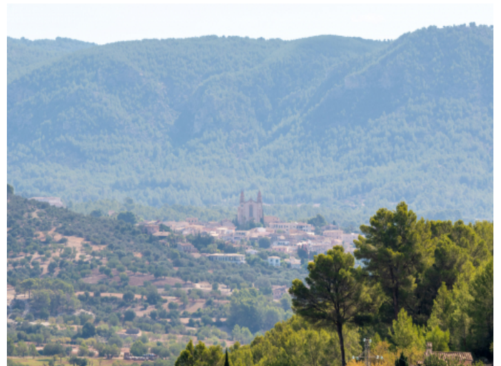
Aussicht auf das Dorf Es Capdella