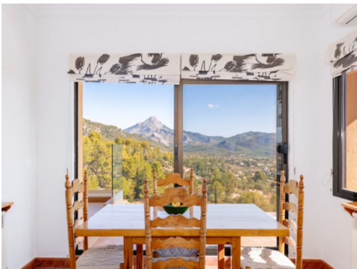
Essbereich mit fantastischem Ausblick