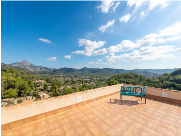
Haus, Es Capdella