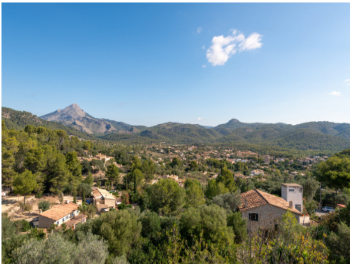
Traumhafter Blick in die Landschaft