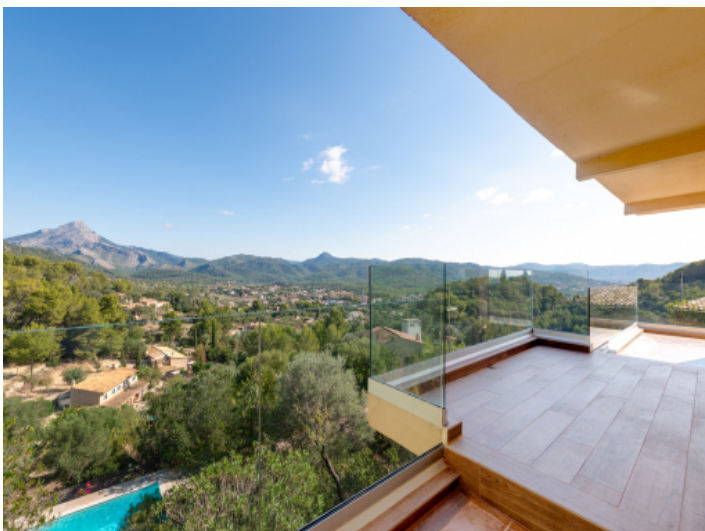
Überdachte Terrasse mit Weitblick