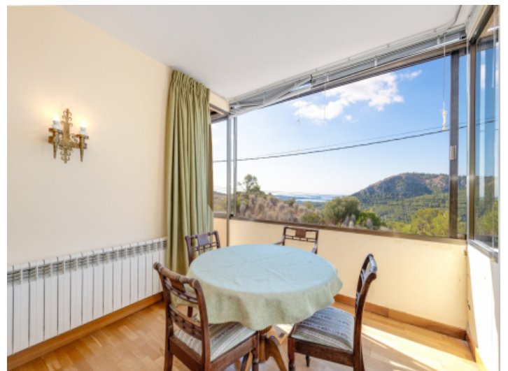
Essbereich mit herrlicher Aussicht