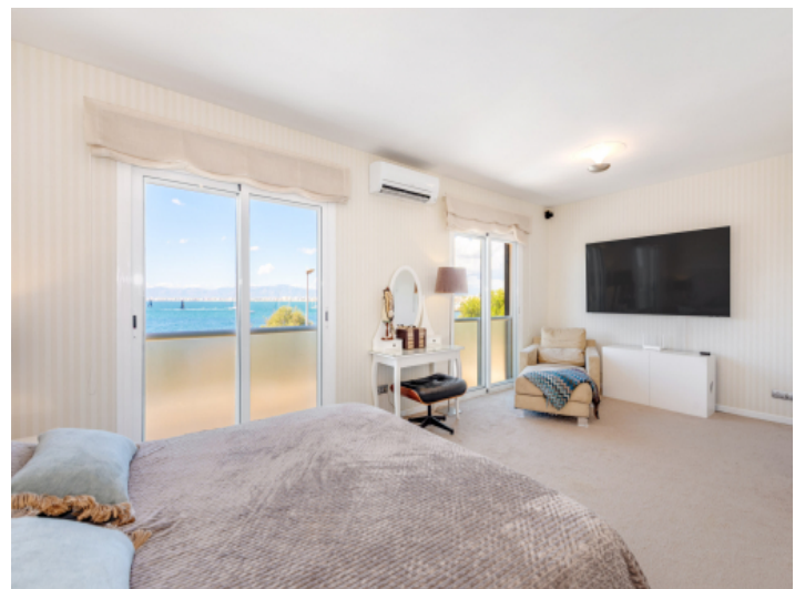
Hauptschlafzimmer mit Bad en Suite