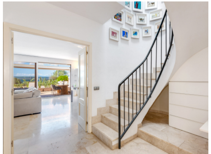
Aufgang ins Obergeschoss