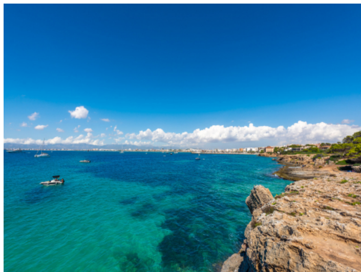
Bucht von Palma