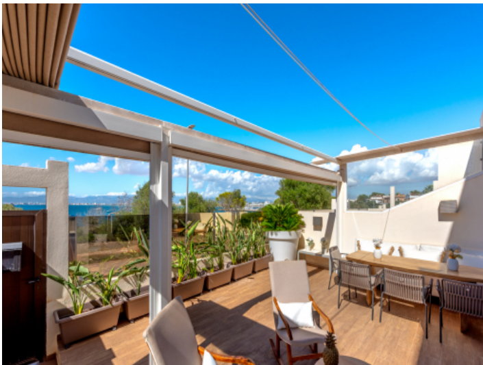
Terrasse mit Markise