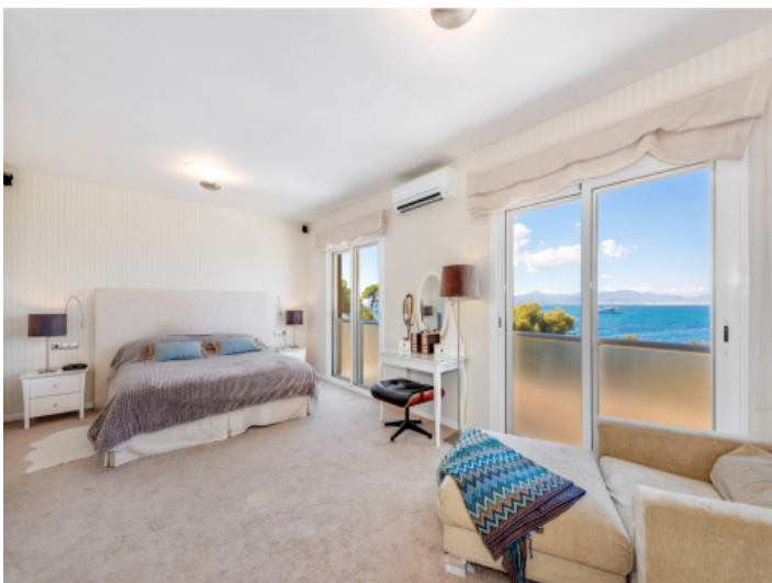
Hauptschlafzimmer mit Meerblick