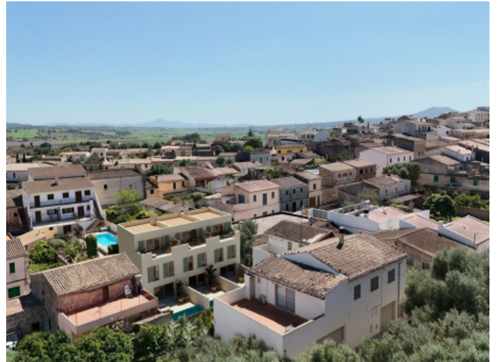
Vogelperspektive auf das Projekt