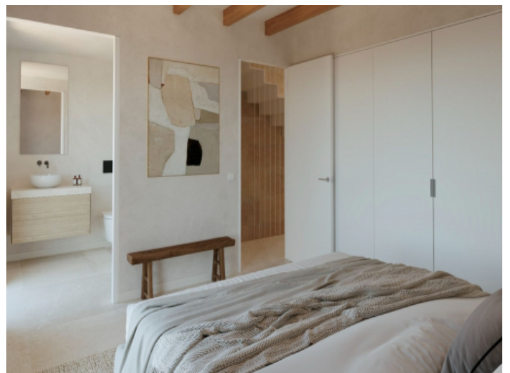
Eines der drei Schlafzimmer