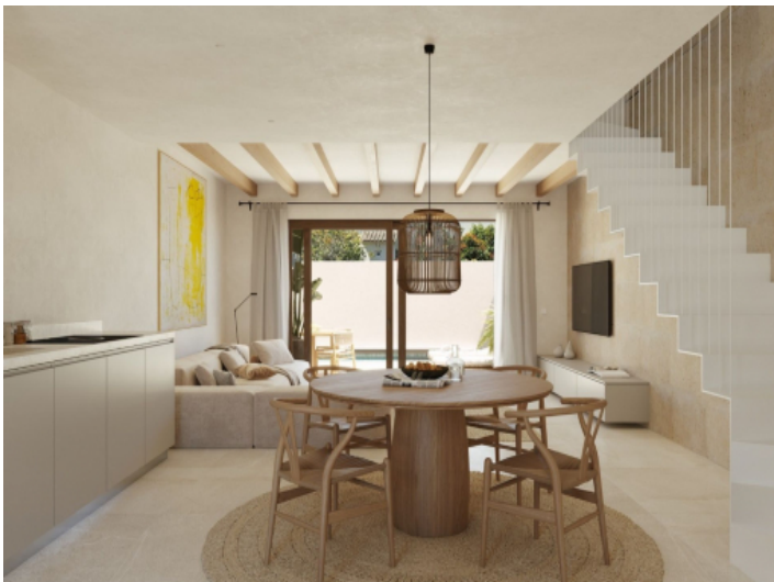
Heller und geräumiger Wohn-Essbereich