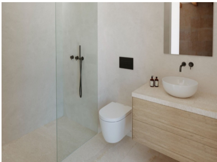
Eines der zwei Badezimmer