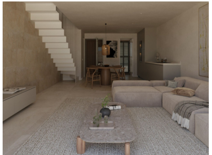
Offene Küche, Wohn-Essbereich