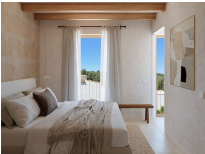
Eines der drei Schlafzimmer