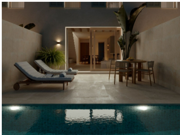
Innenhof und Pool