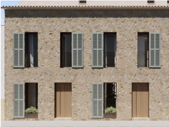
Außenfassade Haus A & B