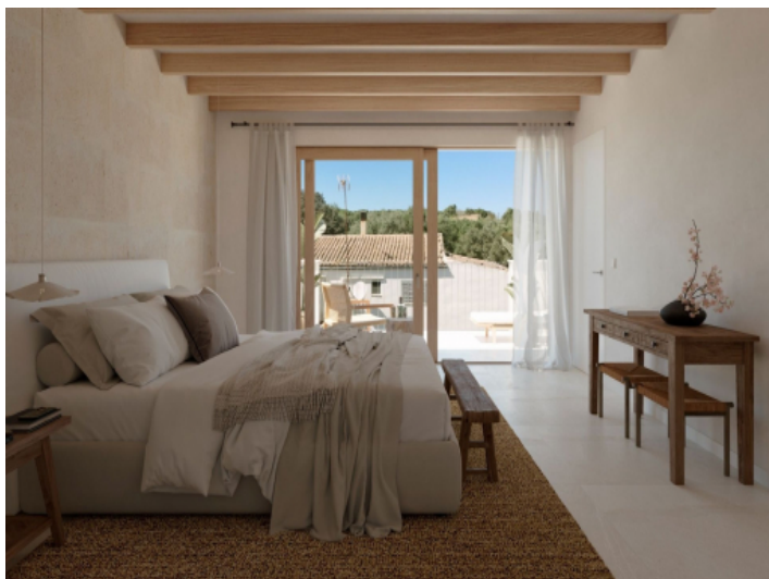
Eines der drei Schlafzimmer