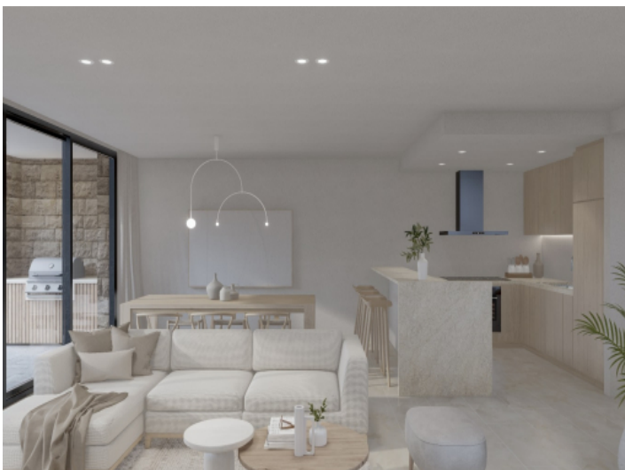
Salon mit Terrassenzugang