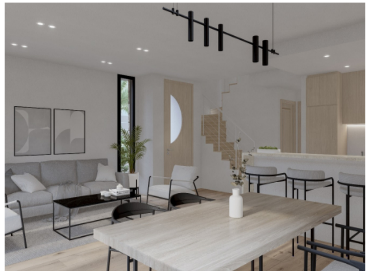
Wohnbereich im Erdgeschoss