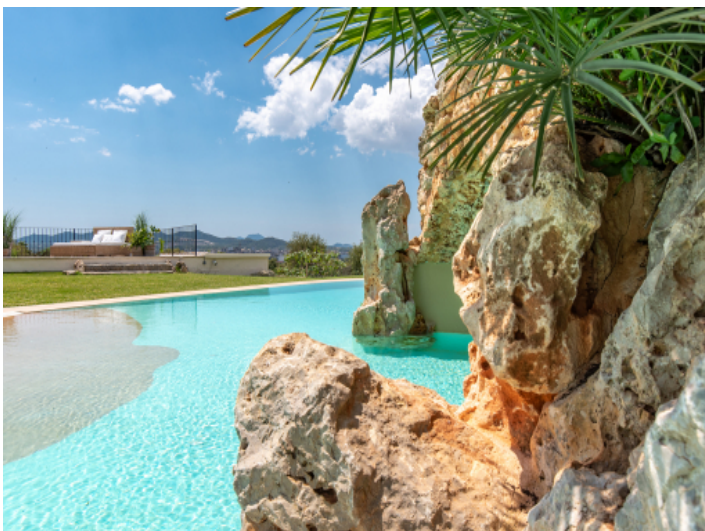
Pool mit Grotte