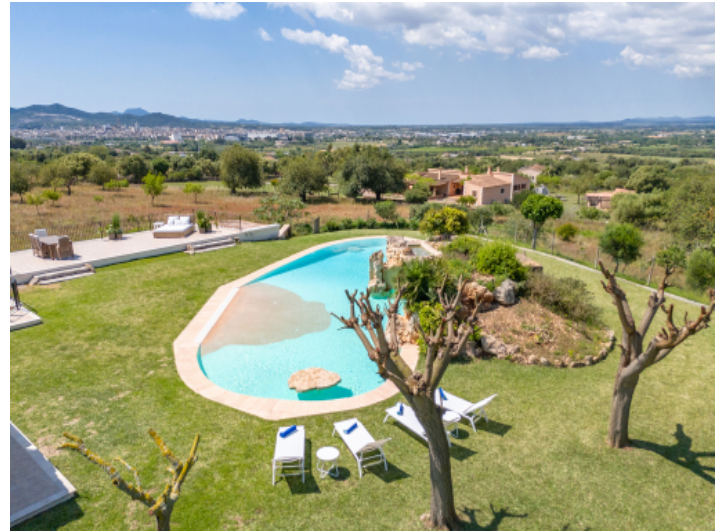
Pool mit Ausblick