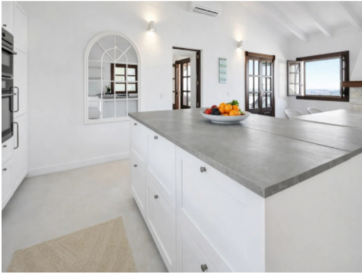
Küche mit Ausblick