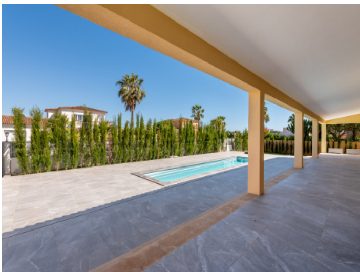
Terrasse - Pool