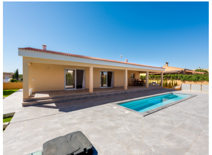
Terrasse - Pool