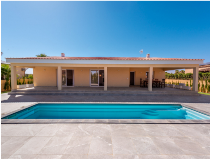
Terrasse - Pool