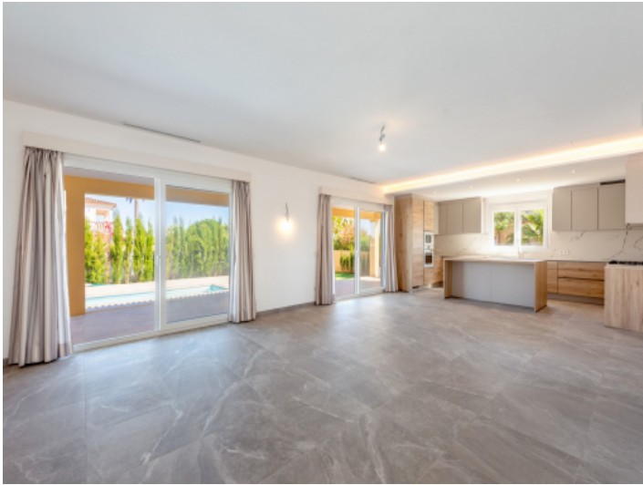
Küche - Wohnbereich