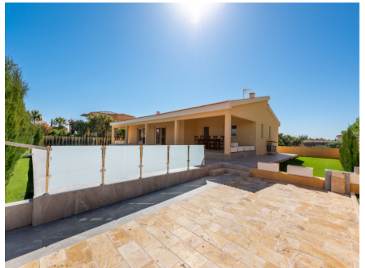
Eingang - Parkplatz