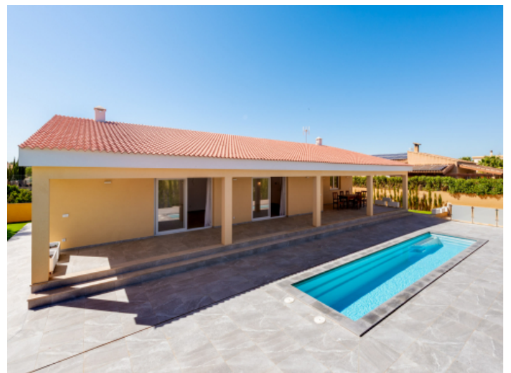
Terrasse - Pool