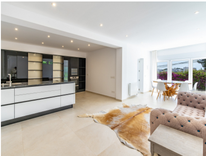
Küche - Gästeapartment