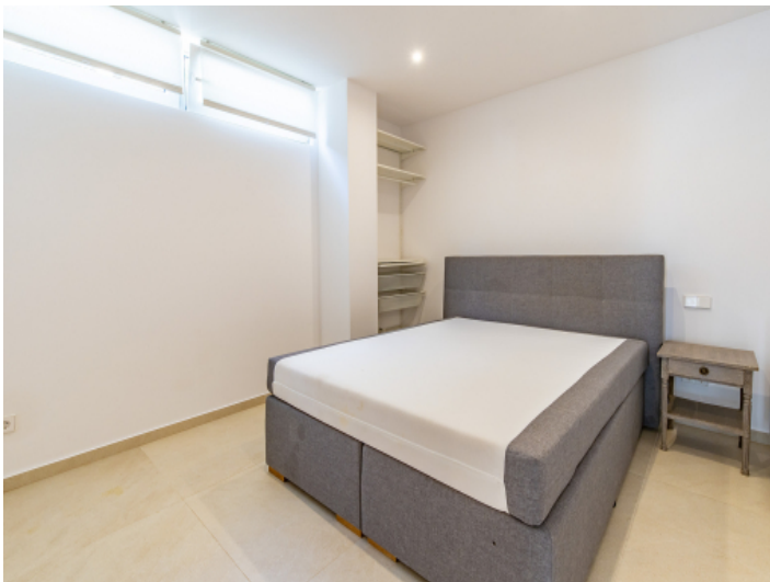
Schlafzimmer - Gästeapartment