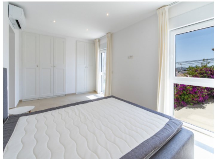
Schlafzimmer - Gästeapartment