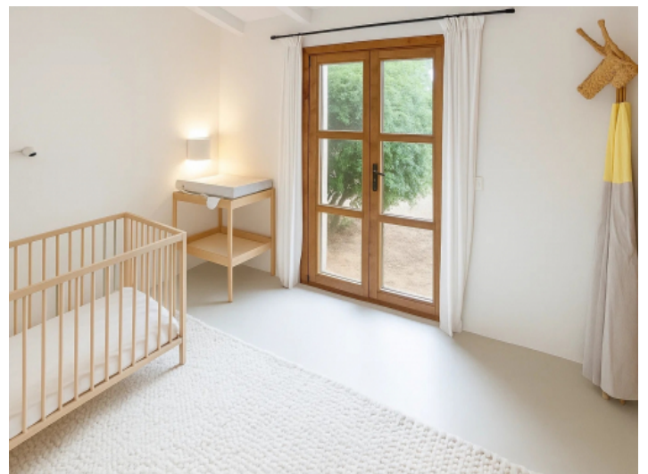
Schlafzimmer des Gästehauses