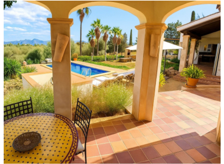
Blick von der Terrasse des Gästetraktes