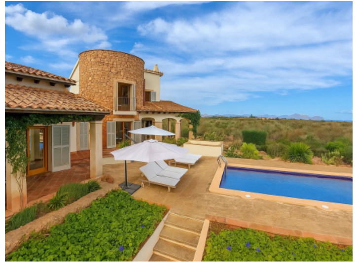
Finca mit Weitblick