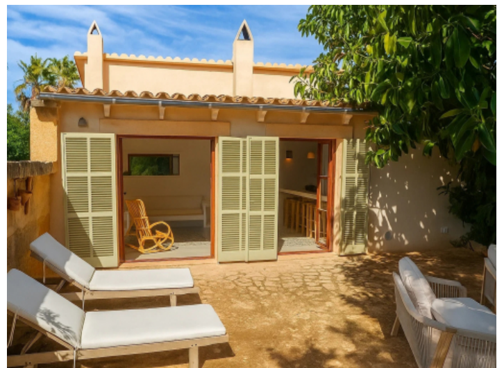
Terrasse des separaten Gästehauses