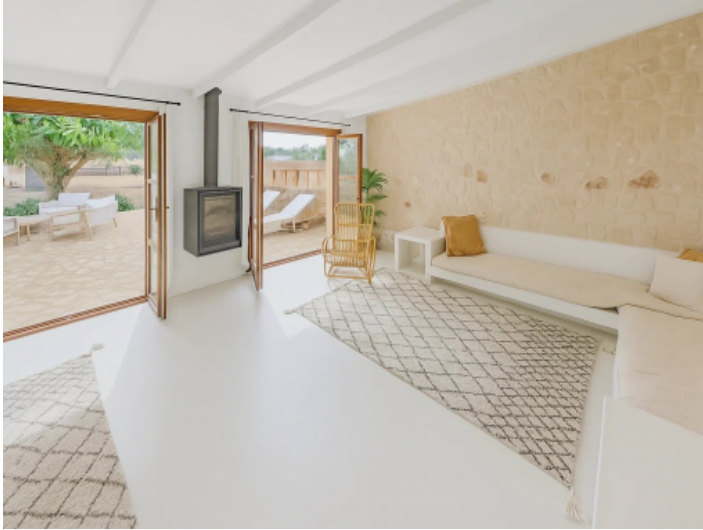
Stylishes Wohnzimmer des separaten Gästehauses