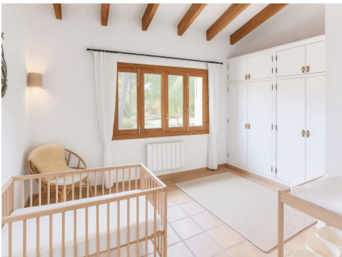
Das Zweite Schlafzimmer des Haupthauses