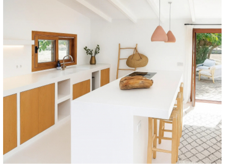
Komplette ausgestattete Küche des separaten Gästehauses