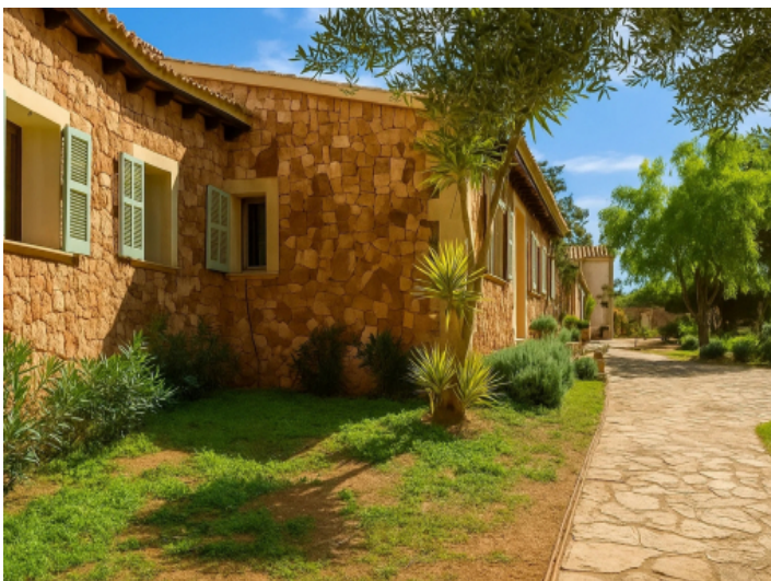
Natursteinfassade des Haupthauses