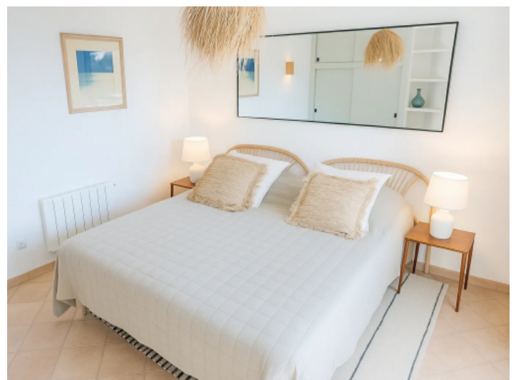
Erstes Schlafzimmer der Einliegerwohnung