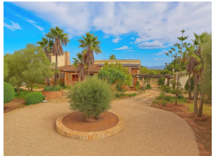
Auffahrtsrondell des Landhauses