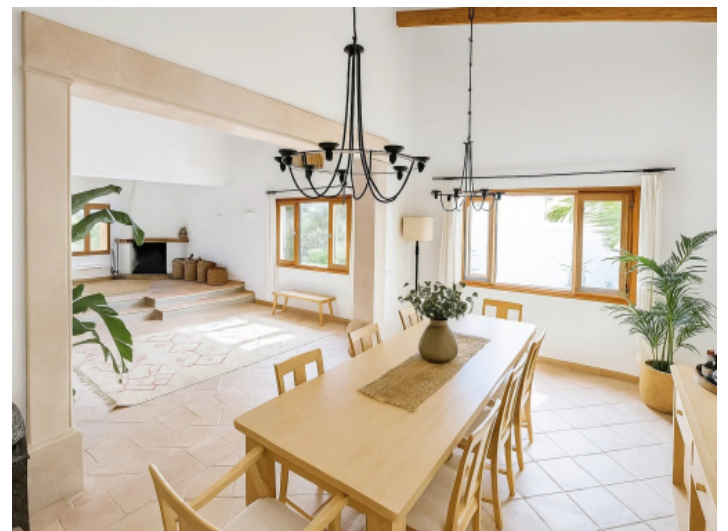
Essbereich korrespondiert mit dem Wohnbereich