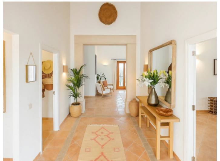
Der Empfangsbereich des Haupthauses