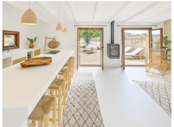
Offenes Wohnkonzept Küche und Wohnzimmer