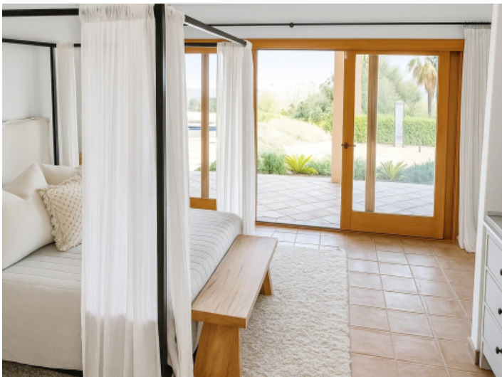
Die Mastersuite im Haupthaus