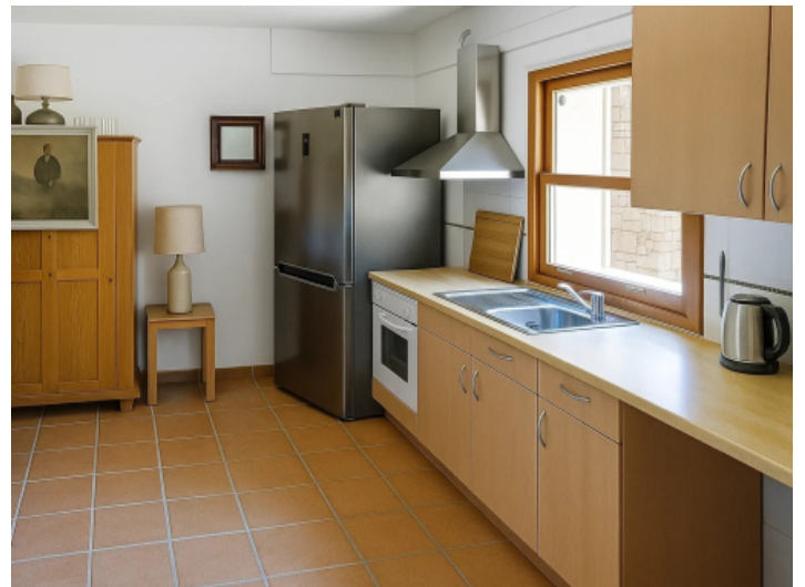
Küche der Einliegerwohnung