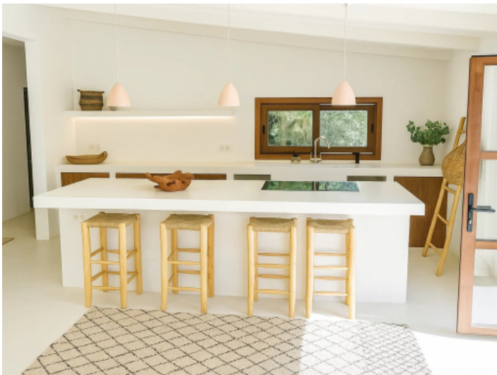
Amerikanische Küche des Gästehauses