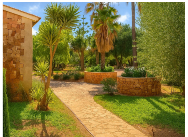
Repräsentativer Zuweg zu den Häuser