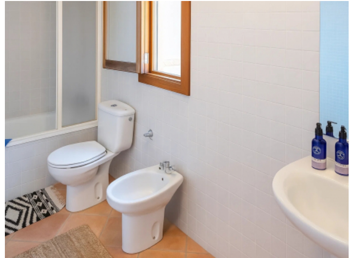
Badezimmer im OG der Einliegerwohnung