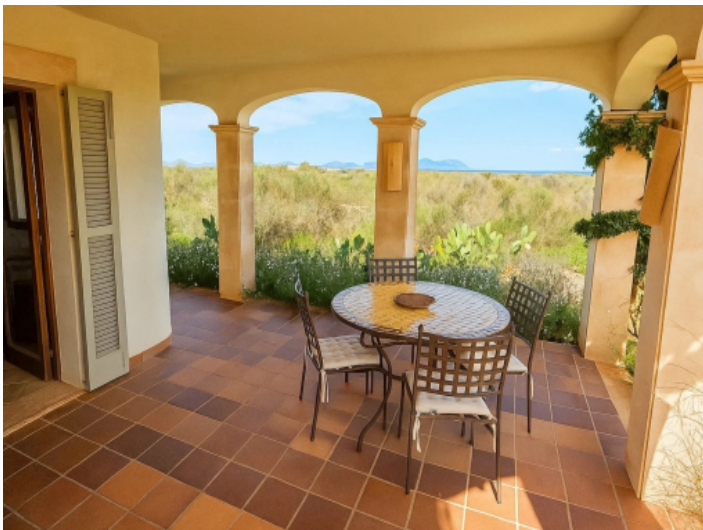
Blick in Richtung Bucht von Alcudia