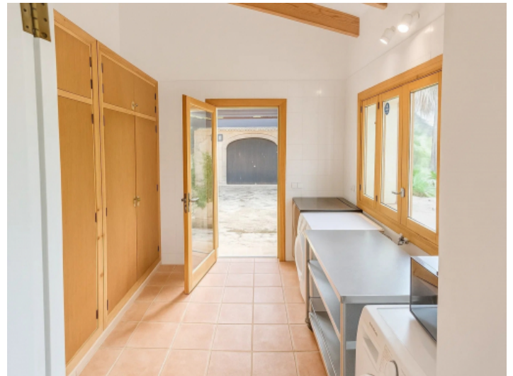
Waschküche mit Zugang in den Außenbereich