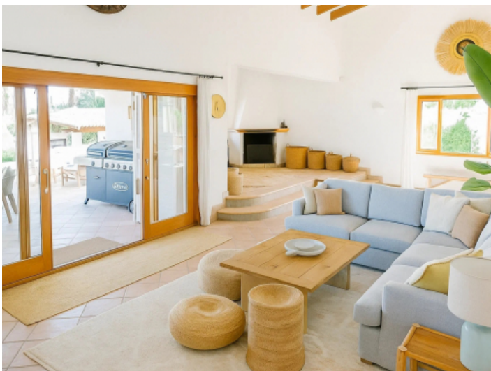
Modernes Wohnzimmer mit Kaminecke und Terrassenzugang