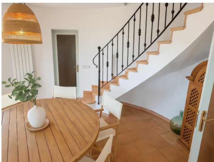
Treppenaufgang zu den Schlafzimmern