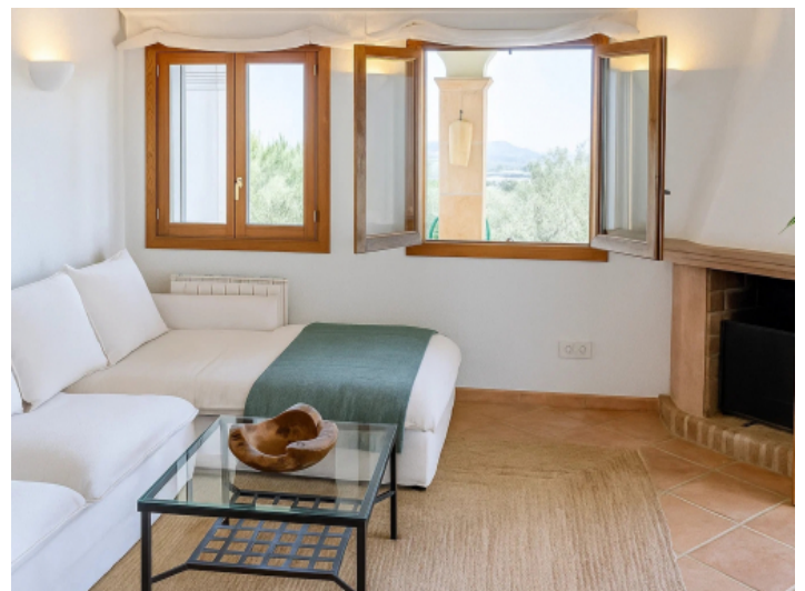
Wohnzimmer der Einliegerwohnung