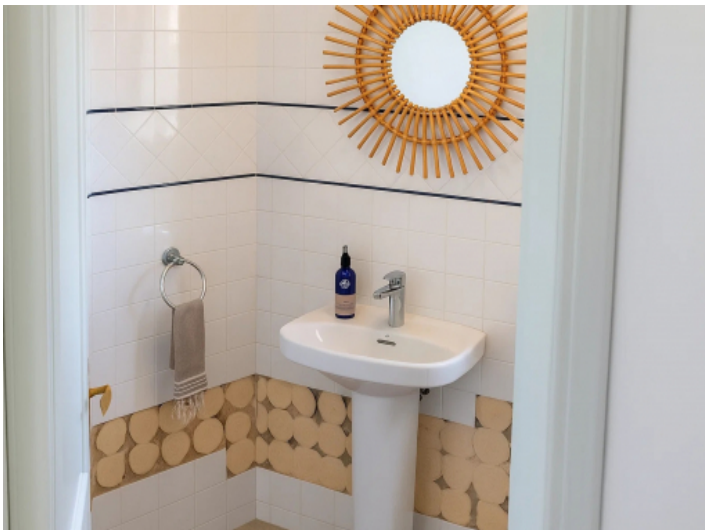
Badezimmer im Erdgeschoss der Einliegerwohnung