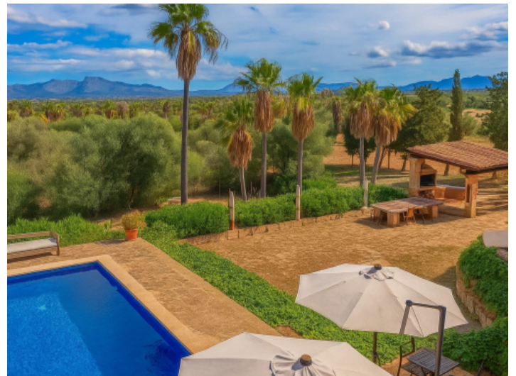
Blick über den Garten und Landschaft