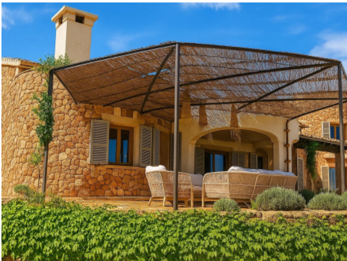
Großzügige überdachte Terrasse des Haupthauses