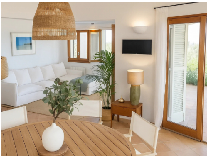
Separater Gästebereich des Haupthauses