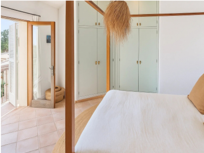
Zweite Schlafzimmer der Einliegerwohnung