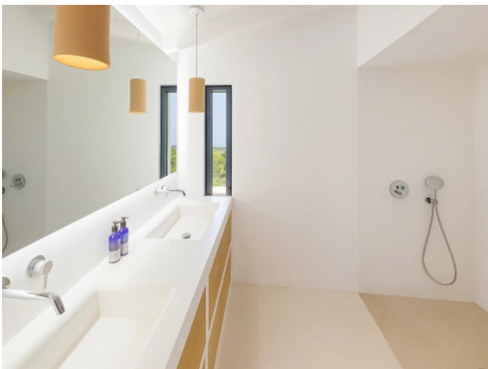
Badezimmer des Gästehauses