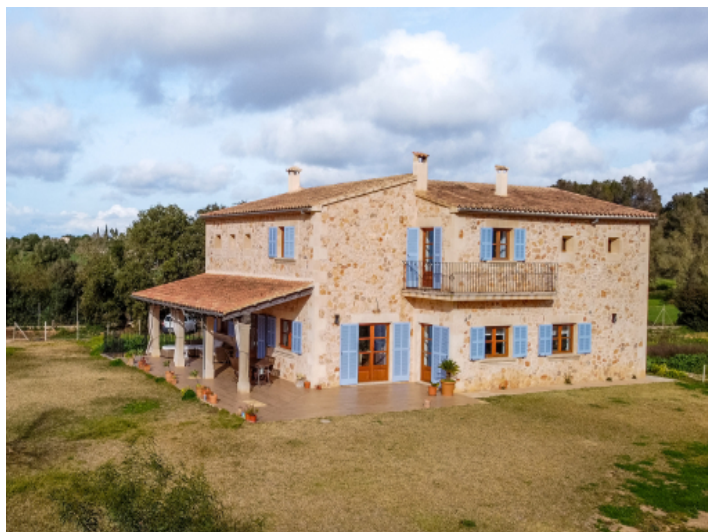
Exklusive Natursteinfinca mit Pool und Panoramablick in