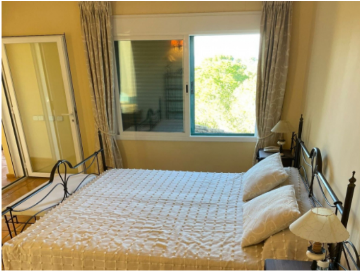
Eines von 8 Schlafzimmern