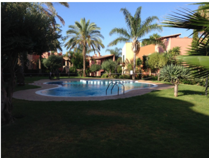
Gemeinschaftspool mit Garten