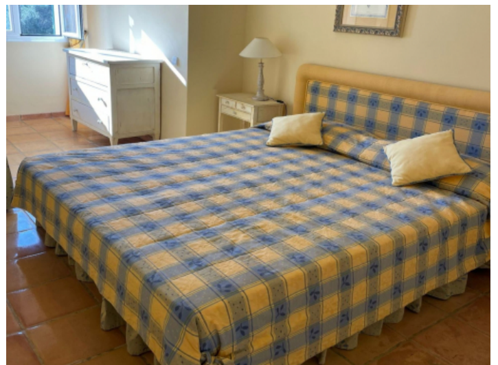
Eines von 8 Schlafzimmern