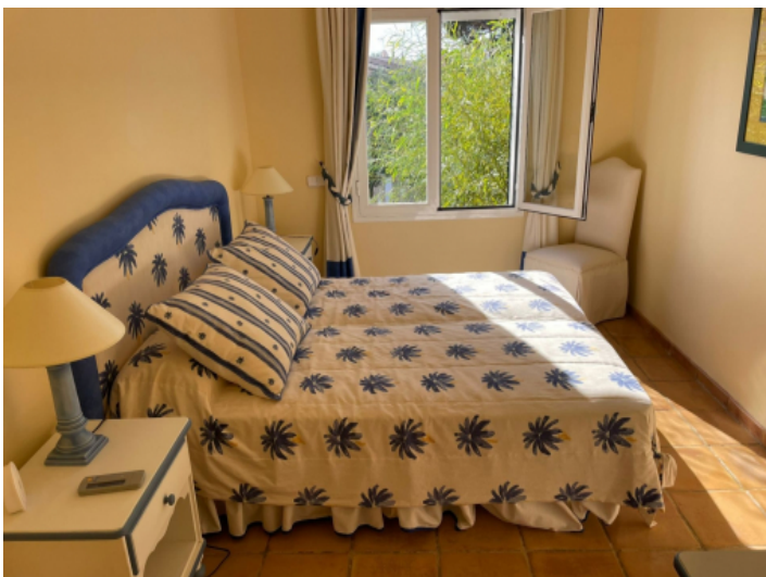
Eines von 8 Schlafzimmern