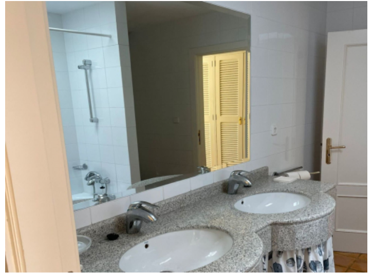
Eines von 8 Badezimmern