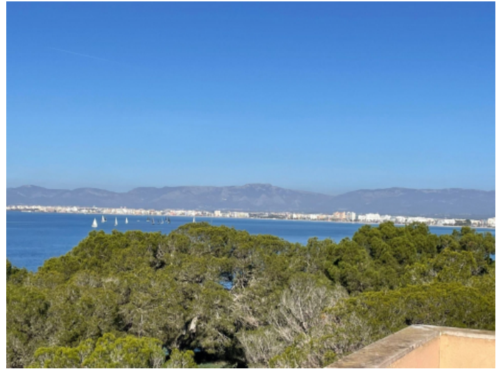
Meerblick von der Dachterrasse