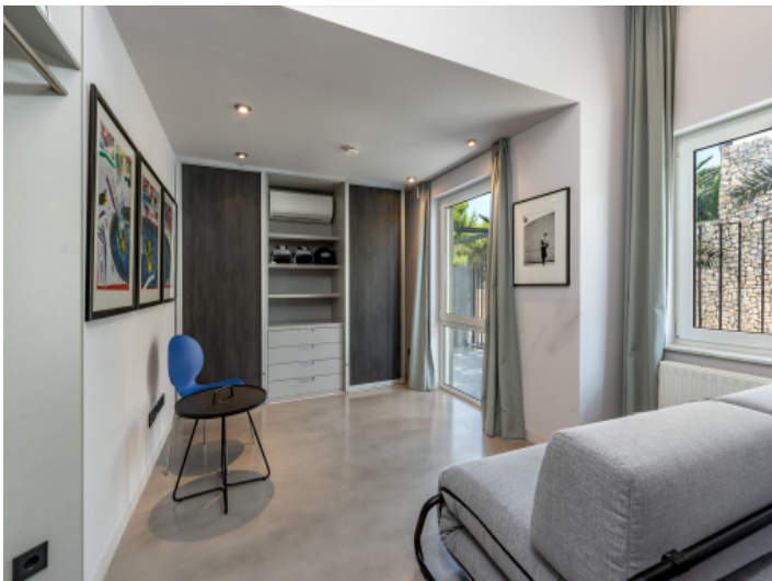
Eines von 4 Schlafzimmern