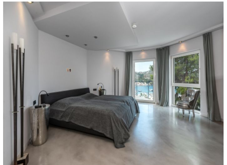
Eines von 4 Schlafzimmern