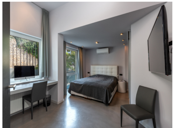
Eines von 4 Schlafzimmern