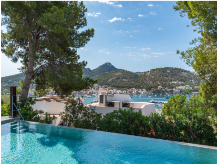
Pool mit Meerblick