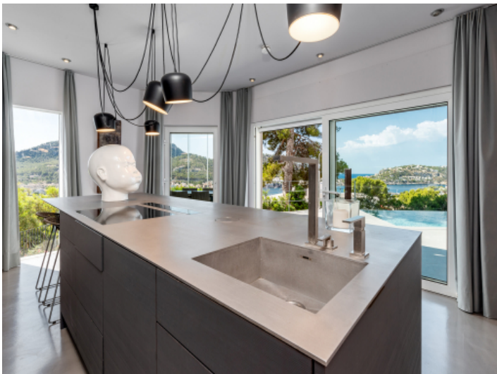
Die Küche verfügt über eine Kochinsel