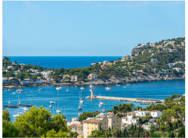
Fantastischer Blick aufs Meer