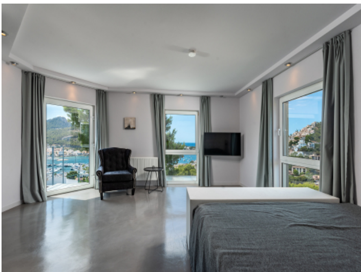
Eines von 4 Schlafzimmern