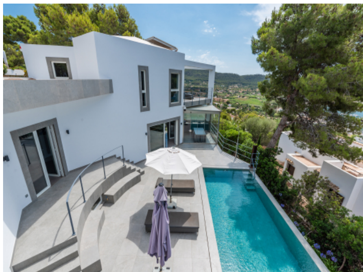
Terrasse mit Poolbereich