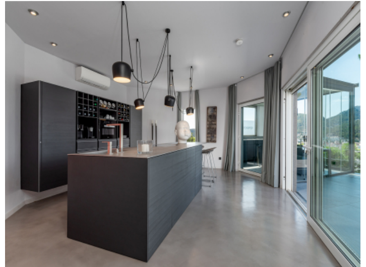
Küche mit direktem Terrassenzugang