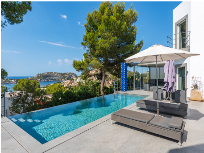
Terrasse mit Poolbereich