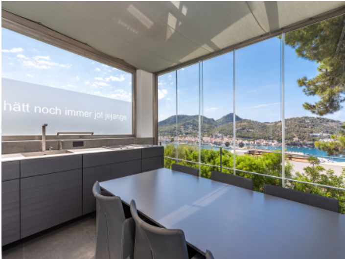
Essbereich mit kleiner Küche