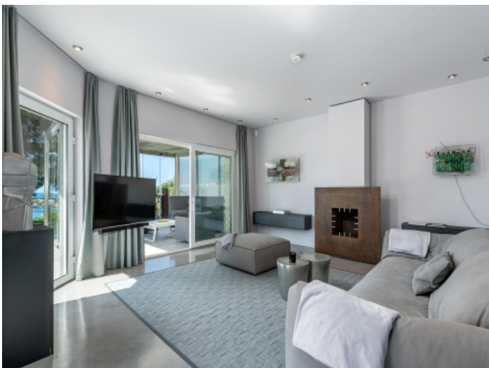
Wohnbereich mit bodentiefen Fenstern