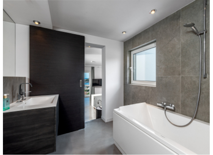
Badezimmer mit Badewanne