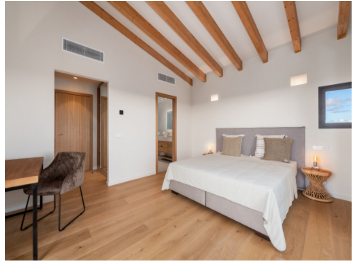
Mastersuite mit Badezimmer en Suite