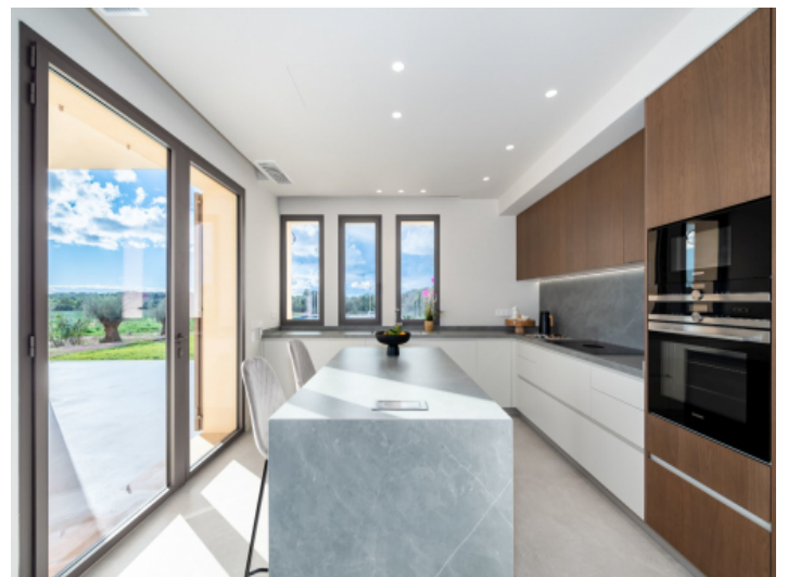
Moderne Einbauküche mit Kücheninsel