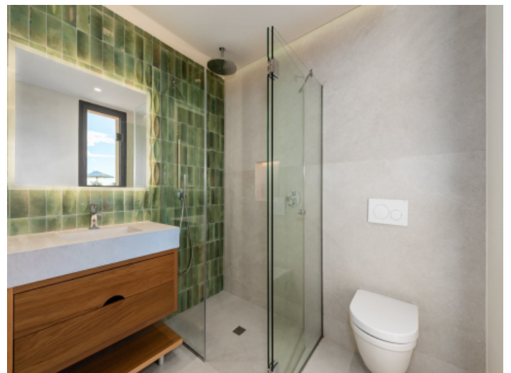
Eines von 5 Badezimmern