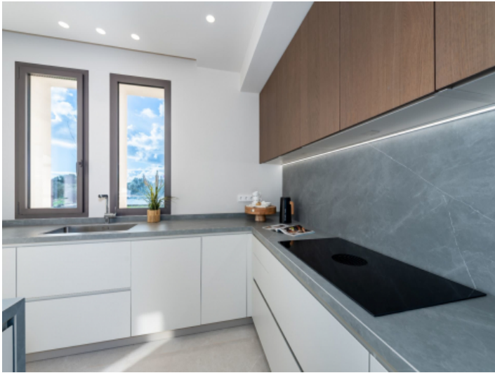
Küche mit viel Licht