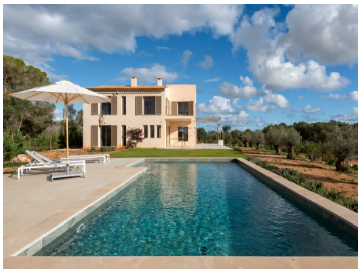
Ansicht auf den Pool und die Finca