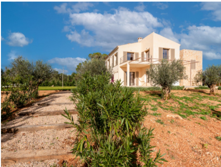
Auffahrt zur Finca