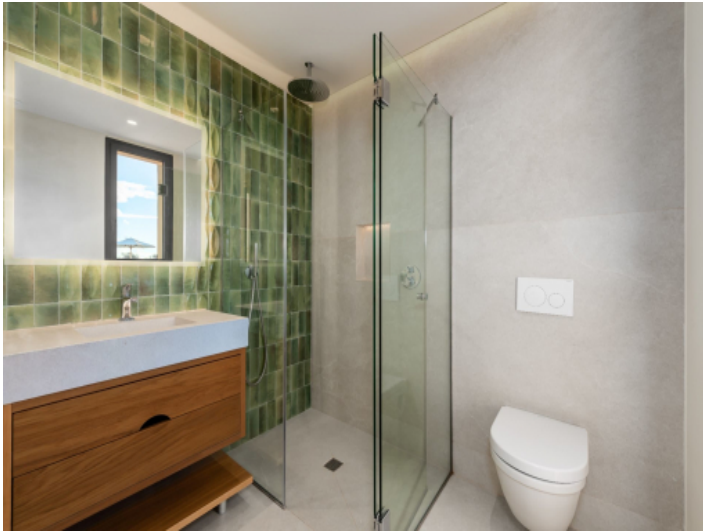
Eines von 5 Badezimmern