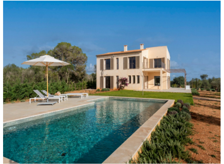
Sehr schöne und weitläufige Poollandschaft