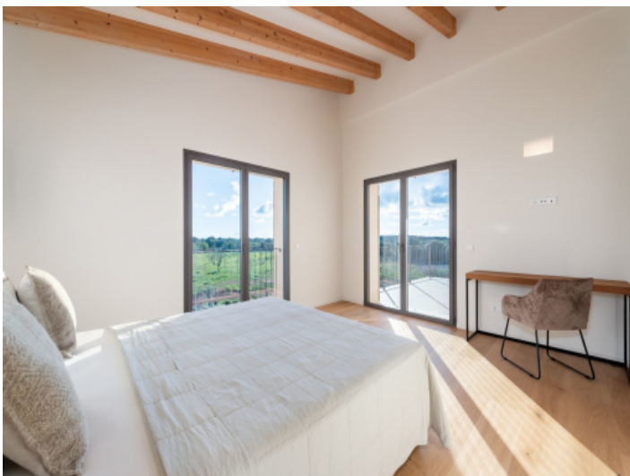
Ein weiteres Schlafzimmer