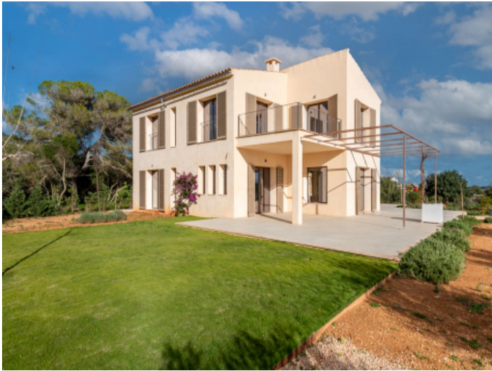
Garten und Fassade