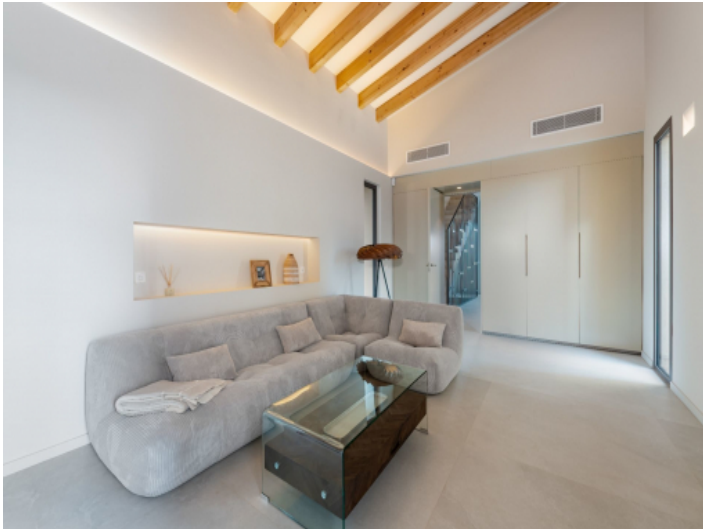
Separater TV Raum