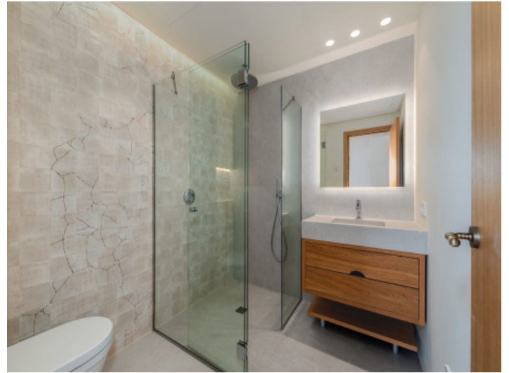
Badezimmer mit bodentiefer Dusche