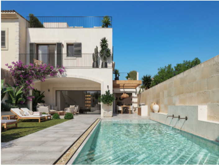
Haus, Ses Salines