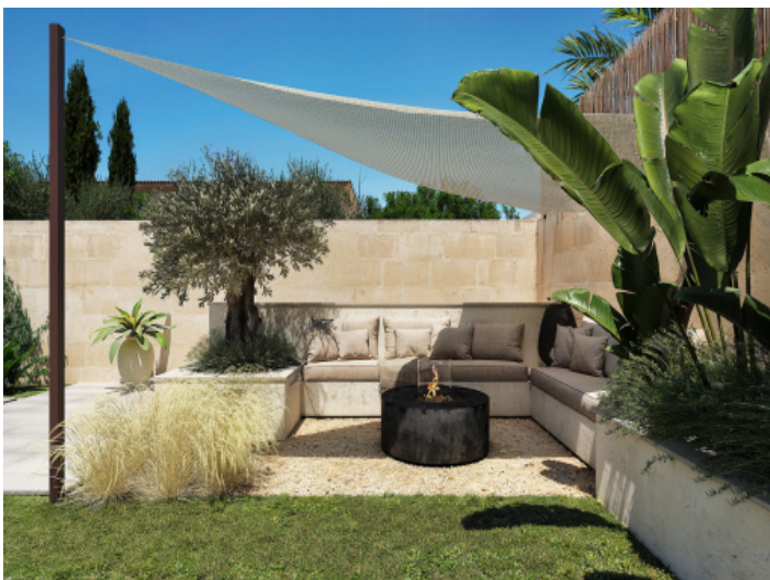
Loungebereich im Garten