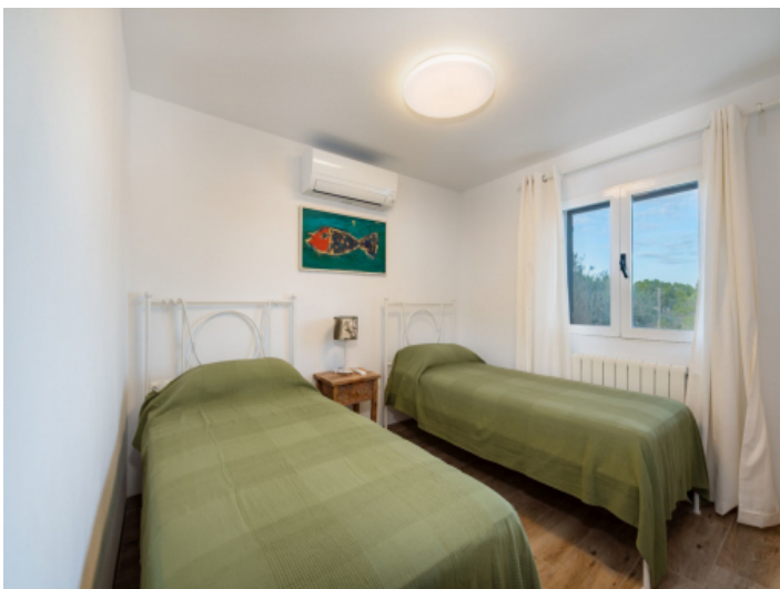
Schlafzimmer 1. Etage