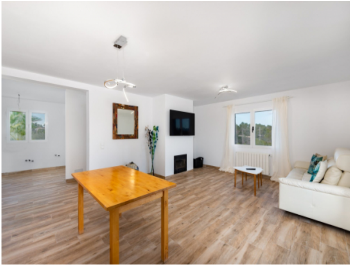
Wohnbereich Oben mit Kamin