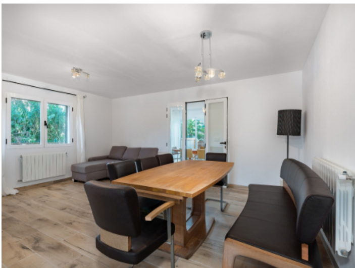
Wohn- und Essbereich EG