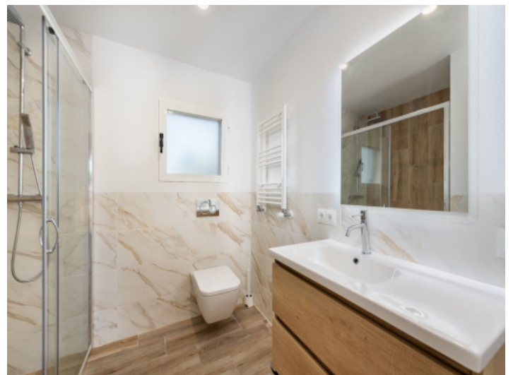
Villa mit 2 Badezimmern