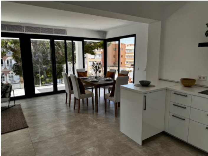
Offene Küche und Essbereich