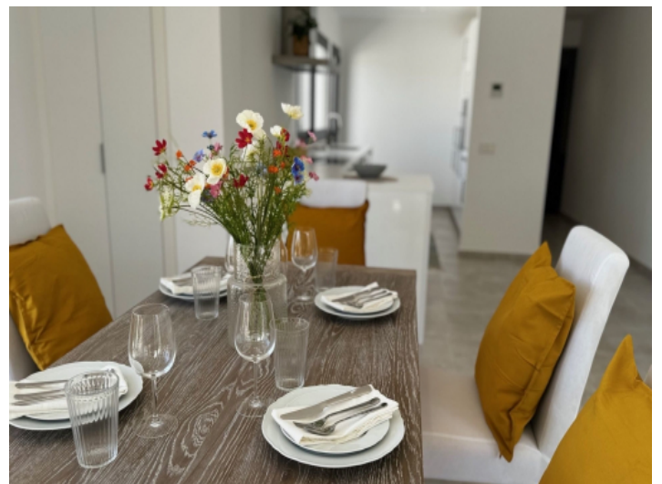
Detailansicht des Essbereichs