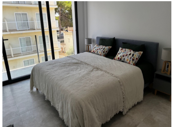
Wunderschön gestaltetes Doppelschlafzimmer