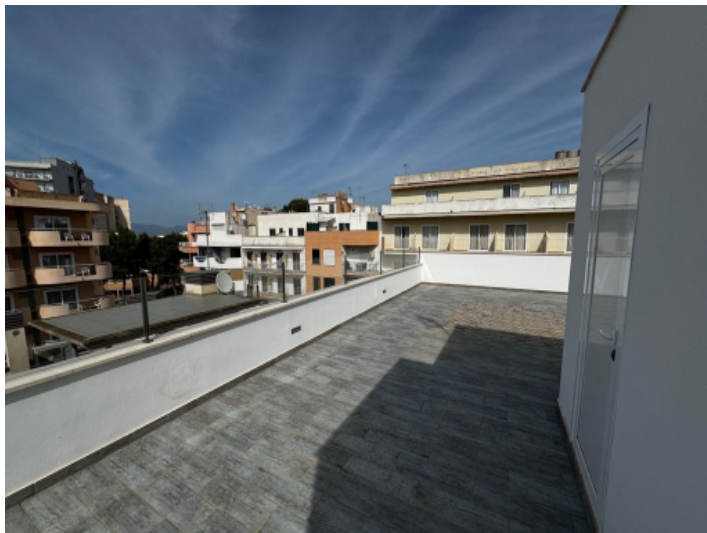
Weitere Ansicht der Dachterrasse