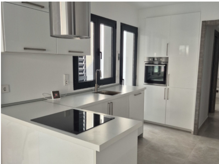
Komplett ausgestattete Küche