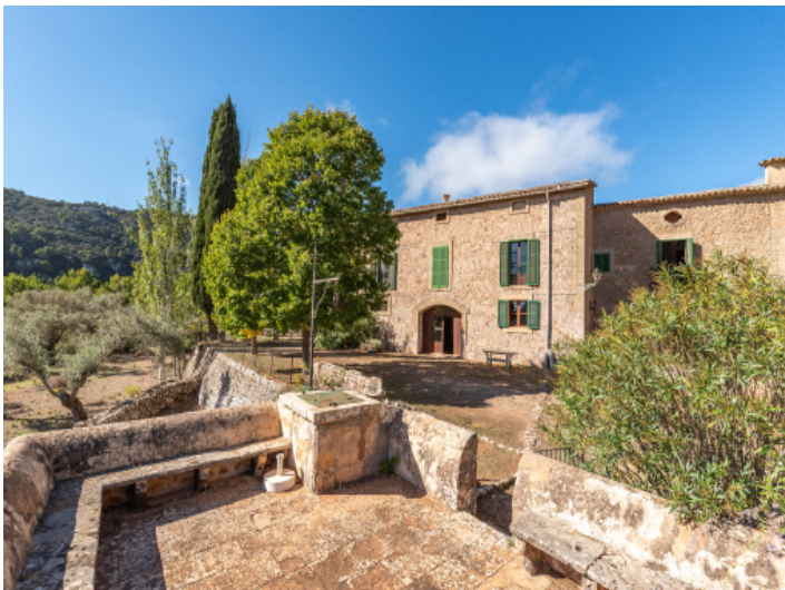
Gartenansicht auf das Anwesen