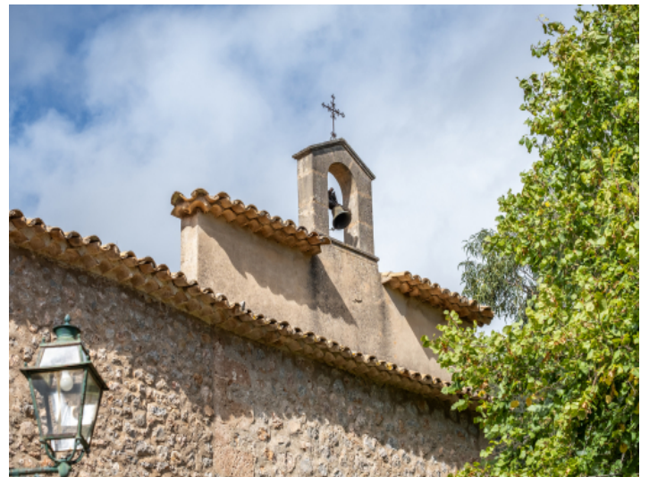
Finca mit Glockenturm