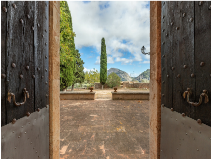
Toplage im Tramuntanagebirge