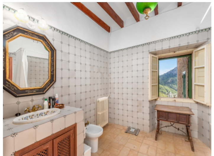
Eines von 7 Badezimmern