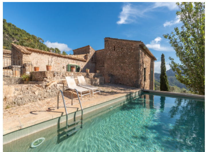
Poolbereich mit Bergblick