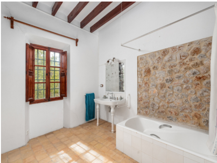
Badezimmer im Landhausstil