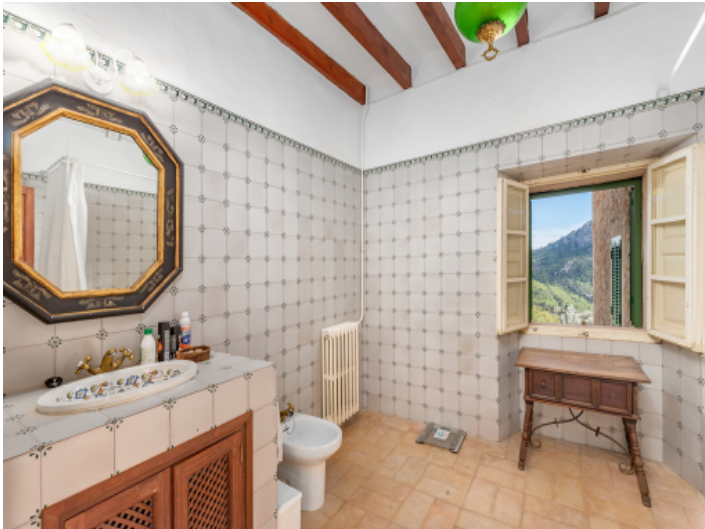
Eines von 7 Badezimmern