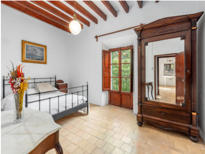
Schlafzimmer mit Holzbalkendecke