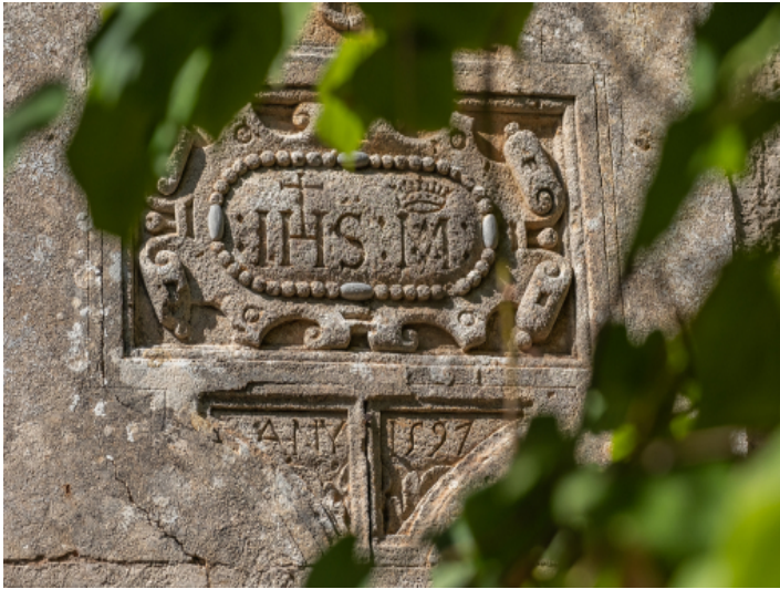
Erbaut im Jahr 1597