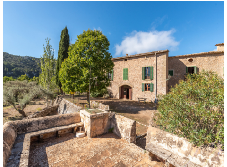
Gartenansicht auf das Anwesen