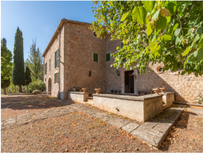
Eintauchen in Mallorcas Vergangenheit