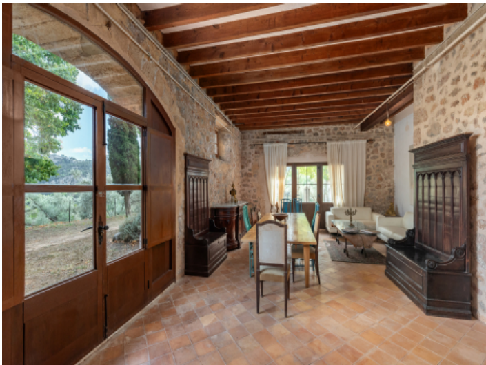
Wohn- und Essbereich mit Holzbalkendecke