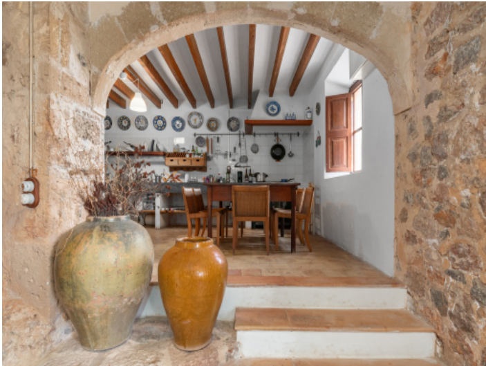
Landhausküche und Essbereich