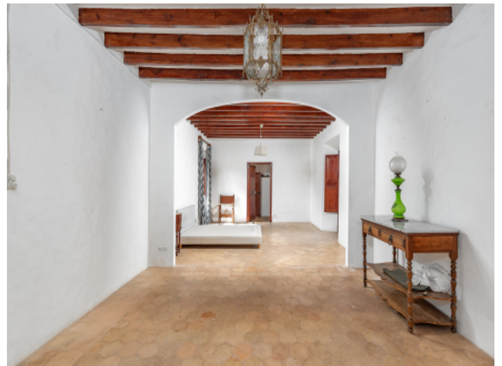
Original Terracota Fußböden