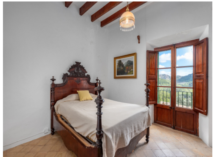
Ein weiteres Schlafzimmer