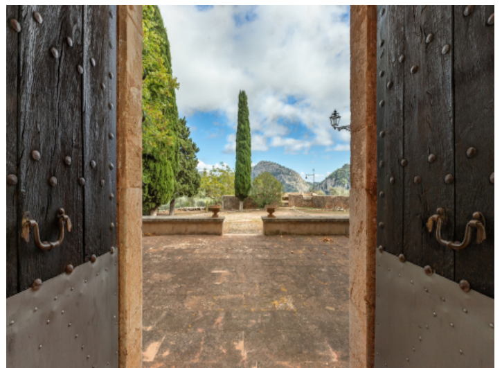
Toplage im Tramuntanagebirge