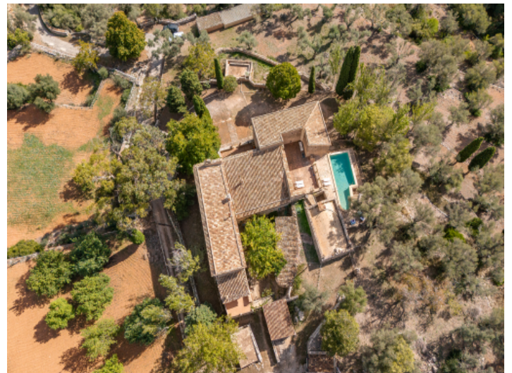
Finca mit Ferienvermietungslicenz