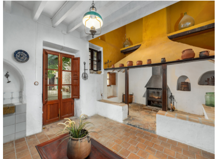
Historischer Teil der Küche