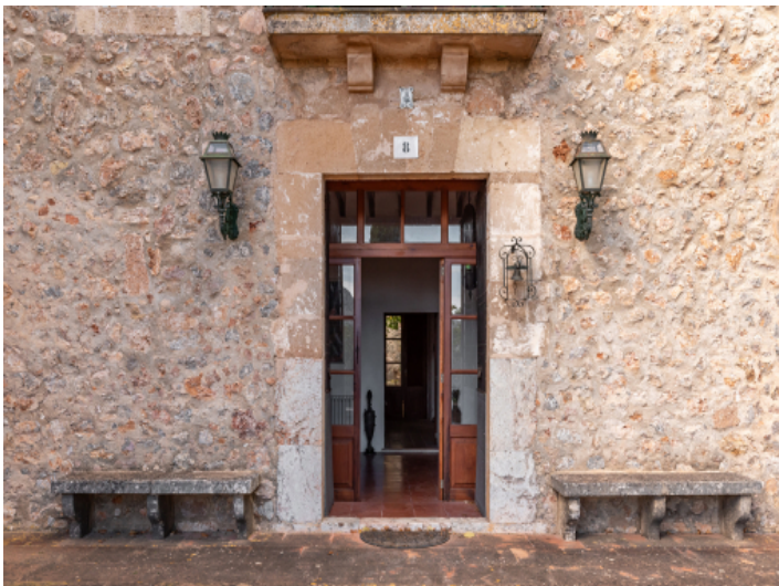
Herrenhaus mit ganz viel Charme