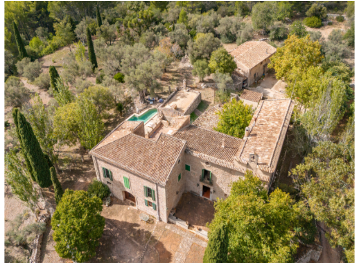
Eingebettet in die Natur