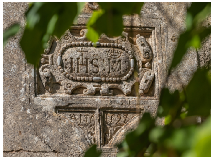
Erbaut im Jahr 1597