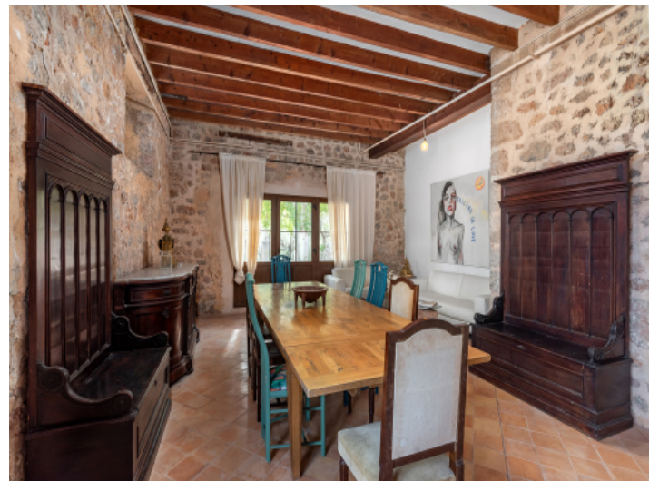
Essbereich mit Antiquitäten