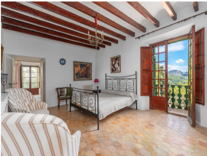
Finca mit 14 Schlafzimmern