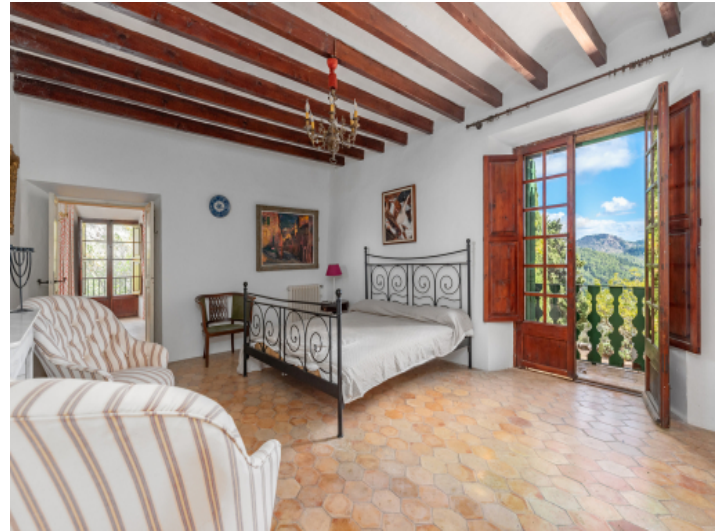
Finca mit 14 Schlafzimmern