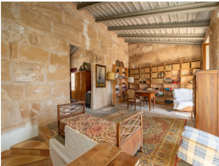
Galerie 1. Etage