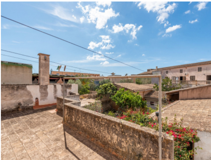
Aussicht von der Terrasse