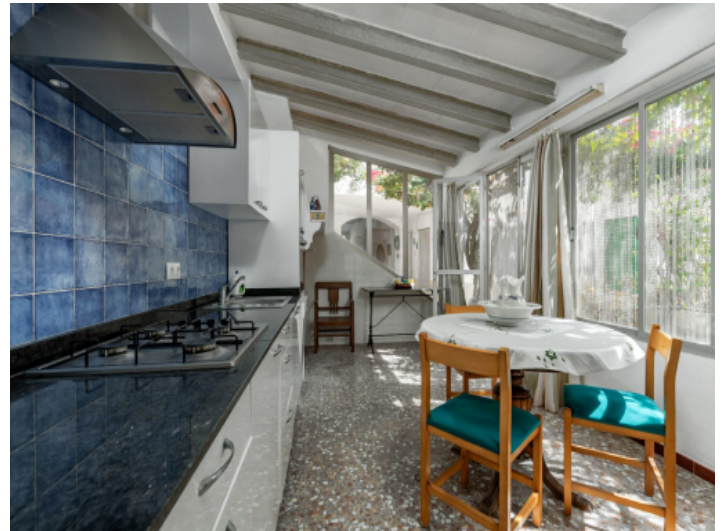
Eine weiter Küche