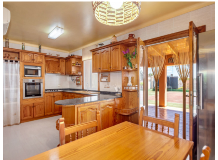
Küche im Landhausstil