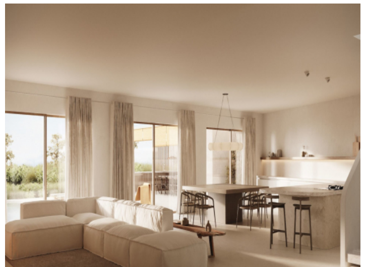
Stylisher Wohn- und Essbereich