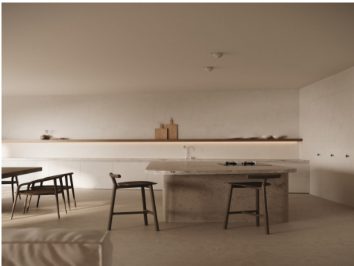
Moderne Küche mit Kochinsel