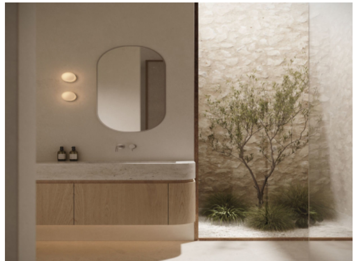
Haus mit 3 Badezimmern