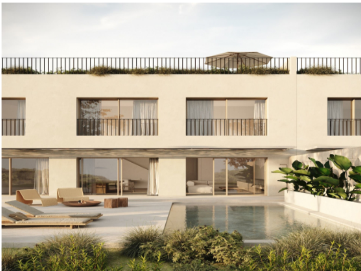
Ansicht auf das Stadthaus