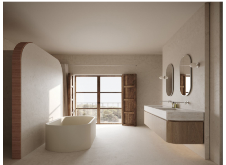
Stadthaus mit 3 Badezimmern