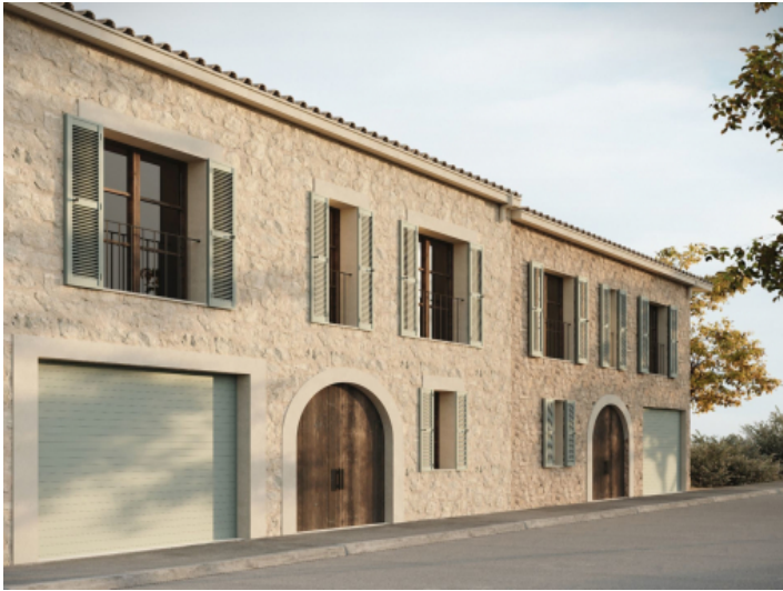
Exklusives Neubaustadthaus mit Pool und Dachterrasse in Ses