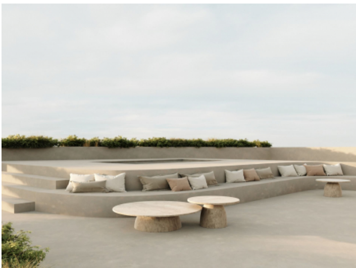
Sitzgelegenheit am Jacuzzi der Dachterrasse