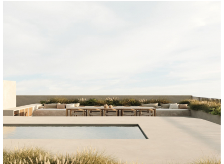
Dachterrasse mit Pool