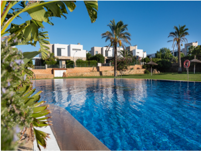
Mediterrane Wohlfühlloase - Charmante Villa mit privaten