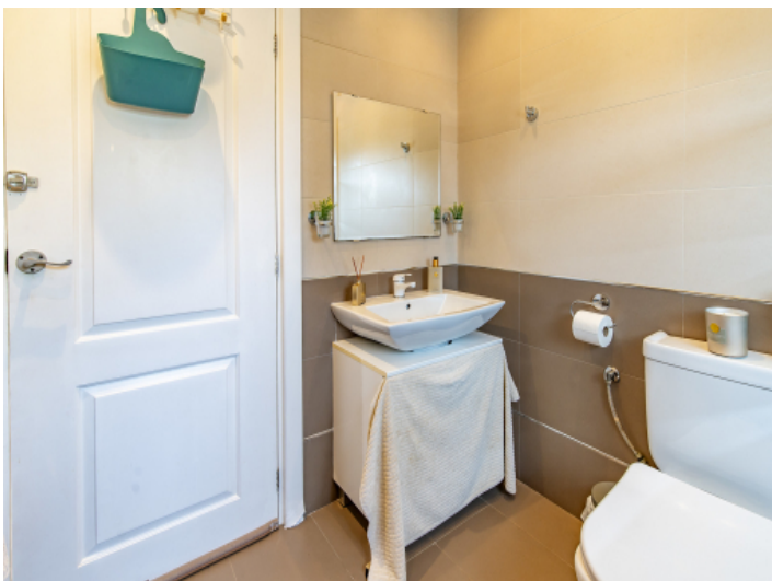
Die Finca verfügt über 2 Badezimmer