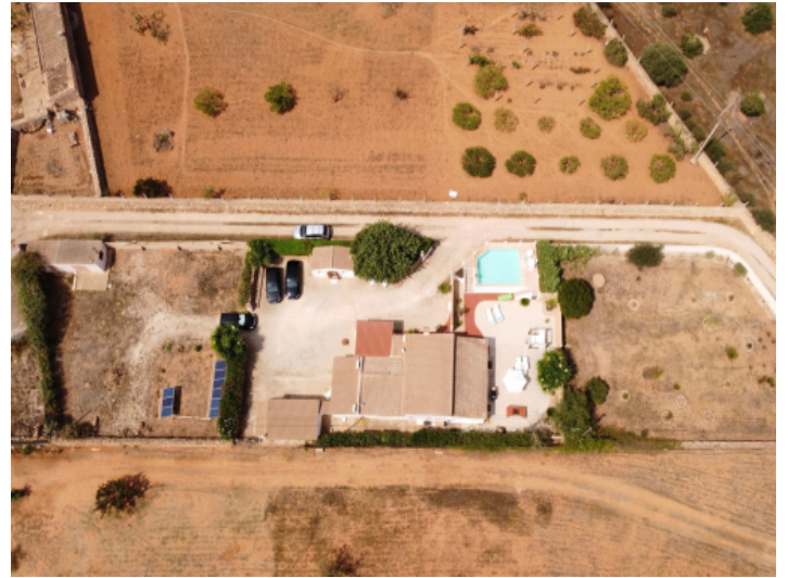
Ansicht auf das Grundstück