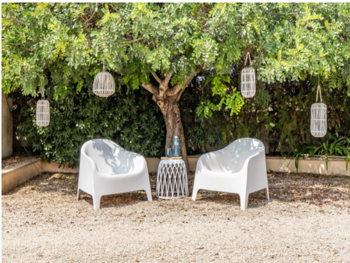
Schattiges Plätzchen im Garten