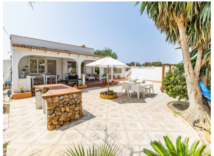
Grillbereich auf der Terrasse