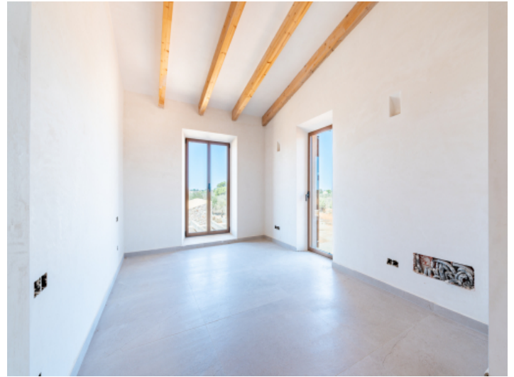
Eines von 4 Schlafzimmer