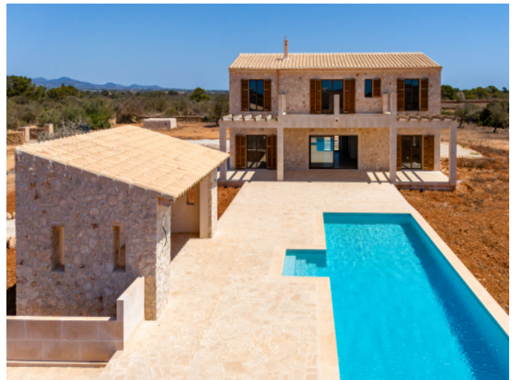
Ansicht auf die Finca