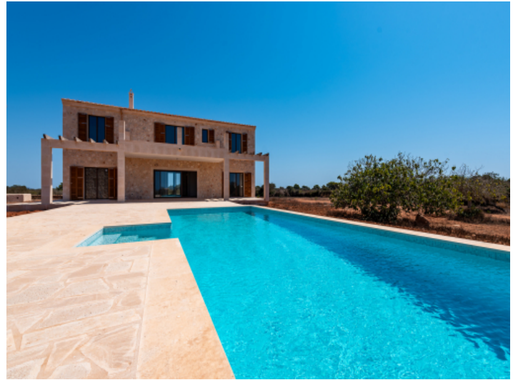
Ansicht auf die Finca