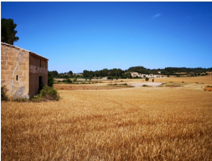
Grundstück in Toplage