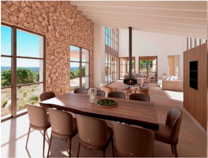
Natursteinwände im Essbereich