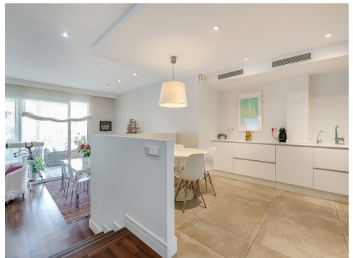
Zugang zur eleganten Küche