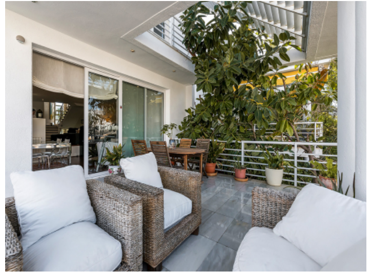
Schöne Terrasse mit Lounebereich