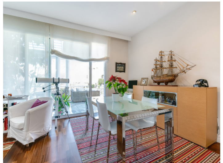
Essbereich mit Terrassenzugang