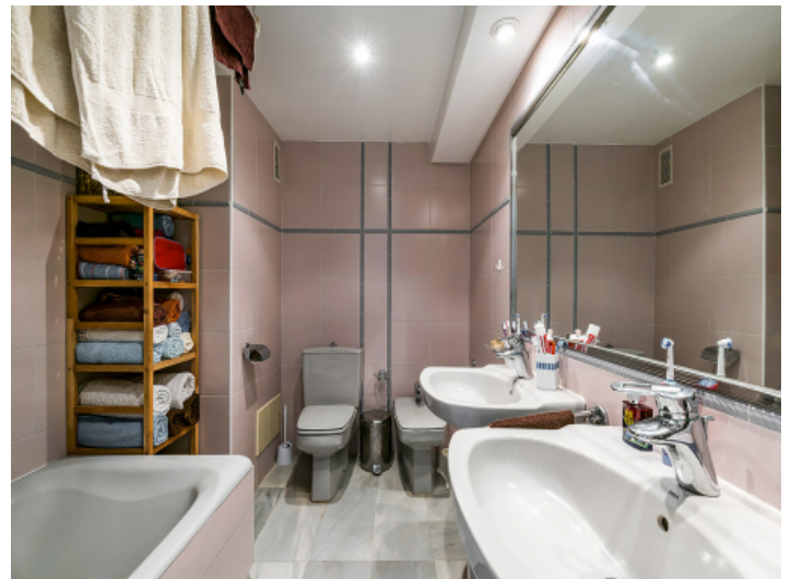
Eines von 5 Badezimmern