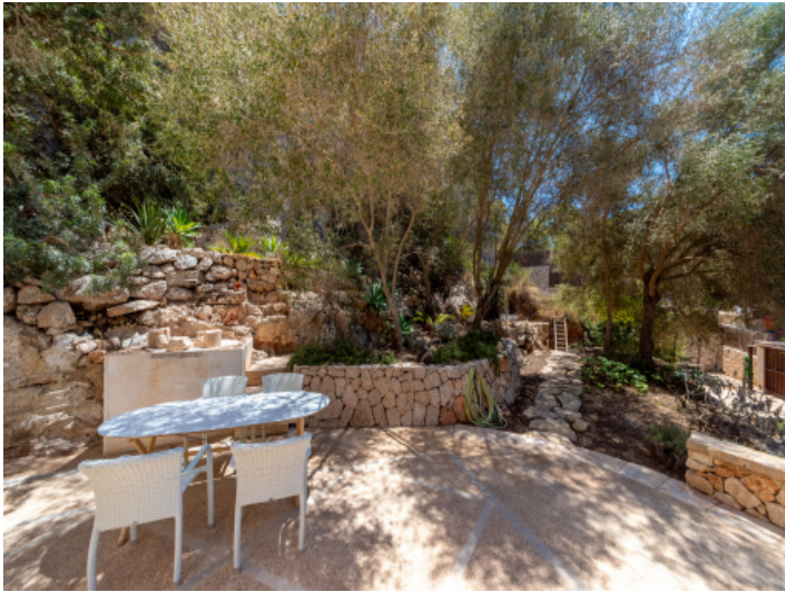
Sitzecke im Garten