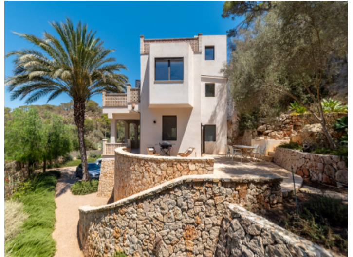
Ansicht auf das Haus