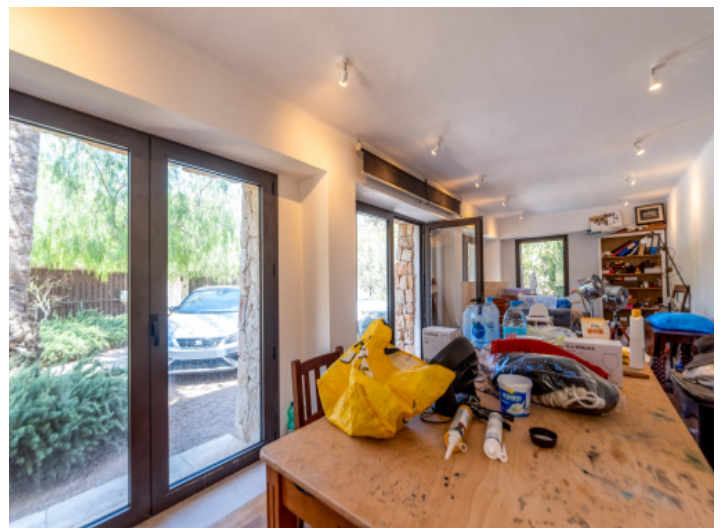
Separater ausbaufähiger Bereich