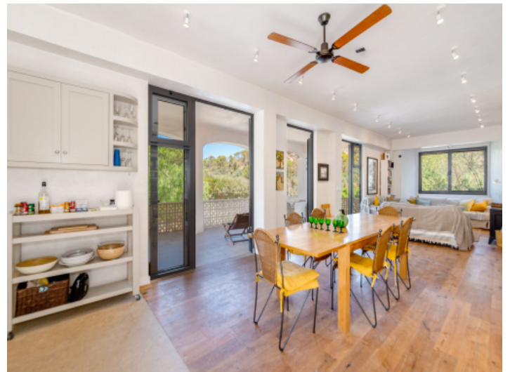
Wohn- und Essbereich