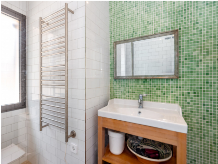
Die Villa hat insgesamt 3 Badezimmer