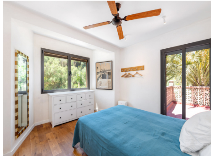
Eines von 4 Schlafzimmern