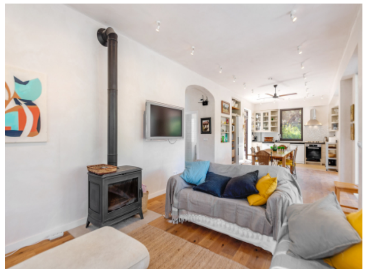
Wohnbereich mit Kamin