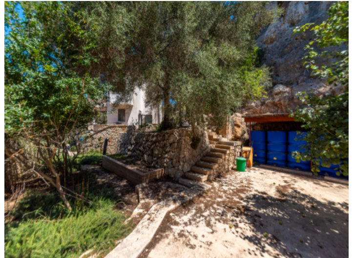
Ansicht auf das Haus und Garten