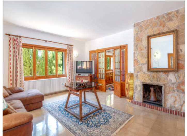
Ein weiterer Wohnbereich im OG