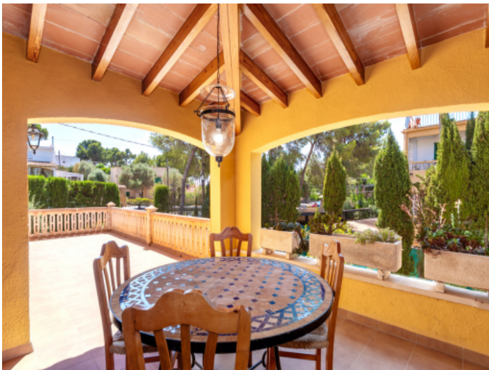
Ein weitere Terrasse