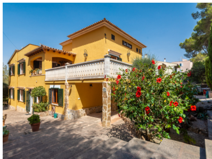
Blick auf das Haus