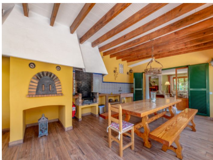
Terrasse mit Grillbereich