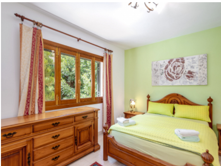
Eines von 7 Schlafzimmern