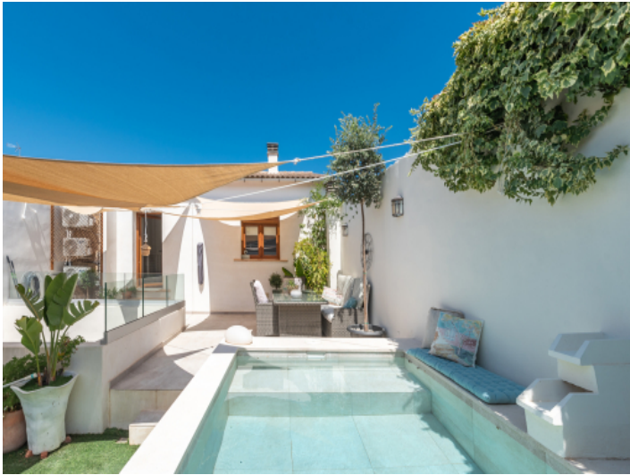
Dachterrasse mit Pool