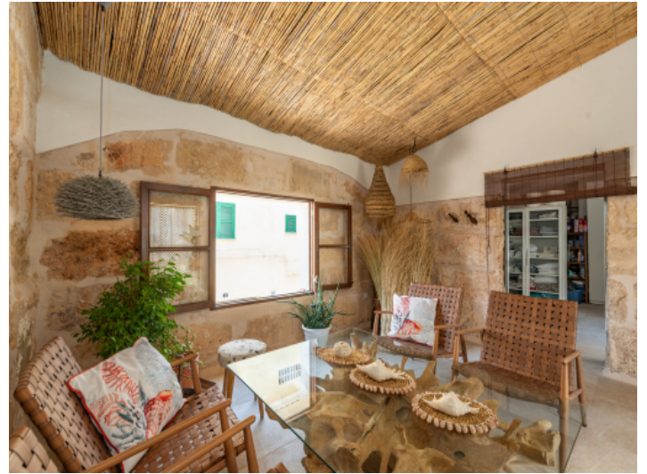
Separater Wohnbereich am Pool