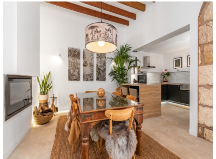
Essbereich mit Kamin