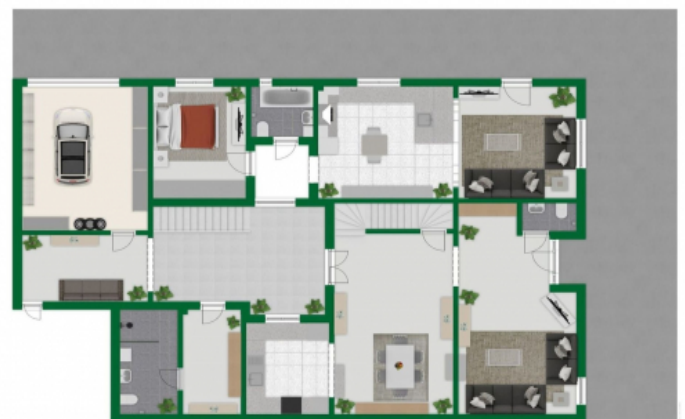
GR AB (1)_1