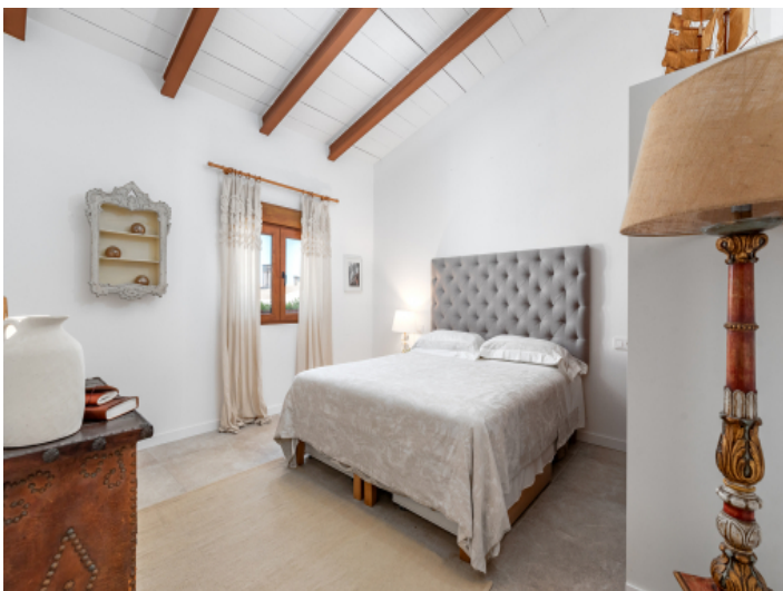
Das 3. Schlafzimmer