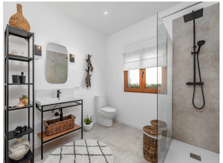
Badezimmer 1. Etage