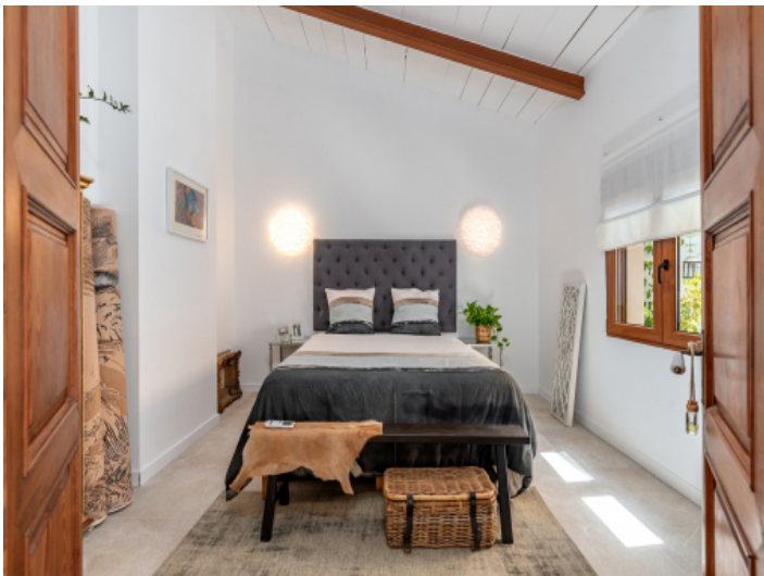
Schlafzimmer auf der 1. Etage