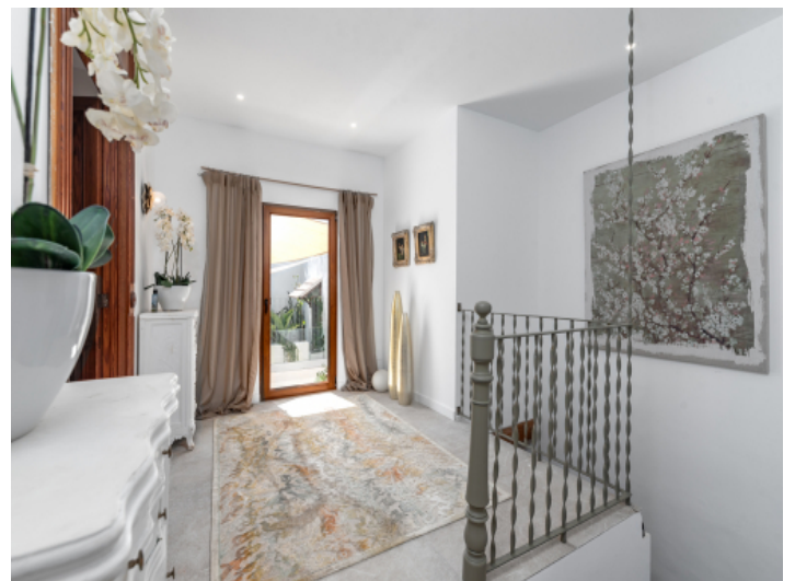
Flur im Obergeschoss