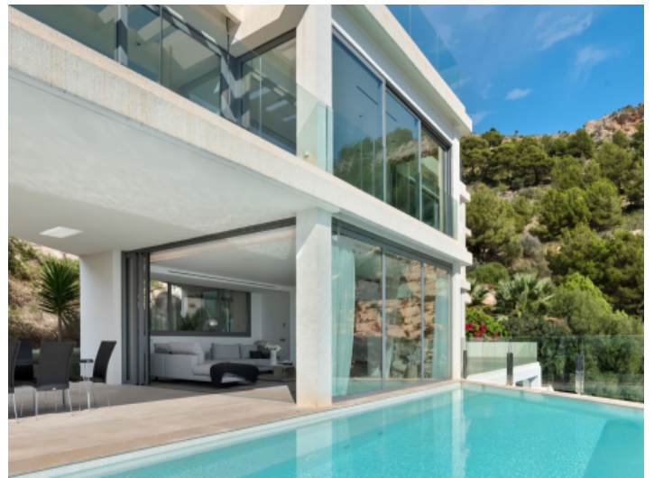
Wohnbereich und Pool