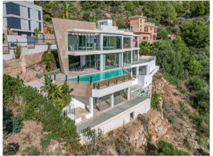
Toplage in Canyamel