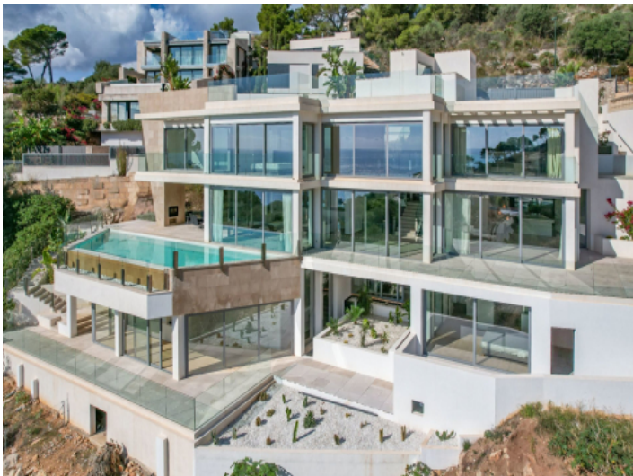
Ansicht auf die Villa