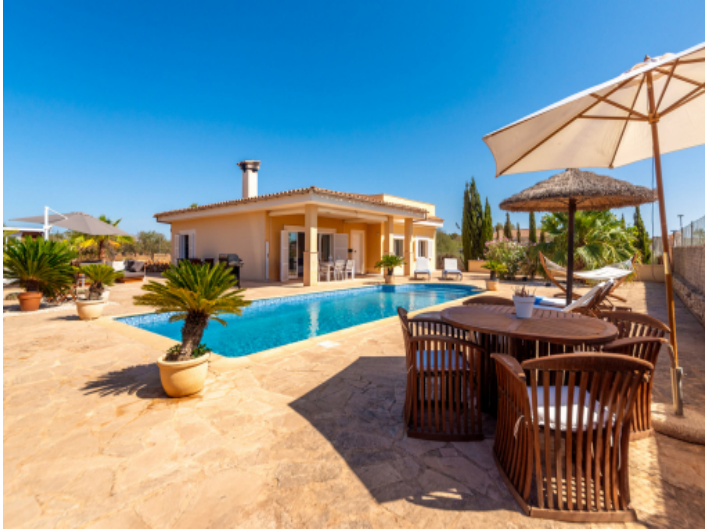
Haus, Sa Rapita